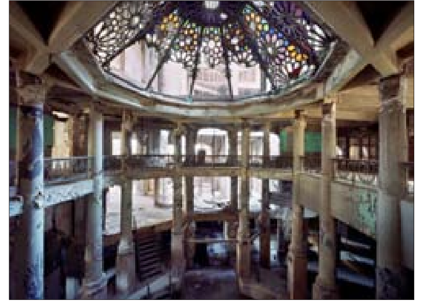
وصممت التياترو الكبير

الخشبية، تناسق كتلتها بصورة عامة بين امتداداتها وارتفاعاتها ووحدة اللغة المعمارية المستعملة فيه من حيث الإقراص والفتحات. كل هذه العوامل سمحت لأن يكون للمكان خاصية في الحقبة التي بني فيها والتي تعبر عن «الكولونيالية المستعربة» آنذاك. القيمة المعمارية المضاعفة، والتي تعود إلى مؤلفه يوسف بيك أفتمبوس الذي كان أحد أهم رواد العمارة في عصره، كان وزيراً للأشغال في عهد الانتداب الفرنسي. وعند الحديث عنه نستذكر أعماله كالتياترو الكبير والبيت الأصفر.