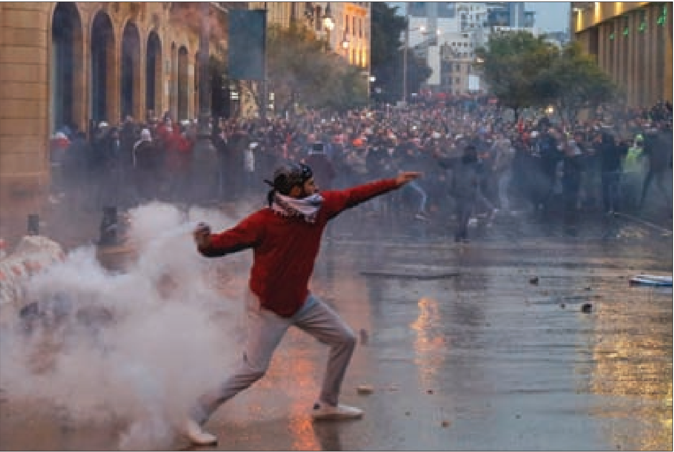
من دفع الحراك إلى العنف...؟

متنافرة من أقصى اليمين إلى أقصى اليسار، وثالثاً إدراك أنّ الاستمرار في مسلسل العنف