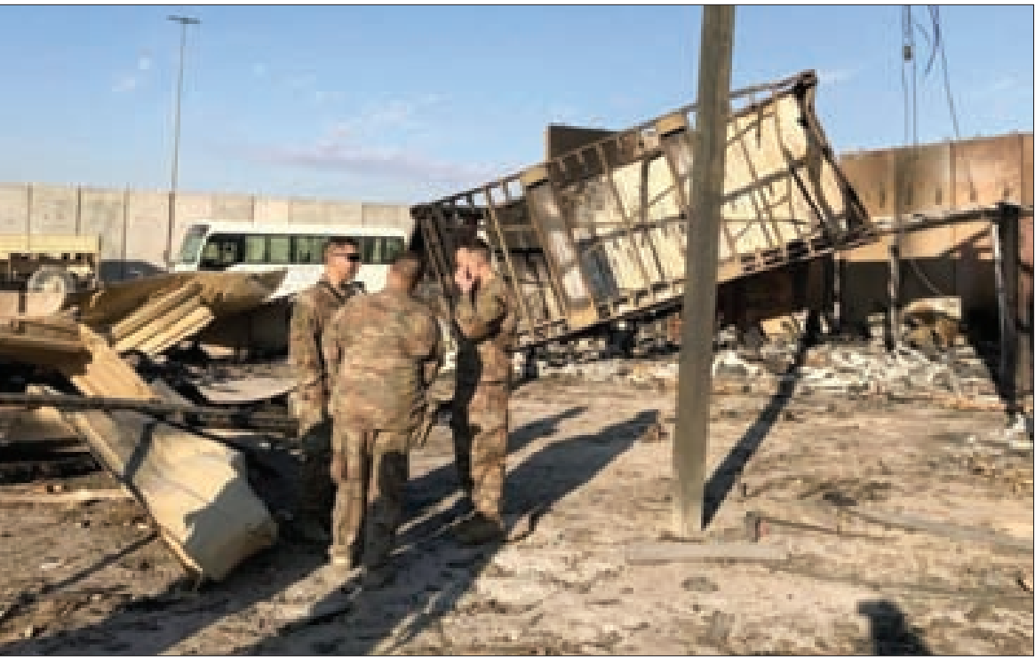
قاعدة عين الأسد الأميركية في العراق بعد ضربها بالصواريخ الإيرانية

رابعاً: الخشية من نهضة دول محور المقاومة التي أبدت تعاضداً ومساندة أوحث بالجاهزية للتحرك نحو أي عمل يقتضي استعادة توازن محور المقاومة في حال حدث خلل ما.