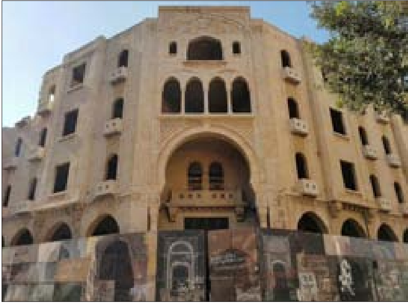
الغراندي تياترو حالياً