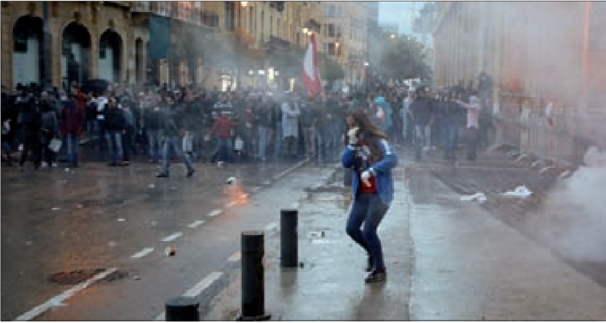
مخاطر الفوضى والعنف تترافق المساعي الأخيرة لإنجاز التشكيل الحكومية...!

حداد، التي تبنت ترشيحها الحزب السوري القومي الاجتماعي والكتلة القومية النيابية، من بين الأسماء التي اختارها الرئيس المكلف. وبهذا تولد حكومة من ثمانية عشر وزيراً تطابق الرؤيا التي يتبناها الرئيس المكلف لتشكيل الحكومة. وأضافت المصادر أن التفكير بتوسيع الحكومة الذي لا يزال يعترض عليه الرئيس المكلف، جاء بخلفية السعي لتأمين التوازنات المطلوبة طائفيًا ونيابياً، إذا تعذر الجمع بين توزيع حداد وتلبية طلبات كتلة التيار الوطني الحر بالمقاعد الأرثوذكسية، ففي حكومة الـ 24 يزيد مقعد أرثوذكسي ويصير التوزيع لأرثوذكسي يلبي طلب القوميين ممكنًا، كما يصير ممكناً منح تيار المردة فرصة تسمية أحد الاختصاصيين غير الحزبيين لمقعد كاثوليكي، وبنال التيار الوطني الحر مثله فرصة تسمية للمقعد الماروني المضاف، طالما أن لا مشكلة في المقاعد الموزعة بين الطوائف الإسلامية في صيغة الـ 18 أو في ما ستتم إضافته في صيغة الـ 24 التي لا تزال العقبة أمامها هي رفض الرئيس المكلف للسير بها. وبين الصيغتين تقدمت صيغة الـ 20 وزيراً التي يزيد فيها لصيغة الـ 18 وزيراً، وزيارن درزي وكاثوليكي، مما يتيح عملية تبديل في المقاعد والطلبات وفقاً لبعض المقترحات التي لا تزال تلاقى اعتراضاً من القوميين والمردة.