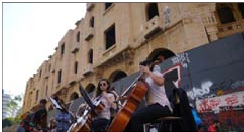
إعادته إلى الذاكرة مع الاحتجاجات المطالبة

القيمة المعمارية: تصميم التياترو تصميم المسارح الحديثة، من الخشبية الواضحة، السقف الذي يفتح، الشرفات التي تطل على