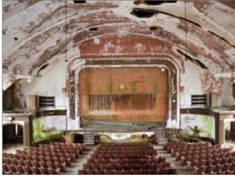
المسرح بعد أن دُمّر إبان الحرب الأهلية