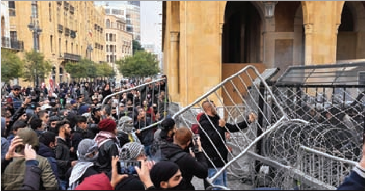
من المواجهات بين المتظاهرين والقوى الأمنية