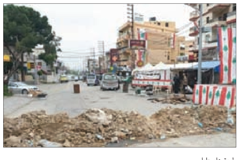
طريق عام حلبا