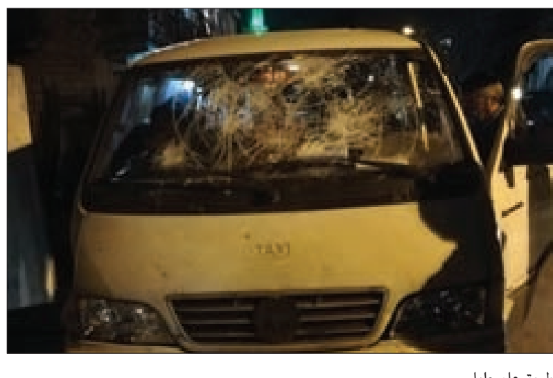
طريق عام حلبا