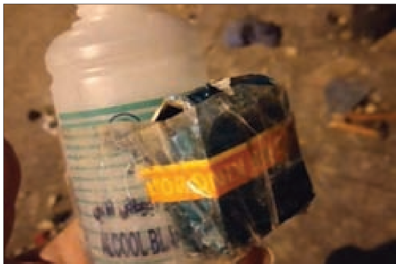
عبوات مثيري الشغب