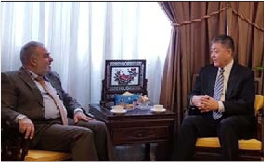
عميد الخارجية والسفير الصيني

اغتيال اللواء قاسم سليمانى وأبو مهدي المهندس، وهما شخصيتان رسميتان في بلديهما، وكان الرأي متفقاً على أن هذا الاغتيال هو تصعيد غير مسبوق، ويلقي على الإدارة الأميركية مسؤولية كاملة عن انتهاك سيادة العراق وتضييق استقرار المنطقة. وأكد الجانبان أن انتهاك سيادة أي بلد هو انتهاك للقانون الدولي، وأن مسؤولية كل دول العالم أن تتوحد لمنع الانتهاكات، ولتحصين السلم والأمن الدوليين.