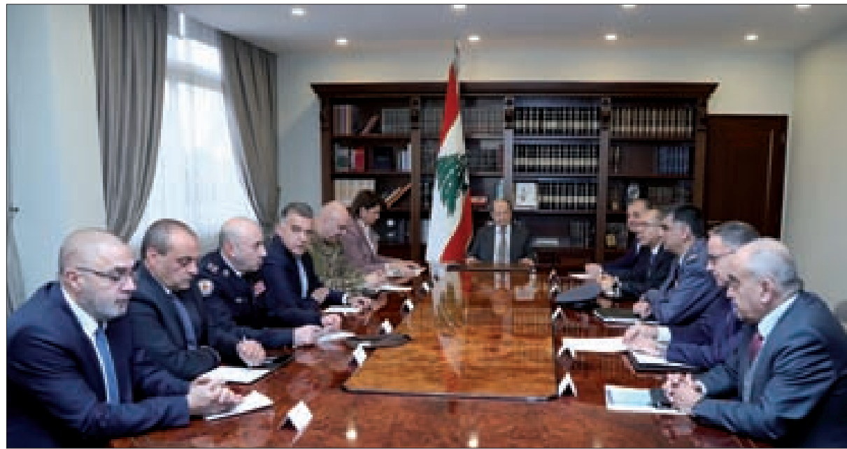
عون مترشساً الاجتماع الأمني في بعداً أمس (الدايتي ونهرا)

يتمسك ببقائها عند رقم الـ 18 وزيراً، وبمواصفات للتشكيلة الحكومية تطابق نظرتها بكونها رغم تسميات القوى السياسية والنيابية لوزراء، ستبقى من الاختصاصيين غير المنخرطين عضواً في مؤسسات العمل الحزبي لإبعاد الحكومة عن الصراعات الجانبية، ونيل ما يرتقبه من قبول في جماعات الحراك وفي الخارج الغربي والعربي. نهار وليل وأمس شهدا مشاورات واجتماعات، كان أبرزها غداء جمع الرئيس المكلف حسان دياب ورئيس تيار المردة الوزير السابق سليمان فرنجية بحضور المعاون السياسي لرئيس مجلس النواب وزير المالية في الحكومة المستقلة علي حسن خليل والمعاون السياسي للأمين العام لحزب الله السيد حسن نصرالله الحاج حسين الخليل، وكان الطبق الرئيسي على المائدة طبق العشرين وزيراً للحكومة كمنجز يمكن أن يتيح الخروج من الأزمة، والصيغة المطروحة بدأت بعرض وزير كاثوليكي مضاف إلى فرنجية ووزير درزي آخر يعرض على القومي، وفيما قوبلت الصيغة بتمسك فرنجية بتمثيله بوزير ثانٍ أرثوذكسي لا كاثوليكي باعتبار البيئة السياسية للمردة شمالاً ليس فيها كاثوليكي، بينما تمسك القومي عبر التشاور الذي تمّ معه بتزكيته لنقبيّة المحامين السابقة أمل حداد، مجدداً التأكيد (النتمة ص8)