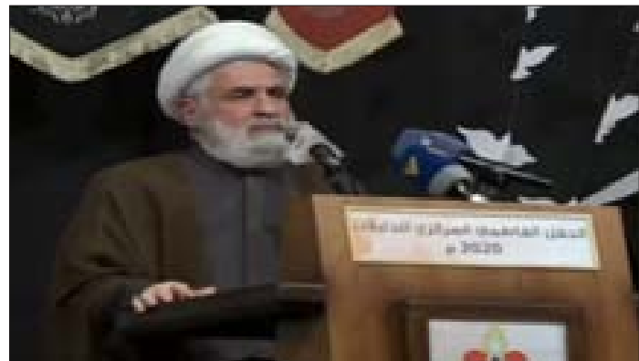
قاسم متحدتاً في النبطية

وعد حزب الله بأنه سيواصل بذل كل الجهود لتكون ولادة الحكومة قريبة قدر الإمكان معتبراً أن العقد المتبقية ليست جوهرية وهي قابلة للتذليل والمعالجة. وفي هذا السياق، دعا نائب الأمين العام لحزب الله الشيخ نعيم قاسم الأفرقاء المعنيين بتشكيل الحكومة إلى بذل التضحيات بعيداً عن الحصص والتوزيع، وقال «نحن كحزب الله لا نستطيع وحدنا أن نشكلها، لا بد من إقناع الأجزاء الأخرى ولا بد من التعاون مع الكل». وعد قاسم في كلمة له خلال حفل لكشفة المهدي في مدينة النبطية، أن «حزب الله سيواصل بذل كل الجهود وسيحاول لتكون ولادة الحكومة قريبة قدر الإمكان حتى لا نصل إلى المزيد من التدهور المالي والاقتصادي والاجتماعي». وأعتبر أن «الاعتداء على الممتلكات العامة والخاصة هو شغب لا نوافق عليه ولا يؤدي إلا إلى المزيد من التازيم للوضع داخل البلد، لذا علينا أن نضعف جميعاً ونساهم في إخراج الحكومة من علق الزجاجة لتكون بعد ذلك حكومة كل لبنان لأن طريقة اختيارها حصل وفق الآليات الدستورية ووفق القواعد المعتمدة بطريقة قانونية».