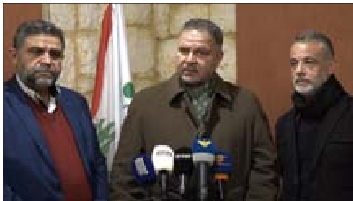
.. وقيام متحدتاً في الاحتفال بذكرى تأسيس محمية وادي الحجير- السلوقي الطبيعية

وعد حزب الله بأنه سيواصل بذل كل الجهود لتكون ولادة الحكومة قريبة قدر الإمكان معتبراً أن العقد المتبقية ليست جوهرية وهي قابلة للتذليل والمعالجة. وفي هذا السياق، دعا نائب الأمين العام لحزب الله الشيخ نعيم قاسم الأفرقاء المعنيين بتشكيل الحكومة إلى بذل التضحيات بعيداً عن الحصص والتوزيع، وقال «نحن كحزب الله لا نستطيع وحدنا أن نشكلها، لا بد من إقناع الأجزاء الأخرى ولا بد من التعاون مع الكل». وعد قاسم في كلمة له خلال حفل لكشفة المهدي في مدينة النبطية، أن «حزب الله سيواصل بذل كل الجهود وسيحاول لتكون ولادة الحكومة قريبة قدر الإمكان حتى لا نصل إلى المزيد من التدهور المالي والاقتصادي والاجتماعي». وأعتبر أن «الاعتداء على الممتلكات العامة والخاصة هو شغب لا نوافق عليه ولا يؤدي إلا إلى المزيد من التازيم للوضع داخل البلد، لذا علينا أن نضعف جميعاً ونساهم في إخراج الحكومة من علق الزجاجة لتكون بعد ذلك حكومة كل لبنان لأن طريقة اختيارها حصل وفق الآليات الدستورية ووفق القواعد المعتمدة بطريقة قانونية».