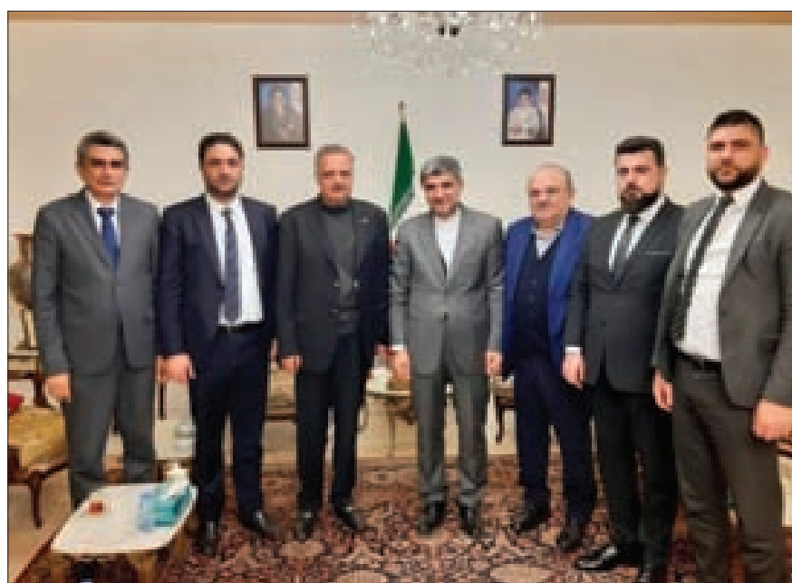
أرسلان والوفد مع السفير الإيراني

زار رئيس الحزب الديمقراطي اللبناني النائب طلال أرسلان على رأس وفد، سفارة الجمهورية الإسلامية الإيرانية في بيروت، لتقديم التعازي بقائد فيلق القدس في الحرس الثوري الإيراني اللواء قاسم سليمانى ورفاقه، وكان في استقباله السفير الإيراني محمد جلال فيروزنيا.