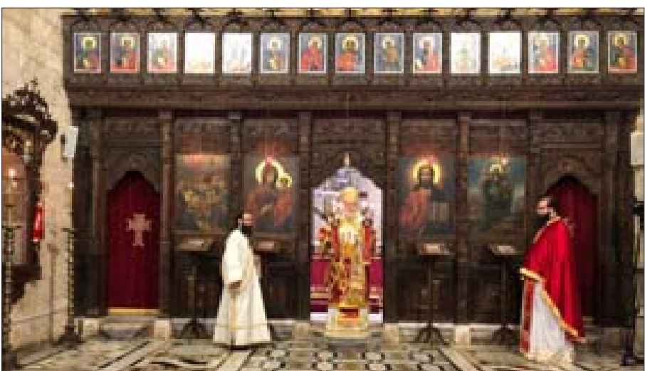
يازجي مترشسا القداس في الملمند

تشكل حكومة تنتشل الوطن من عمق الأزمة». واعتبر أن «من غير المقبول أن يستمر تقاذف المسؤوليات والمواطن يجوع ونسبة كبيرة من الناس لا يحصلون على رواتبهم، في ظل ازدياد البطالة والصعوبات في الحصول على الأموال وعجز الناس عن تسديد المستحقات»، ودعا جميع المسؤولين إلى أن «يحيوا لبنان». وإذ ذكر بأن «كنيستنا الأفرنجية تمرّ بمرحلة دقيقة تستوجب تكثيف الصلوات والابتعاد عن تاجيح الخلافات»، دعا الشعب إلى «عدم تصديق الروايات التي تضعف الثقة بالكنيسة»، مؤكدا أن «كنيستنا الأنطاكية لن تتسامح على الحق وستبقى تدافع عن قضايا هذا الشرق». بعد القداس، استقبل يازجي المؤمنين في قاعة الدين.