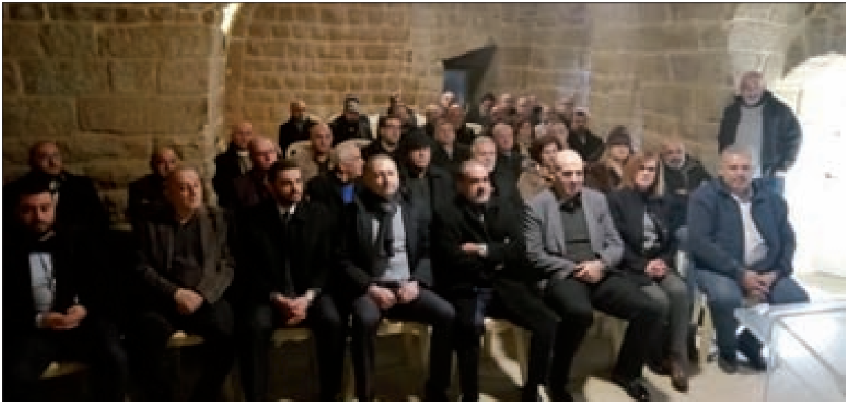
لحود خلال زيارته دير المزريرة