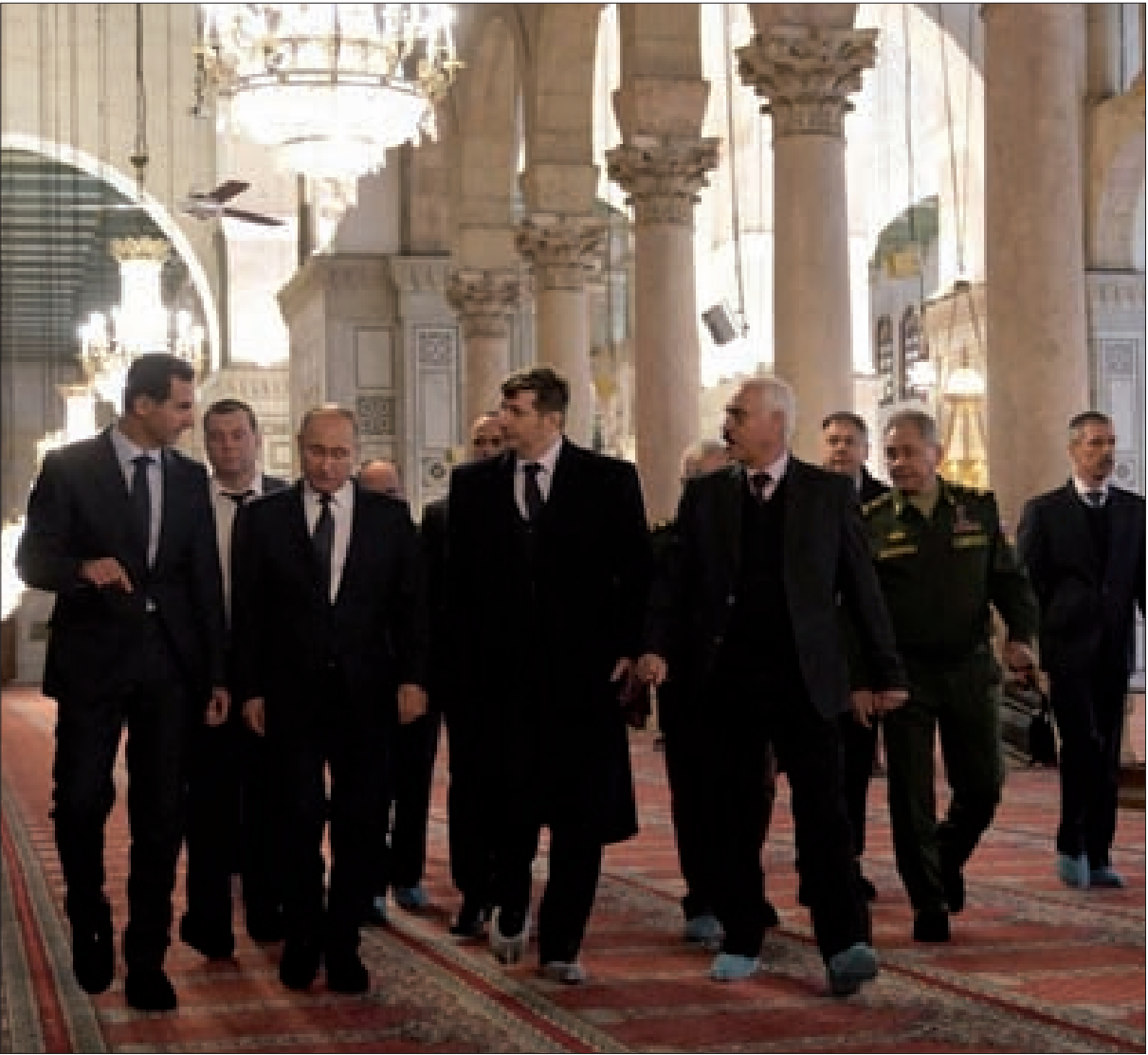
الرئيسان الأسد وبوتين خلال تجوالهما في دمشق

ثانياً، المعطيات التي كانت سائدة سنة 2003 على الصعيد الدولي والإقليمي لم تعد قائمة. فروسيا استعدادت مكائنتها الدولية وأصبحت موجودة بنقل وازن في المشرق العربي، كذلك الأمر بالنسبة للصين التي عبرت عن وجودها السياسي عبر المنقّفات الاقتصادية مع العراق بما يوازئ 500 مليار دولار لبناء البنى التحتية وعبر المشاركة في المناورات البحرية مع روسيا والجمهورية الإسلامية في إيران في بحر العرب، كما أنّ القدرات العسكرية لمكوّنات محور المقاومة تعزّزت بشكل تجعل المحور برزقته عاملاً استراتيجياً في المعادلة الإقليمية. والقوّة هنا في المحور باكمله وليس في قوّة القدرات الذاتية لمكوّنات المحور. فالمحور يعطي قيمة مضافة لكل المكوّنات