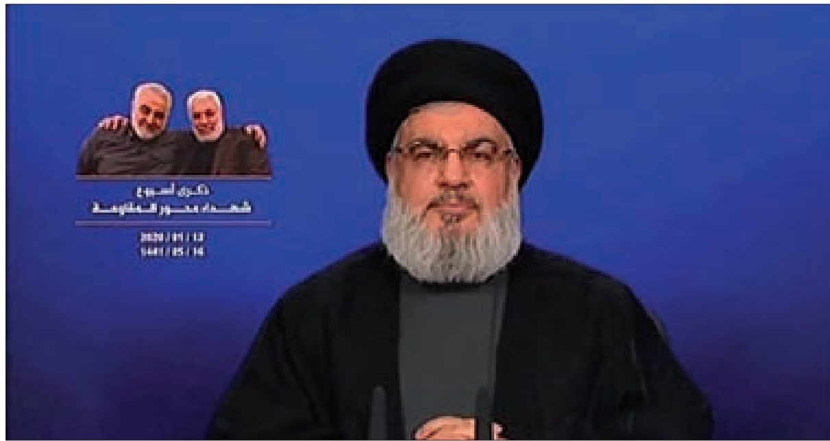
السيد نصرالله متحدثاً في ذكرى أسبوع شهداء محور المقاومة