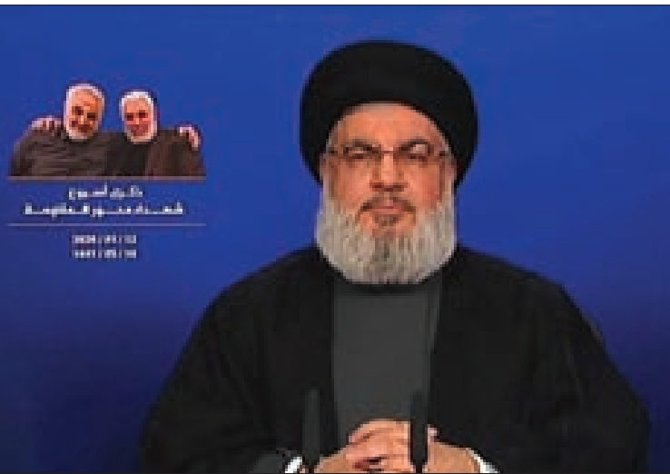
نصرالله متحدًا في ذكرى أسبوع شهداء محور المقاومة

ومعنا الأخوة السوريين».. وأوضح أن سليمان «كان بإمكانه أن يبقى في طهران ويرسل الدعم إلى العراق ولكنه فتح الحدود وحضر في اليوم التالي إلى بغداد وادعش في تلك الأيام كانت الحشد تقوم بعملية تطهير أمنية لأن دول بالمنطقة، وعندما استشهد الحاج سليمان وابو مهدي المهندس كانت قوات الحشد تقوم بعملية تطهير أمنية لأن داعش استغلت الأحداث لتستعيد قتلها ومجازرها بحق العراقيين».. وأشار إلى أنه «لولا تهزم داعش بالعراق لكانت هدت كل دول المنطقة، والهزيمة في العراق ساعدت بهزيمتها بسورية ولولا هزيمتها كانت دول الخليج التي قدمت كل شيء لداعش في خطير وإيران في خطر وتركيا في خطر وكان اسم سيضي على طابعه»..