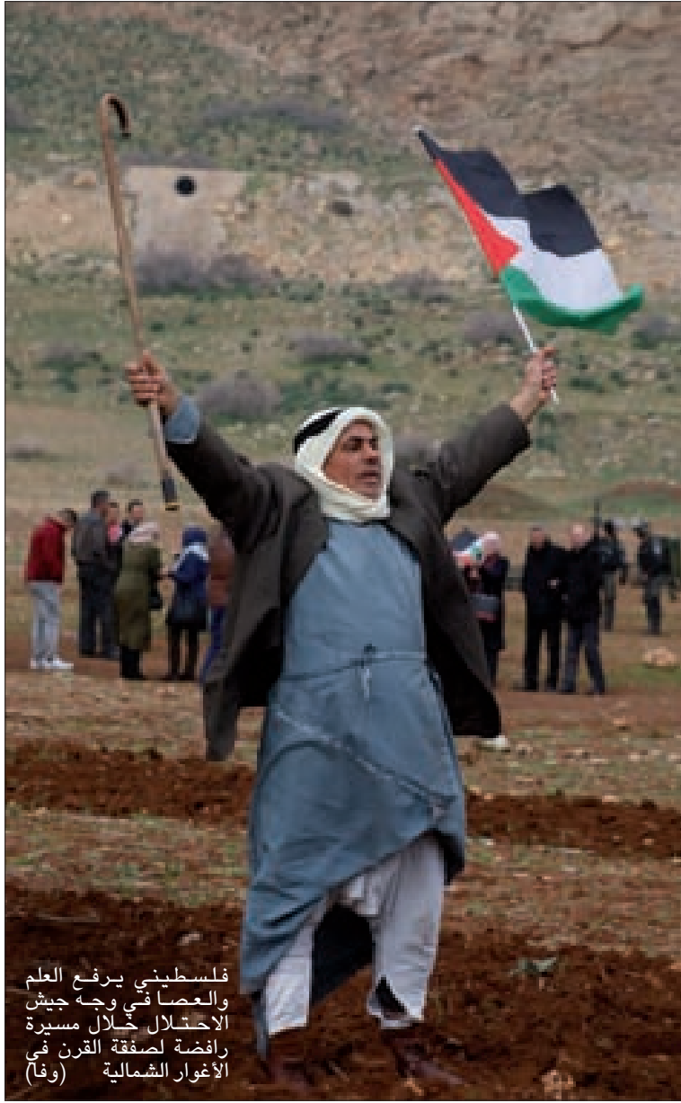
فلسطيني يرفع العلم والعصا في وجه جيش الاحتلال خلال مسيرة رافضة لصفقة القرن في الأغوار الشمالية (وفا)