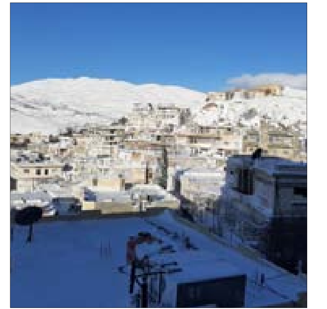
الصور لقلعة جندل إقليم جبل حرمون

7 درجات مئوية نهاراً كما تضعف حدة الصقيع ليلاً عن الليلة السابقة. وبدءاً من ساعات بعد الظهر والمساء تتأثر الجمهورية بامتداد منخفض جوي متوسطي يؤدي إلى هطولات خفيفة إلى متوسطة بشكل عام تكون في بدايتها هطولات ثلجية تشمل أغلب المناطق مع هطولات مطرية غزيرة نسبياً على المناطق الساحلية.