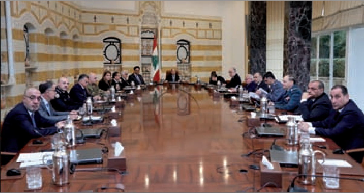
عون مترسماً اجتماع مجلس الدفاع الأعلى في بعبداء أمس