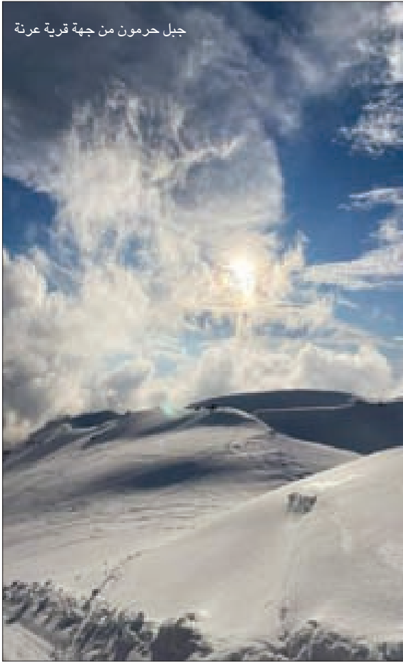
جبل حرمون من جهة قرية عرنة