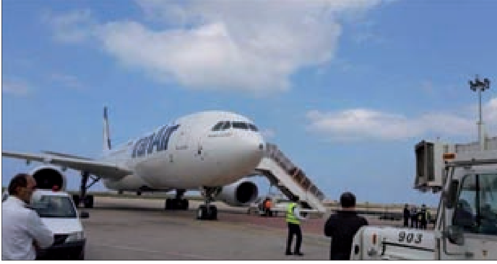
الطائرة الايرانية في مطار بيروت