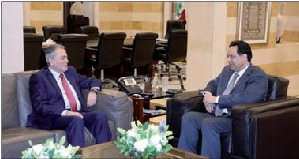
رئيس الحكومة حسان دياب مستقبلاً سفير سورية علي عبد الكريم علي في السراي أمس

صغيرة، لكنها تستند إلى إرادة شعبها، وقد جاء الاختبار صامداً لكل الأوهام والحسابات الخاطئة، وصار محرّضو تركيا على مواصلة التورط أمام ترجمة وعودهم بالدعم بصورة عملية لا يتحملون كلفتها ولا يريدونها. وصار النظام التركي أمام خيار المواجهة المكلفة أو البحث عن مخارج جانبية. وعلى المسار الإسرائيلي قال المرجع الدبلوماسي العربي، إن اختيار حركة الجهاد الإسلامي هدفاً للتصعيد يكشف بوضوح تشخيص كيان الاحتلال معركته مع محور المقاومة، وإن هذه هي المرة الثانية التي تفشل فيها حكومة الاحتلال وجيشها بتحمل تبعات التحرش بحركة الجهاد منفردة، وتضطر للتراجع وتصدر بياناً يشبه الاعتذار بقولها، إن الجولة الأخيرة كانت نتاج خطأ عملياتي، وإضافتها أنها تريد العودة بالأمور إلى الوضع الطبيعي، ذلك لأن ردّ الجهاد على الاعتداءات الإسرائيلية كان قاسياً ورادعاً ووضع جيش الاحتلال بين خيارين المواجهة الشاملة أو التراجع. ورأى المرجع في عودة التهديد إلى جهات غزة، وفي كلام وزير خارجية روسيا سيرغي لافروف عن توقعات بالوصول لتفاهات مع تركيا قبل القمم المقترحة، رسالة واضحة لأنقرة بضرورة التفاهم مع موسكو أولاً قبل (النتمة ص8)