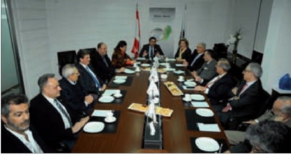
اجتماع مجلس إدارة تجمع رجال وسيدات الأعمال اللبنانيين في العالم

وقال: «باسم رجال وسيدات الأعمال اللبنانيين في العالم نذكر أن الوقت يدهمنا، لأنه لم يعد لدينا رفاهية الوقت، وعلى الفريق التنفيذي اتخاذ قرارات سريعة وشجاعة، ومصارحة الشعب والمودعين وحاملي السندات بحقيقة الوضع، خصوصاً باقتراح خطة متكاملة وإعادة هيكلة جذرية ولا سيما تنفيذها وملاحقتها اللتان كانتا دائماً نقطة ضعفنا». وشدد على أن «أزمنا الأساسية هي أزمة نقمة بامتياز. لذا يجب إدراك هذا الأمر الخطير بالشفافية التامة والتواصل مع المجتمع الداخلي والخارجي، والقبول بالواقع المؤلم، للبدء في مواجهة الخروج من الأزمة في أسرع وقت ممكن».