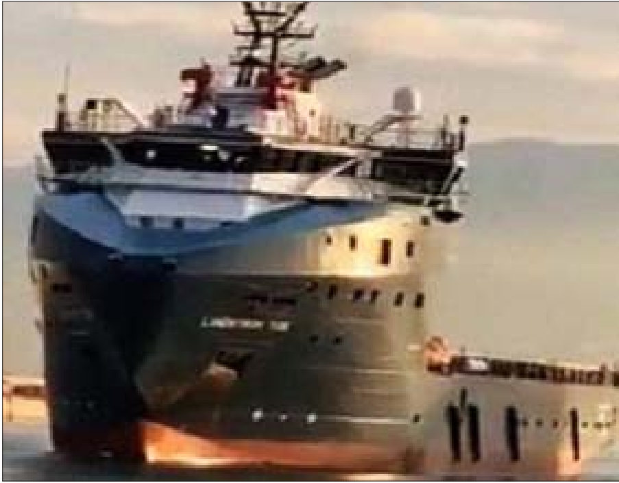
بدء الحفر والتنقيب عن النفط والغاز في البلوك رقم 4 يدخل لبنان في مرحلة جديدة

ويبرز خبراء ماليون واقتصاديون لـ «البناء» أهمية دخول لبنان الى النادي النفطي الدولي: أولاً يساعد في تحسين تصنيف لبنان الائتماني بعد تصنيفه الى درجة دنيا مؤخراً، ثانياً تحسين الموقف التفاوضي للبنان بعملية إعادة هيكلة الدين، أي بات بإمكان الحكومة التفاوض مع الدائنين من موقع القوة. ثالثاً يمنح نوعاً من الثقة الدولية للبنان الذي لديه احتمالات كبيرة لامتلاك مصادر الطاقة وبالتالي يحوله الى اقتصاد واعد. رابعاً الحصول على عائدات تجارية يمكن من إنشاء الصندوق السيادي للاستثمار وهو يُعتبر أهم البنود الإصلاحية.