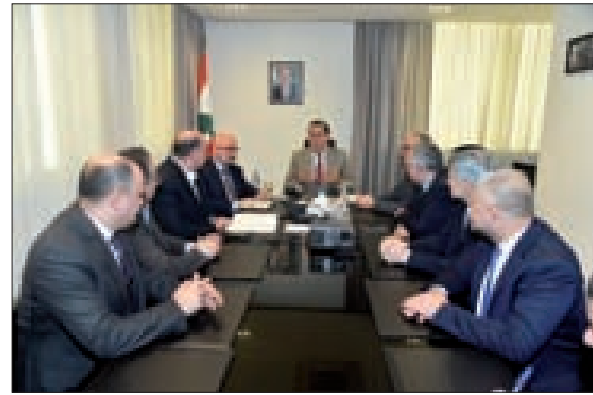
حب الله خلال اجتماعه بنقابة أصحاب الصناعات الغذائية

المشروعة، والقدرة التنافسية في الخارج، والتأكيد على التزام الإنتاج بحسب المواصفات والجودة العالية». وشدّد حب الله على «هذا الأمر حفاظاً على سلامة الغذاء وصحة المستهلك، واقتراح إقامة صناعات غذائية جديدة تجذب الاستثمارات، تكون مرتبطة