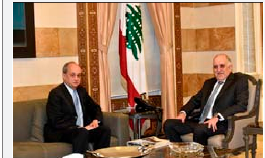
فهمي وسفير إسبانيا

المطران جوزف خوام، وجرى البحث في شؤون مختلفة. ■ علّق النائب السابق إميل رحمة على ما ورد في عظة المطريرك الماروني الكاردينال بشارة الراعي لجهة دعوته الجميع إلى موازنة الحكومة الجديدة، مضمناً عالياً «الكلام المسؤول ورفع الشان» للراعي، ومشيراً إلى تمسكه بترداده حرفياً: «إن الانتظار موجهة إلى الحكومة الجديدة التي تسلمت كرة النار بشجاعة، آملّة بموازنة الجميع في الوصول إلى خلاص مركب الوطن من الغرق، ويجب ألا يُنظر إلى الحكومة بموقف المتفرج والمشكك، بل بموقف المؤازر والمسؤول فكلاً مسؤولون عن كلنا». وختم رحمة «وعليه فليس غريباً على المطريرك الماروني أن يكون على قدر المسؤولية التاريخية التي عهدناها في الأحبار الكبار عندما تدلّهم الخطوب في وطننا وتبرز الاستحقاقات الصعبة».