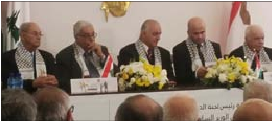
المحتدثون خلال إطلاق الحملة

العودة ومحاولة شطب عنوان أساسي من عناوين القضية الفلسطينية»، وأشار إلى «إننا أمام تحولات دولية وأوروبية لصالح قضيتنا الفلسطينية»، داعياً إلى «استمرار النضال الفلسطيني والعربي حتى تحرير كامل التراب الفلسطيني».