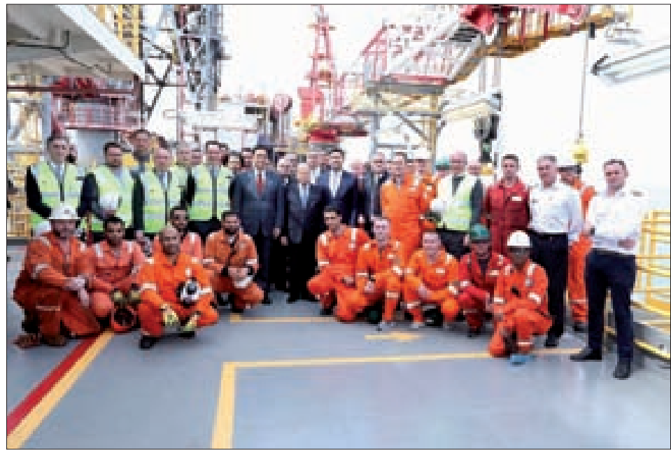
عون ودياب ونصر مع طاقم باخرة الحفر والتقيب عن النفط والغاز التي بدأت عملها في بحر لبنان أمس

اسم المعارضة السورية، وخلال هذه المواجهات التي حقق خلالها الهجوم بعض الاختراقات مستفيداً من قصف تركي مركز، ومن مواصلة الجيش السوري عملياته في ريف إدلب الجنوبي حاسماً سيطرته على عشرات البلدات والقرى، لكن الهجوم المعاكس للجيش السوري بدعم ناري روسي جوي نجح في صدّ الجيش التركي وجبهة النصرة والجماعات المشاركة معهما، وأصاب القصف السوري رتلا تركيا ومواقع تمركز فيها الجنود الأتراك، أعلن الجيش التركي بعدها مقتل تسعة من جنوده، بينما تحدثت مصادر مقربة من الجيش التركي في المعارضة السورية عن سقوط عشرات القتلى ومثلهم من الجرحى، ما استدعى عقد أردوغان لمجلس الأمن القومي وبدء إجراء اتصالات تركية بحلف الناتو طلباً للدعم، بينما عبرت روسيا بقوة عن موقفها الذي يحمل الرئيس التركي مسؤولية الإخلال بالالتزامات التي تعهد بها في مسار أستانة واتفاقية سوتشي، وتقديمه التغطية والدعم للجماعات الإرهابية، مقابل التزام موسكو بدعم جهود الجيش الروسي فوق أراضيها في مواجهة للجماعات الإرهابية، وكان لافتاً إعلان تركي للمرة الثانية عن قمة تجمع الرئيس أردوغان بالرئيس الروسي فلاديمير بوتين، أعقبها نفي روسي رسمي بصورة بدت رسالة قاسية لأردوغان ونوعاً من الإعلان الروسي عن نهاية زمن التعايش مع المرواغات التي يدير عبرها أردوغان عمله السياسي. وبقي السؤال حول ترجيح احتمال الانفراج أم الانفجار معلقاً بلا جواب ليلاً، (التمتعة ص8)