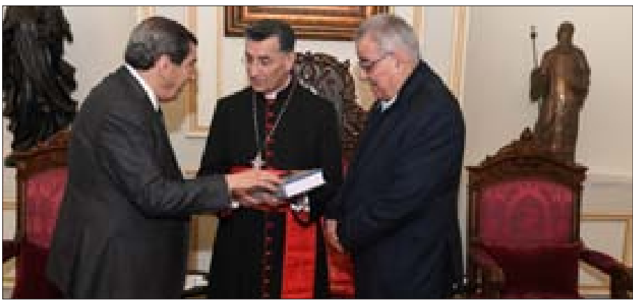
الراعي مع الفرزلي وأبو حبيب في بكركي أمس

في ما يتعلّق بالخروج من الأزمة الاقتصادية، وهذا ما طرحته أيضاً مع صاحب الغبطة. كما ناقشنا نشاط المجلس النيابي وموضوع استقلالية القضاء واستعادة الأموال المنهوبة، وكانت الزيارة مناسبة لنيل بركة غبطته على مذكرات أصدرتها تحمل عنوان «أجل التاريخ كان غداً». وشدّد على «أن مسألة النقّال هي مسألة تتعلق بالغد، وأنا أتفهم أنّ الناس التي تعاني لا يمكنها أن تشعر بالأمل، ولكن وضع الأمور على السكة الصحيحة سيوصلنا بالتأكيد إلى بر الأمان وإلى غد مشرق، ونحن نسعى جاهدين في إطار قانون الإثراء غير المشروع، والذي شكّلت لجنة فرعية له برئاسة الأستاذ إبراهيم كنعان، إلى تضمينها فقرة الاتصال بمن يشك في تورطهم في نهب أموال الدولة للبحث بسبل إعادة هذه الأموال».