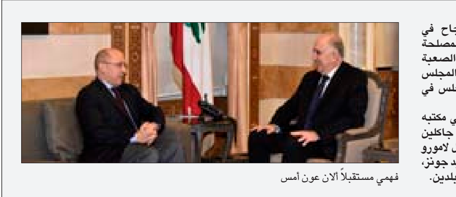
فهمي مستقبلاً الآن عون أمس