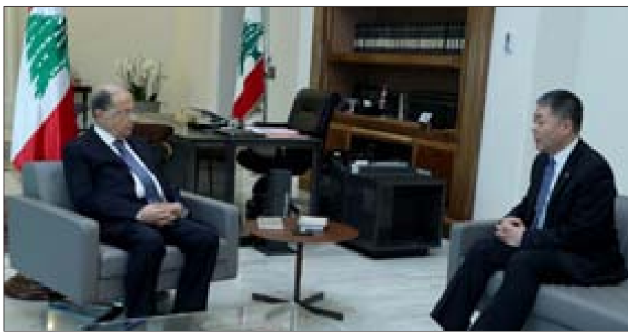
عون مستقبلاً سفير الصين في بغداد أمس (الداخلي ونهرا)