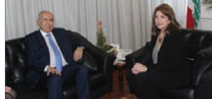
نجم ومخزومي خلال لقائهما أمس

بحثت زيرة العدل ماري كلود نجم في مكتبها بالوزارة، مع النائب فؤاد مخزومي ترافقه المستشارة السياسية الدكتورة كارول زوين، الأوضاع الراهنة. بعد اللقاء، قال مخزومي«أتيت اليوم لتَهنئة وزيرة العدل بموقعها الجديد، ولأقول لها لا تحسك على المهام الجسام الملقاة على عاتقك». وأضاف «مما لا شك فيه أننا نعاني في هذا البلد من عدم استقلالية القضاء، وما أكدته لنا الوزيرة اليوم، أنّ هذا الأمر هو من أولويات العمل الذي تقوم به كما تقوم به الحكومة، لأنه إذا أردنا مكافحة الفساد واستعادة الأموال المنهوبة التي هُرُبَت إلى الخارج ووقف عمليات النهب والسرقة، يجب أن يكون لدينا قضاء مستقل، كامل ومتخصص».