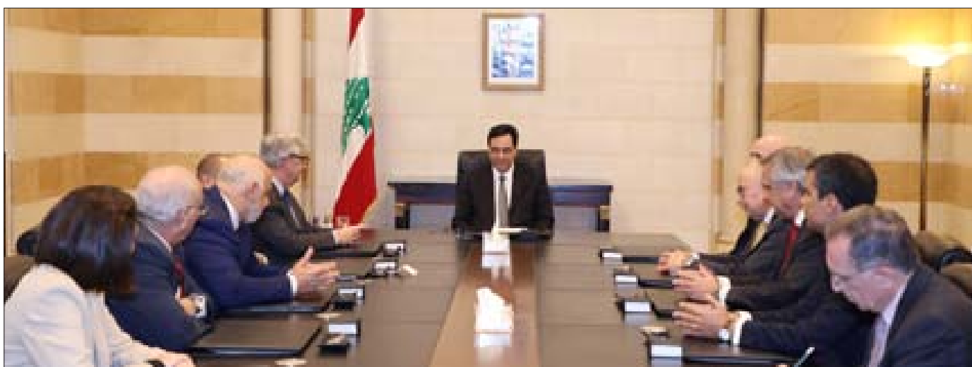
دياب مجتمعاً إلى سفراء دول أميركا اللاتينية

الجيروتي» برئاسة الدكتور محمد عيتاني، بحضور مستشار رئيس الحكومة خضر طالب. وسلم الوفد مذكرة طالبت به الإسراع في خطوات الإصلاح ومحاسبة من كان السبب والمسبب بالكارثة الاقتصادية والانحياز والإفلاس». وقال «حكومة الرئيس دياب هي حكومة كل لبنان، وهي حكومة أصحاب اختصاص، وإذا فشلت يكون لبنان ذاهباً إلى الانهيار النهائي».