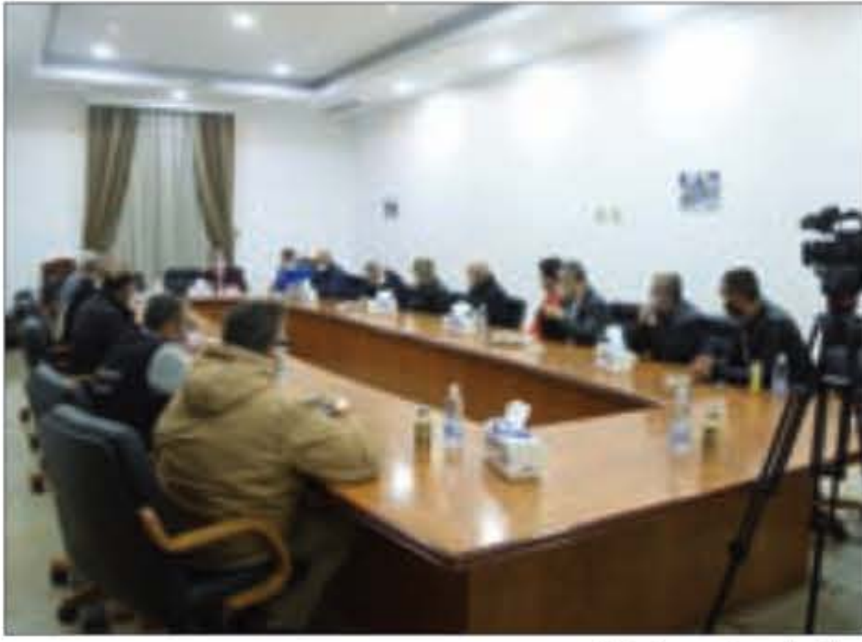
خلال الاجتماع في بلدية الغبيري