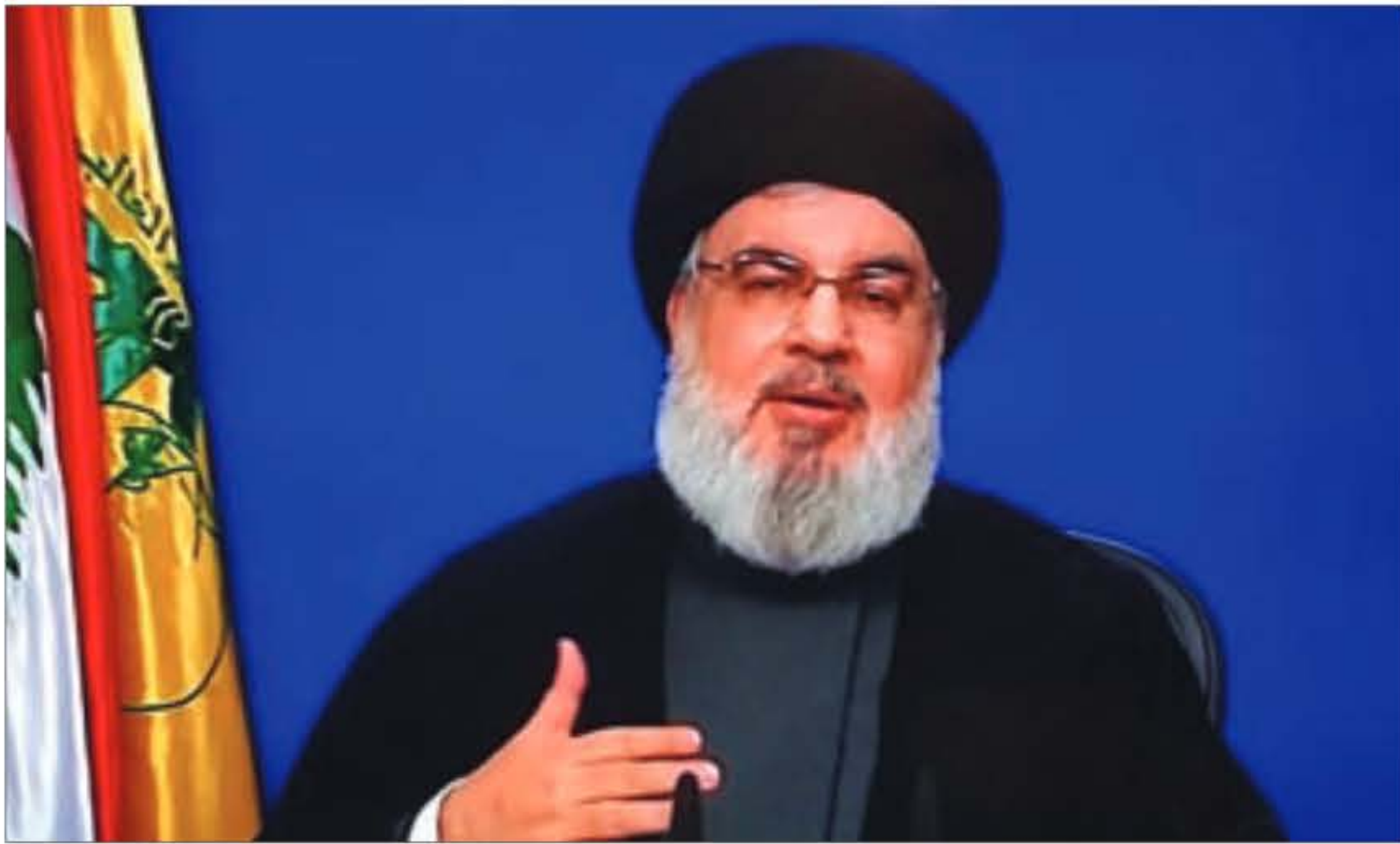
السيد نصرالله يلقي كلمته عبر الشاشة مساء أمس

وتعليقاً على مطالبة الحزب من قبل البعض بالقيام بـ 7 أيار لاستعادة الفاخوري من السفارة الأميركية، أكد السيد نصرالله أن «7 أيار حدث لأن الحكومة أخذت قراراً بزع سلاح الإشارة وطلب من الجيش تنفيذ ذلك بالقوة ما يؤدي إلى صدام بين المقاومة والجيش وهذا الأمر كان لمصلحة العدو الإسرائيلي». وسال «هل كان المطلوب من حزب الله أن يقوم بفعل كمين للجيش اللبناني والقوى المولوجة حماية الفاخوري؟ وهل كان يجب على حزب