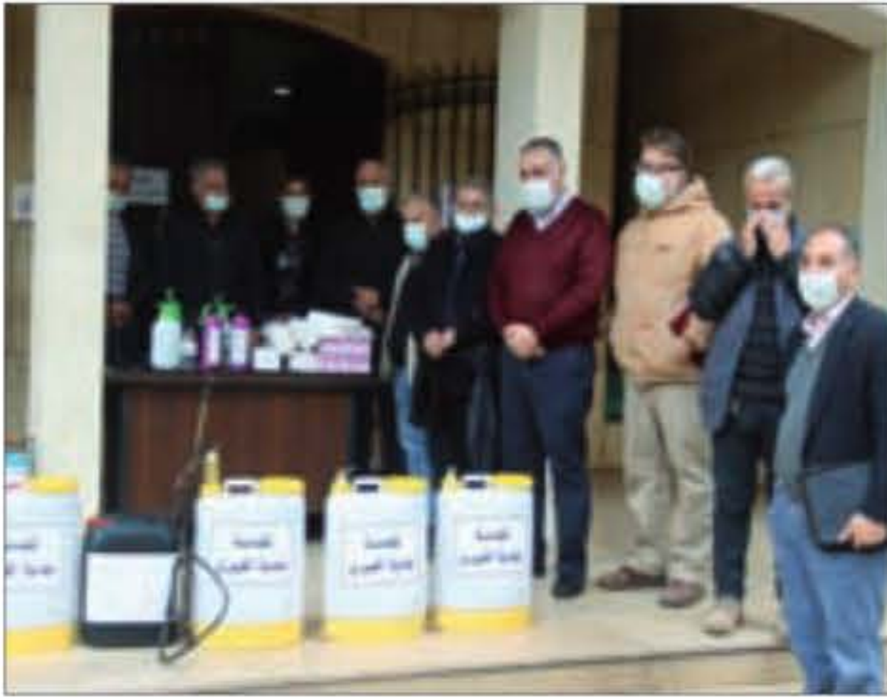
الخليل يسلم الوفد بعض المساعدات تقدمه بلدية الغبيري