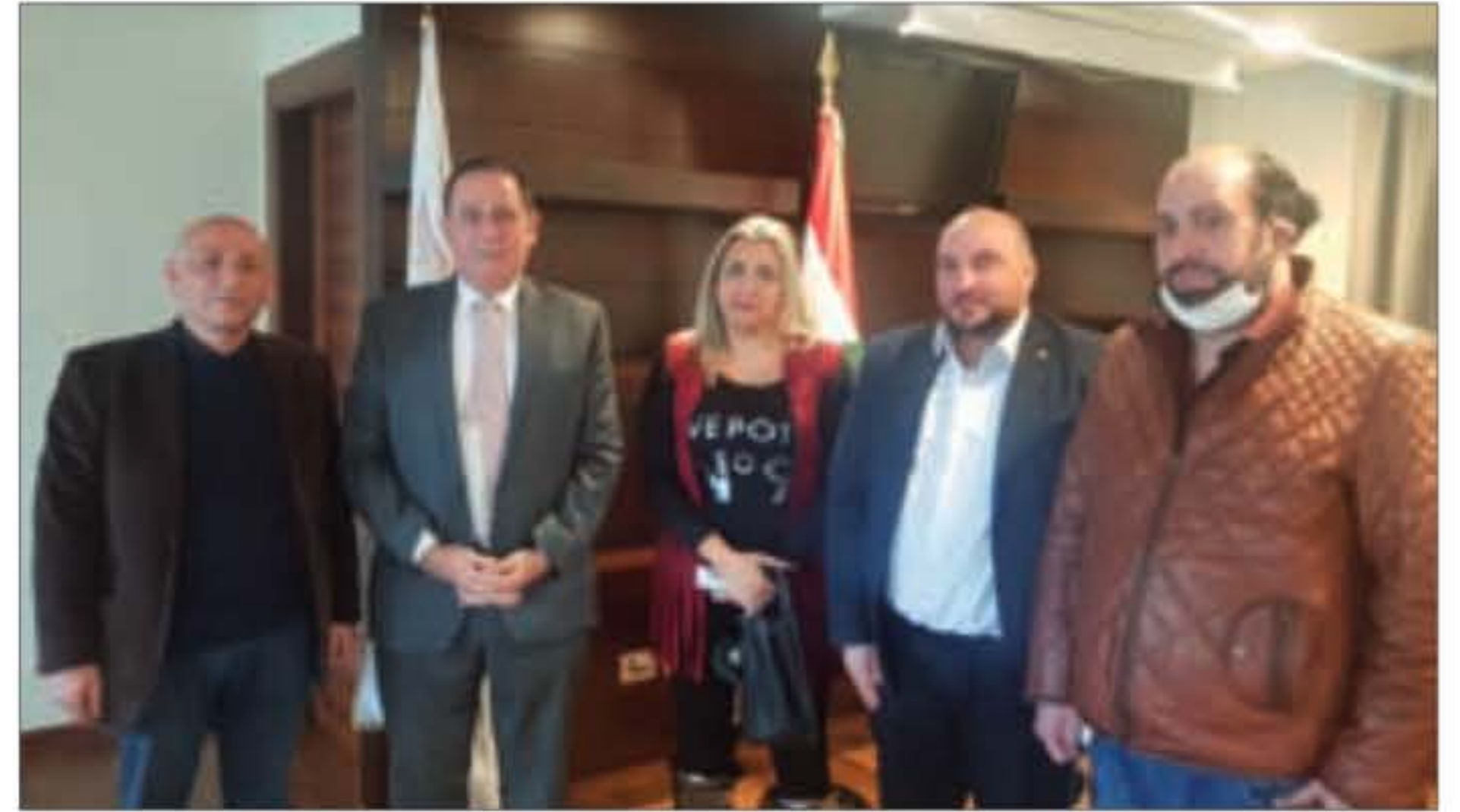
حُب الله مع وفد الحملة الوطنية للتكافل الاجتماعي

زار وفد من الحملة الوطنية للتكافل الاجتماعي «إيدي بايدك» وزير الصناعة عماد حب الله للتحاكي في كيفية مواجهة الأزمات الاجتماعية إثر تفشي فيروس كورونا وحالة الإقفال والنشل التي تعم لبنان بعد إعلان التعبئة العامة. وقدم الوفد رؤية موقفة تمثل خارطة طريق ملاقة الناس التي خسرت أعمالها وتوقفت أشغالها نتيجة الأزمة. وشدّد المتعمون على ضرورة تكاتف الجهود وإبقاء الاجتماعات مفتوحة لإطلاق حملة تبرّع وطنية شاملة تسعى فيها وزارة الصناعة لتقديم الدعم عبر حث المصانع الوطنية والوزارات المعنية لتكون