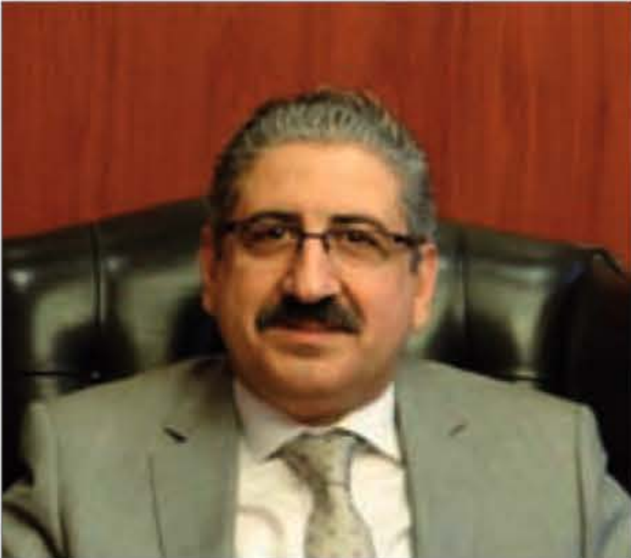
البرفسور فؤاد أيوب

تسلّم البروفسور فؤاد أيوب رئاسة الجامعة اللبنانية في العام 2016، بعد أن تمّ اختياره عن طريق الانتخاب في مجلس الجامعة من بين مجموعة من المرشحين ومن ثم تثبيت هذا الاختيار من قبل وزير التربية والتعليم العالي وصور مرسوم التعيين في مجلس الوزراء. ومنذ تلك اللحظة، بدأت جهات معروفة حملة مبرمجة ومتشقة في وسائل الإعلام لتشويه صورة رئيس الجامعة الجديد والاعتراض على تعيينه. ورغم قسوة هذه «الحملة» الحاقدة، فقد تحمّل رئيس الجامعة الافتراءات والاذعاءات الكاذبة بصمت كبير وتعال عن الآتي لعامين متواصلين حرصا منه على عدم جزّ الجامعة إلى سجلات تضرّ لها وبصداقيتها. لكن، وبعد أن تبيّن للبروفسور أيوب أنّ أصحاب «الحملة» بدأ بمبعذات خاصة لضرب الجامعة وتفتت مؤسساتها وتشويه سمعتها، قام بتكليف الوكيل القانوني للجامعة ومحام من خارج الجامعة لتقديم الدعاوى المناسبة أمام القضاء اللبناني إحقاقاً للحق وصونا لصورة الجامعة. وفي هذه الأثناء، لم يتزك رئيس الجامعة لهذا الحملات ومثيلاتها أن تؤثّر على قيامه بمسؤولياته بهمة عالية، وتفرّغ بشكل كلي لمتابعة إدارة وتسيير شؤون الجامعة وفق الأصول والأنظمة والقوانين المرعية الإجراء، مسترشداً ببراى اللجنة القانونية التي تضمّ أساتذة وموظفين من الجامعة وبراي الهيئة الاستشارية القانونية المولفة بموجب قانون الجامعة من ثلاثة قضاة من مجلس شورى الدولة وديوان المحاسبة مشهود لهم علما وفقها واجتهادا وعرفه وخبرة، وفي المناقصات في الجامعة، التزم الرئيس أيوب بما تقرره لجنة المناقصات المولفة من 12 عضواً من أساتذة الجامعة المعروف عنهم التجزّء والنزاهة والشفافية، حيث إذا وافقت اللجنة يوافق، وإذا لم توافق لا يوافق.