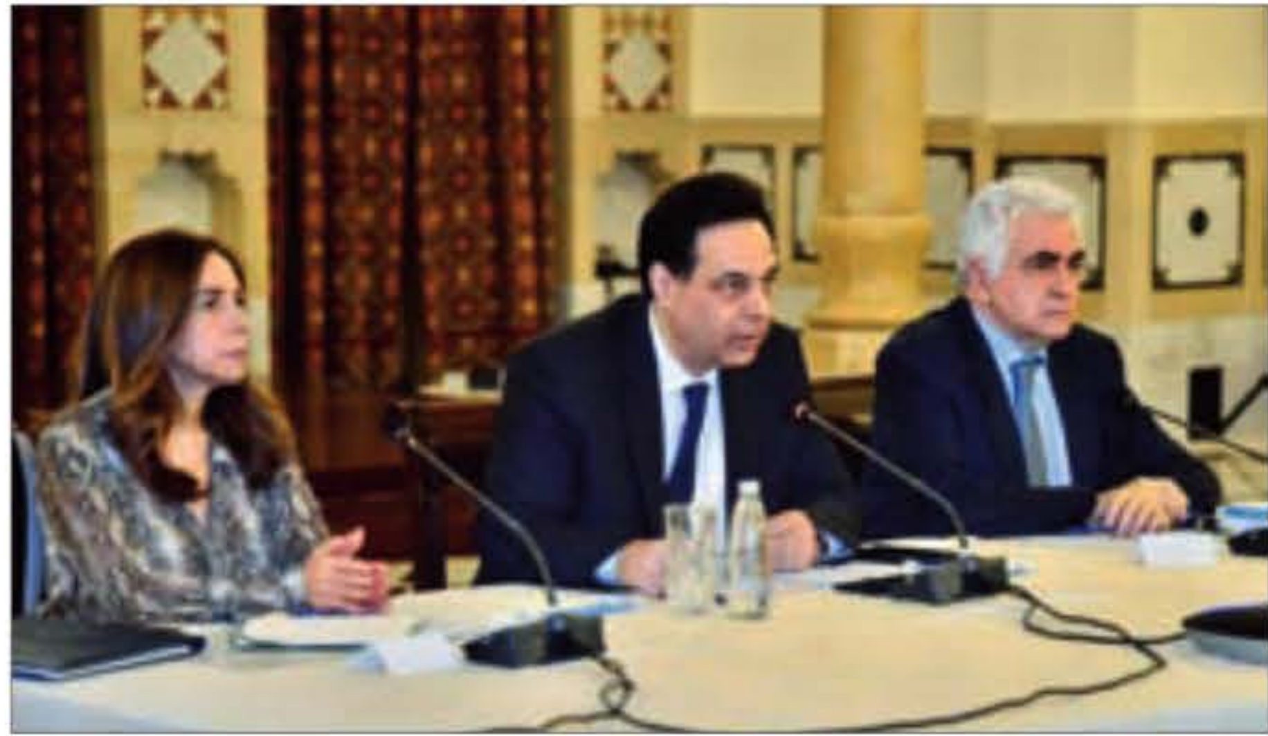
جانب من الاجتماع المخصص لكورونا في السراي

لشراء 120 جهاز تنفس متخصصاً لمعالجة المصابين بفيروس «كورونا»، وسيتمّ تقديمها لعدد من المستشفيات الحكومية في مختلف المحافظات اللبنانية، كما تمّ الاتفاق