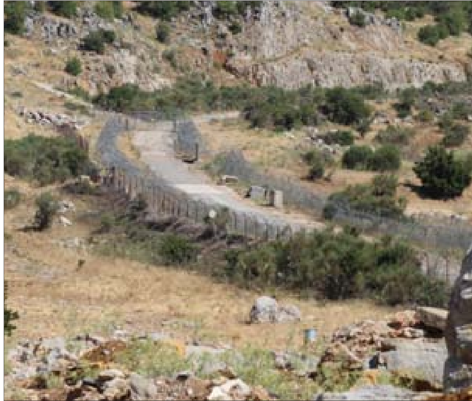
الصورة للشريط الشائك الفاصل مزارع شعبنا المحتلة عن الوطن