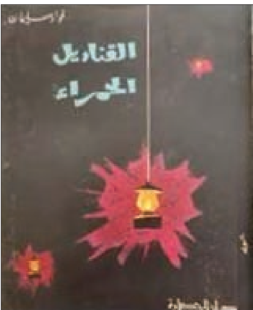
غلاف كتاب «النقائيل الحمراء» الصادر عن «دار الحضارة»