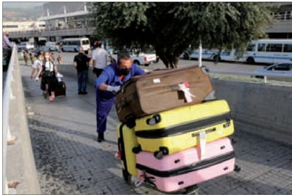
ركاب الطائرة لآتية من فرانكفورت لدى خروجهم من المطار أمس (عباس سلمان)

الفاتورة النفطية التي لا حل لها إلا بتفاهم لبناني عراقي سوري يعيد تشغيل أنبوب نفط كركوك طرابلس، بالإضافة إلى فواتير موازية في الاستهلاك بعضها تكفل ارتفاع سعر الدولار بتخفيضها، وبعضها يستدعي إعادة نظر في نمط الحياة التي يعيشها اللبنانيون، بالاعتماد على العملة الأجنبية في قطاعات حيوية، ويشككون بالمقابل من البطالة، وهو ما تحدثت عنه عقيلة رئيس الحكومة أول أمس وجاءها الجواب بحملة إساعات، نظمها مجموعات عاملة على وسائل التواصل الاجتماعي، تحت عناوين الثورة والتغيير. العلاقات الاقتصادية اللبنانية السورية العراقية، لا تزال من المحرمات على الخطاب الحكومي، حتى أنها تغيب كلياً عن خطة التفاوض مع صندوق النقد الدولي، الذي يجب على لبنان مطالبته بتمويل مشاريع ذات جدوى، أهمها يفترض أنه تخفيض الفاتورة النفطية عبر تشغيل أنبوب كركوك طرابلس، بينما كان لافتاً ما نقلته مصادر عراقية عن رئيس الحكومة مصطفى الكاظمي، أنه يولي أهمية كبرى للعلاقات الاقتصادية مع لبنان وسورية، وقد أعد لها ملفات في قطاعات متعددة. وقالت المصادر إنه يمكن للكاظمي الذي تربطه علاقات جيدة بالأميركيين أن يتولى تسويق مشروع الأنبوب النفطي العراقي السوري اللبناني، والحصول على استثناء من العقوبات الأميركية على سورية للسير به، كما قالت المصادر إن تسهيل تجارة الترانزيت عبر لبنان إلى العراق، عبر سورية، حاضر على طاولة رئيس الحكومة العراقية، وقالت (التتمة ص8)