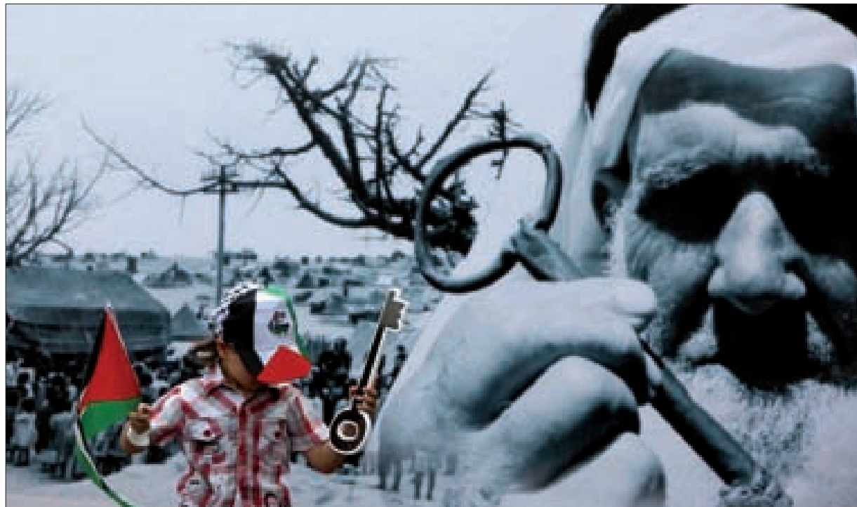
الفضائل دعت في ختام بيانها، الأمانة في هذه اللحظة التاريخية للحد من المخاطر التي تستهدفها في هذه المرحلة، فجماعة صفقة القرن ليست خطراً على الشعب الفلسطيني فحسب، وإنما على الأمة جمعاء، لكونها العنوان الجديد للمشروع الصهيوني - أميركي بالمنطقة..

أكدت فصائل المقاومة الفلسطينية أمس، أنّ حق العودة «حق ثابت ومقدس فردي وجماعي ولا يسقط بالتقادم ولا بالإجراءات الاحتلالية». فصائل المقاومة جددت في بيان لها بمناسبة الذكرى الـ 72 للنكبة، على رفض التوطين والوطن البديل، مشددة على أنه «لا نقبل بديلاً عن فلسطين إلا فلسطين»، ومطالباً بريطانيا بـ«تحمل مسؤولياتها عن هذه الجريمة بعودة شعبنا وتعويضه عن الضرر الذي وقع عليه طيلة الـ 72 عاماً الماضية». وطالبت فصائل المقاومة المجتمع الدولي بـ«محاسبة قادة الاحتلال لإرتكابهم جرائم ضد الإنسانية، والعمل على زوال الاحتلال وتحقيق العود». البيان جدد أيضاً رفض الفصائل القاطع «لكل المشاريع الرامية لتصفية القضية الفلسطينية، أو الانتقاص من حقوق شعبنا الفلسطيني، وفي مقدمتها صفقة القرن»، داعية إلى «التوحد خلف خيار الجهاد والمقاومة، للتصدي للمشاريع التي تستهدف وجودنا وهوية عالمنا العربي والإسلامي». كما أكدت الفصائل على حق الشعب الفلسطيني في «مقاومة الاحتلال بكل الوسائل، وفي مقدمتها المقاومة المسلحة التي تعد خياراً استراتيجياً لحماية شعبنا واسترداد حقوقه»، مضيفة: «سنبقى أيدناً على الزناد لحماية مصالح شعبنا والدفاع عنه واسترداد حقوقه السلوية». ودعت الفصائل الفلسطينية في هذا السياق، إلى «العمل الجاد والتحقيقي لتحقيق الوحدة الوطنية الحقيقية المبنية على استراتيجيات شاملة تحفظ حقوق واهداف ومقررات الشعب الثابتة والتاريخية، وتضمن التحلل من قيود الاتفاقيات المشؤومة والغاء التنسيق الأمني». كما شددت، على الرفض التام «لكل أشكال التطبيع السيسادي والنفثافي والرياضي والتجاري مع الاحتلال»، واصفة إياه بـ«الطعنة في ظهر الشعب الفلسطيني، وانتهاك لحقوقه وتشجيع للعدو لارتكاب مزيد من الجرائم والانتهاكات بحق شعبنا ومقدساته..»