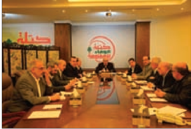
كتلة الوفاء للمقاومة مجتمعاً برئاسة رعد

أعلنت كتلة «الوفاء للمقاومة» أنه «إنطلاقاً من موقع تصديها وإسهامها في إيجاد المشاريع والحلول للأزمة الشاغطة على اللبنانيين، يهيمها التأكيد أن ما يعنىها هو ضمان حصول المودعين على ودائعهم المصرفية، ووضع حد للتنازل على المال العام.»