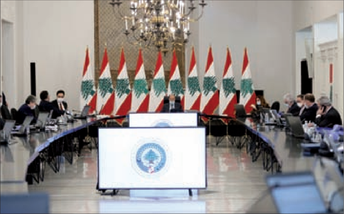
جانب من جلسة مجلس الوزراء في بعيدا أمس

أنهى مجلس الوزراء درس الخطة الاقتصادية – المالية وتم اقرارها بالاجماع، خلال جلسته التي عقدها أمس في قصر بعيدا برئاسة رئيس الجمهورية العماد ميشال عون وحضور رئيس الحكومة الدكتور حسان دياب والوزراء.