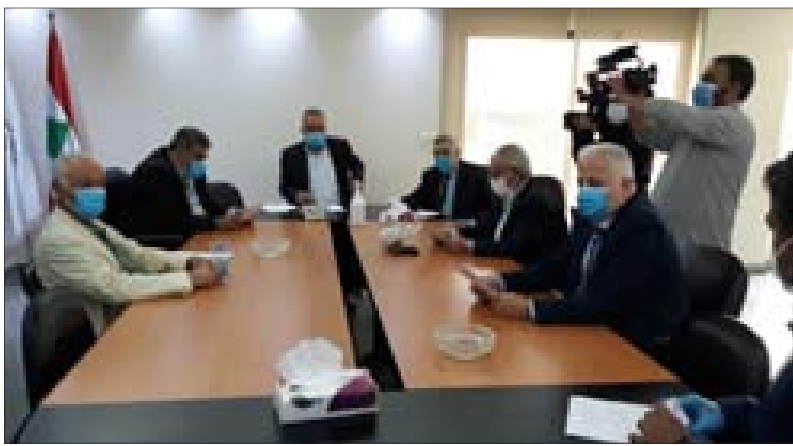
من المؤتمر الصحافي

وقال إن الصندوق الوطني للضمان الاجتماعي يؤمن منذ أكثر من خمس وخمسين عاماً الحماية الاجتماعية للعمال في لبنان. وما المؤسف أن نسمع عن مشاريع تهدف إلى تعطيل عمل هذه المؤسسة العريقة أو النيل منها، خصوصاً في ظل الأوضاع