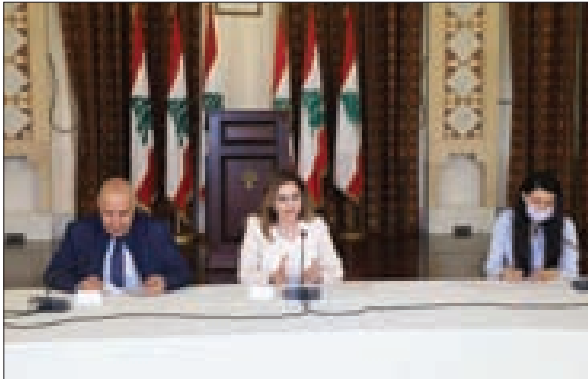
عبد الصمد وفلحة خلال الحلقة التشاورية مع الإعلام الإلكتروني

ولا يجب ان تقيد حريته في لبنان الذي يتميز بالحرية..