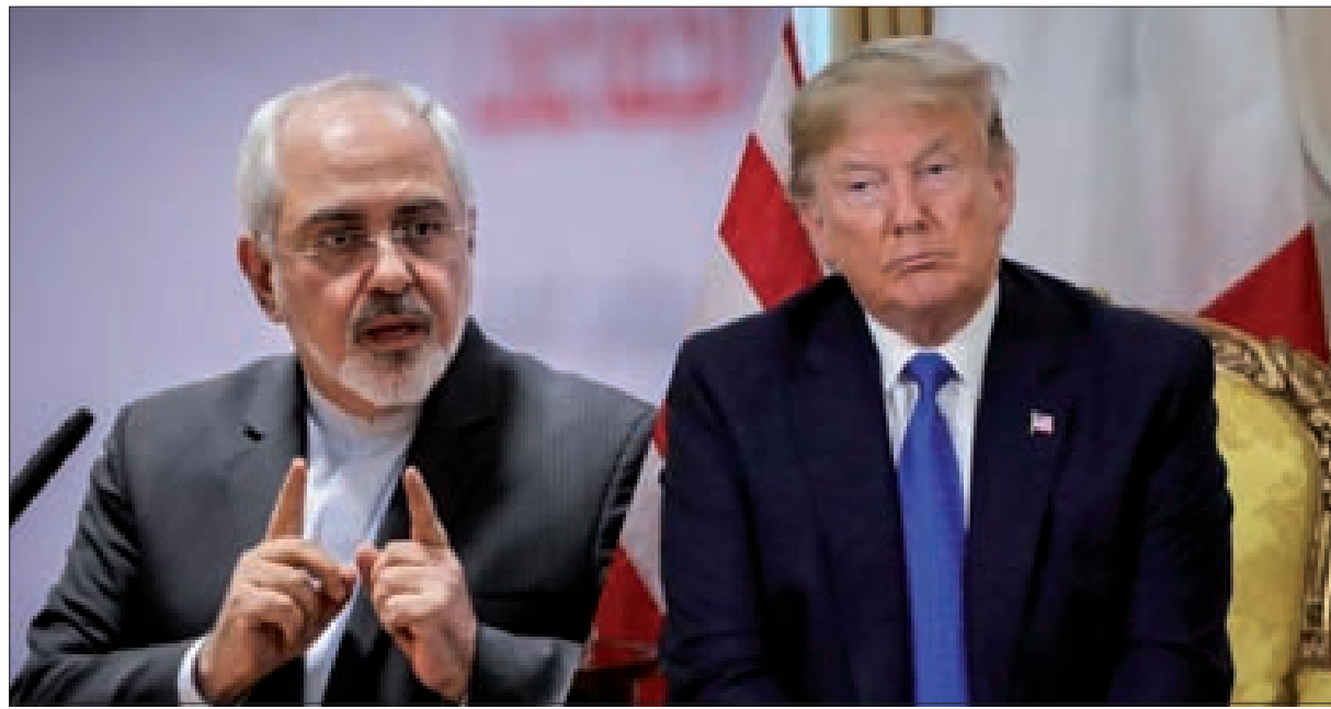
ظريف لترامب... القرار لك في ما يجب إصلاحه!

شرق سورية لعمليات مقاومة رداً على دخول قانون قيصر للعقوبات على سورية موضع التنفيذ. وقالت المصادر إن جبل الإنهيارات يتراكم مع اقتراب موعد الاستحقاق الرئاسي، في ظل أسوأ ما يمكن أن يواجهه مرشح رئاسي أو رئيس ساع لتجديد ولايته، داخليا وخارجيا، سياسيا واقتصاديا، ما يجعل الحديث عن المعلومات حول سعي أميركي لوساطة روسية تعرض تجميد أي خطوات تصعيدية بوجه سورية، متزامنا مع الإشارات لفرضية فتح ملف التفاوض عبر طرف ثالث مع إيران، تعبيرا عن الاعتراف بالمأزق حيث صار الإنجاز السياسي وصفة أحادية لعودة ترامب إلى البيت الأبيض.