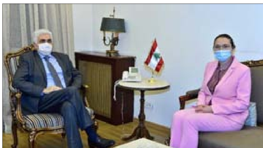
حتى مستقبلا سفيرة الدنمارك

ساميون كوفيني، نقلها إليه قنصل إيرلندا السفير جورج سيام، وبحث مع سفيرة الدنمارك ميريت بوهي في العلاقات الثنائية ومسألة «اليونيفل» وبرنامج المساعدات المقدمة من الدنمارك إلى لبنان. وعرض حتى مع كل من سفيري أوكرانيا إيهور اوستاش وبلغاريا بويان بيليف، العلاقات الثنائية بين لبنان وبلديهما.