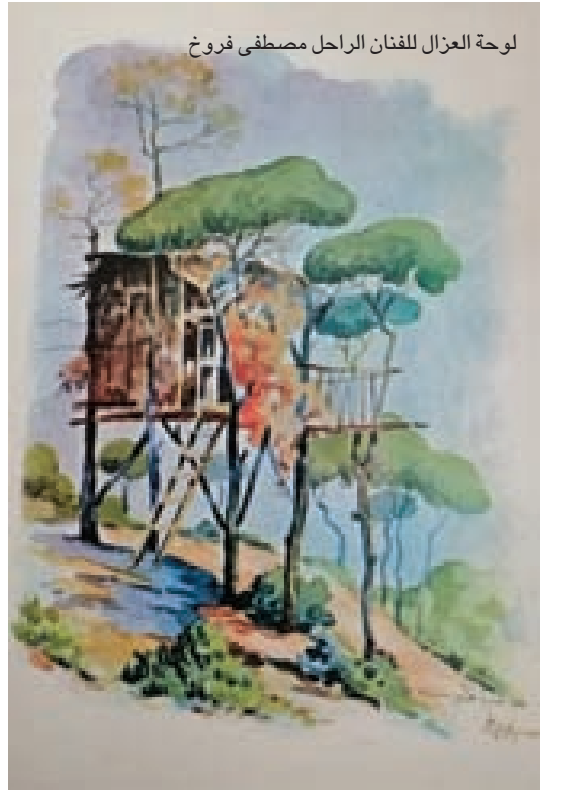
لوحة العزال للفنان الراحل مصطفى فروخ