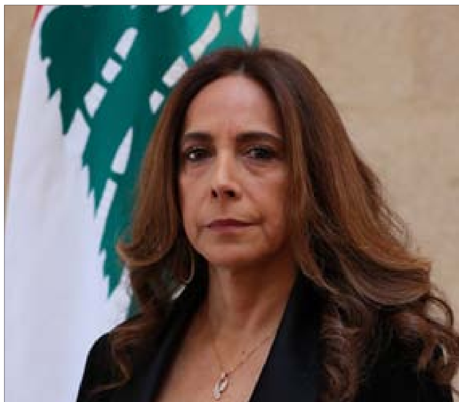
نائبة رئيس الحكومة ووزيرة الدفاع زينة عكر

لمجلس النواب، فللحكومة أن تجيب على السؤال خطأ في مهلة 15 يوماً على الأكثر من تاريخ تسلمها السؤال. كما أجازت الحكومة أن 125 للحكومة أن تطلب تمديد المهلة.»