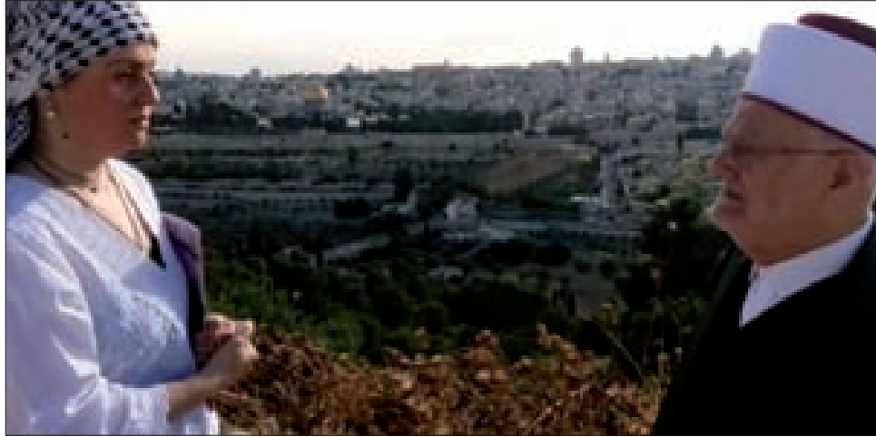
الشيخ عكرمة صبري مع صابرين دياب

الأقصى وأنا أخطب في الأقصى منذ عام 1973 أي منذ 47 سنة وأنا أخطب في هذا المسجد، ولكن الاحتلال لم يراع في هذه الحالة لم يحترم أي شعور وإنما يريد البش والإبعاد.