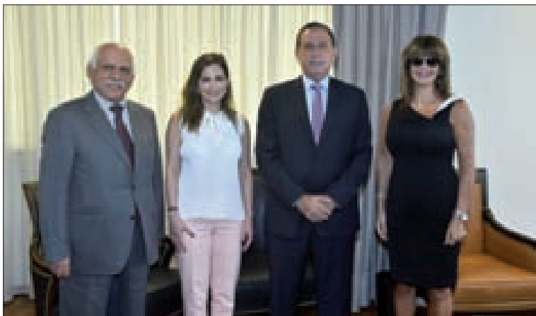
حب الله وعبد الصمد مع إدارة شركة أروان لصناعة الأدوية

زارت وزيرة الإعلام الدكتورة منال عبد الصمد نحد أمس، وزير الصناعة الدكتور عماد حب الله في مكتبه في الوزارة. واطر اللقاء قالت عبد الصمد: «نحن في ضيافة وزارة الصناعة لنشكر وزير الصناعة الذي يصدر دائما قرارات جيدة. وفي إطار التعاون نعمل على تشكيل فريق عمل للإنتاج الإعلامي، ليكون لبنان مركزا للصناعة الإعلامية، وذلك من خلال اتفاقيات وبمشاركة القطاع الخاص». أضافت: «سنستطيع أيضا أن نجتمع الأفكار من أصحاب التخصصات في القطاع الخاص، للتركيز على الإعلام الصناعي. علينا الإضاءة على الصناعات الموجودة في لبنان حتى نجتمع المستثمر مع الصناعي والمنتج». وتابعت: «كان لنا لقاء مع شركة «أروان» لصناعة الأدوية التي حازت ترخيصا من منظمة الصحة العالمية who، لتكون هي المركز الفريد في المنطقة، ويكون باستطاعتها إجراء التحاليل المخبرية للأدوية وتشجع هذه الصناعة، ونعتبر ذلك انتصارا للصناعة اللبنانية». بدوره، قال وزير الصناعة: «كانت مناسبة ممتازة للتبادل الأفكار بالنسبة إلى تشجيع الصناعة والإعلام، وخصوصا الإنتاج الإعلامي وتطبيق الاتفاقية التي وقعناها منذ حوالي ثلاثة أسابيع. وكان الاجتماع مناسبة لتجديد التوافق على الخطوات التي تتخذها الحكومة وخصوصا وزارتي الإعلام والصناعة، لتشجيع التعاون بين الوزارات ولدعم الصناعة عبر الإعلام الصناعي أو الصناعة الإعلامية، وتشجيع صناعة الإعلام الإبداعي أو المحتوى الإبداعي». أضاف: «اتفقنا على تشكيل فريق عمل بين وزارتي الإعلام