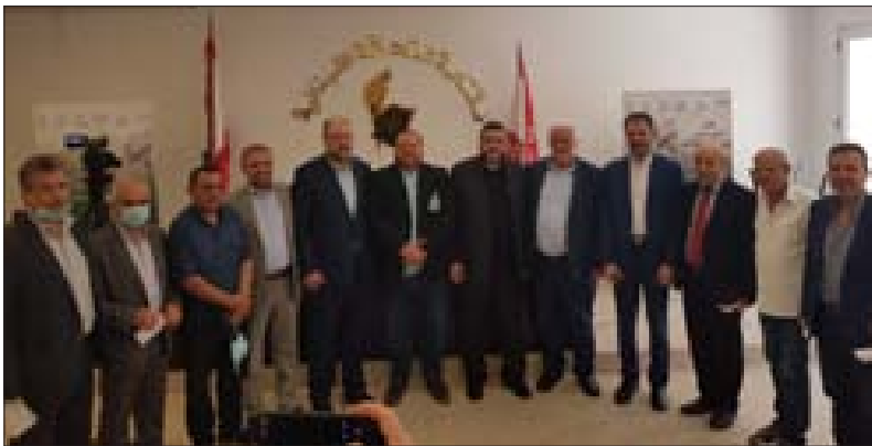
عدد من المشاركين في المؤتمر في نقابة الصحافة أمس