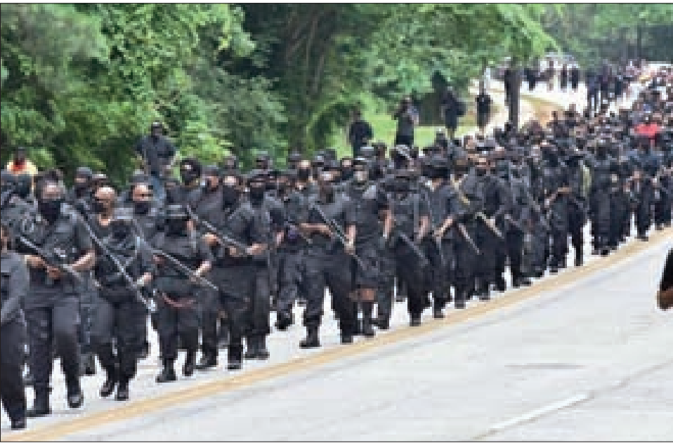
استعراض مسلح لمجموعة من الأميركيين امن أصحاب البشرة السمراء

والعنصرية، بل تحرّص على تمييز نفسها عن منظمة «القهود السود» التي شهدت أوج نضالاتها المسلحة ضدّ العنصرية وتجلياتها في المؤسسة الرسمية خلال عقدي الستينيات والسبعينات من القرن الماضي.