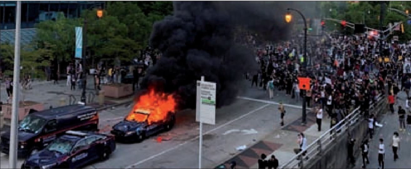
هل يشتعل الشارع الأميركي مجدداً؟