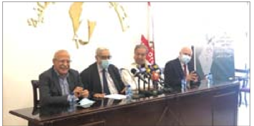
المتحدون في المؤتمر الصحافي أمس