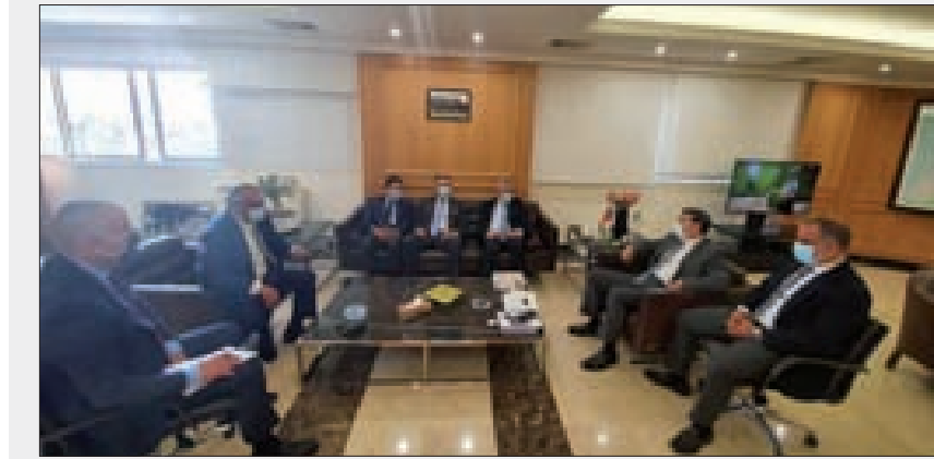
نجار خلال استقباله وفدا استثماريا دوليا

أولوية قصوى لديها، يؤسّس أي تعرّض قد ينال من الأمن الغذائي ويسيء إلى الأمان الاجتماعي لأهلنا ومواطنينا، كما تطلب توشي أقصى درجات الموضوعية في تناول الصناعيين والصناعة الوطنية بعيداً عن أي تشهير، مع الإشارة إلى أن جمعية الصناعيين لم ولن تقبل بتغطية أي مركب قد الحق ويلحق الضرر بالمستهلك في صحته وسلامته، تاركين للسلطات المختصة من قضائية وإدارية اتخاذ ما يرونه مناسباً».