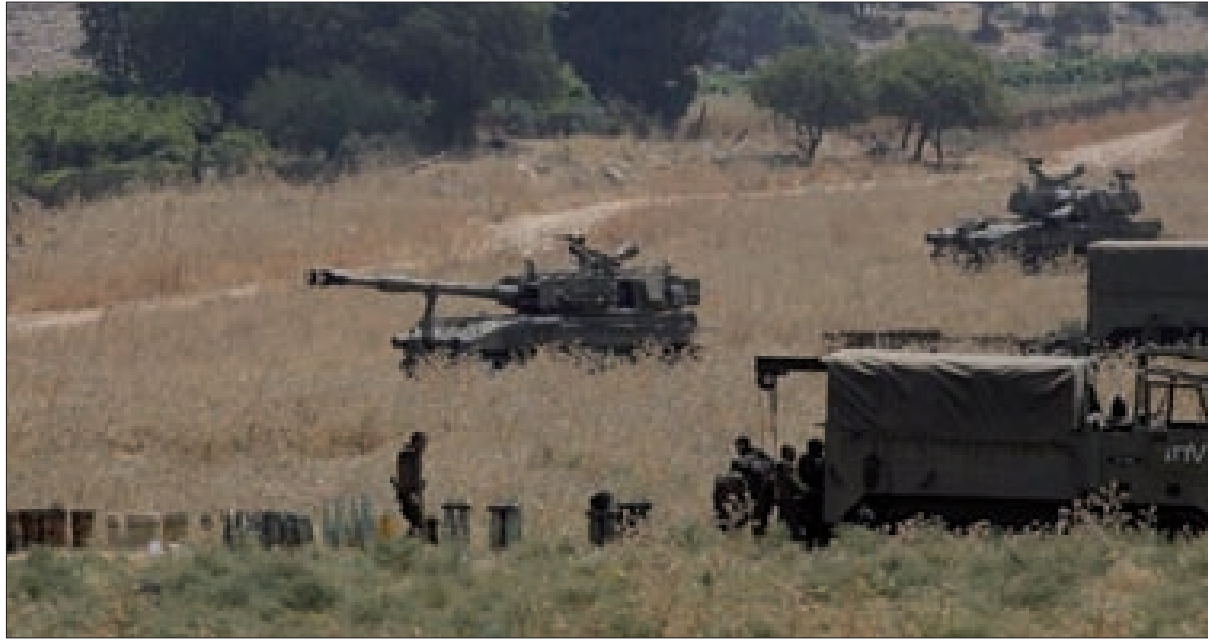
لبنان يهزم جيش الاحتلال مجدداً... بلا حرب