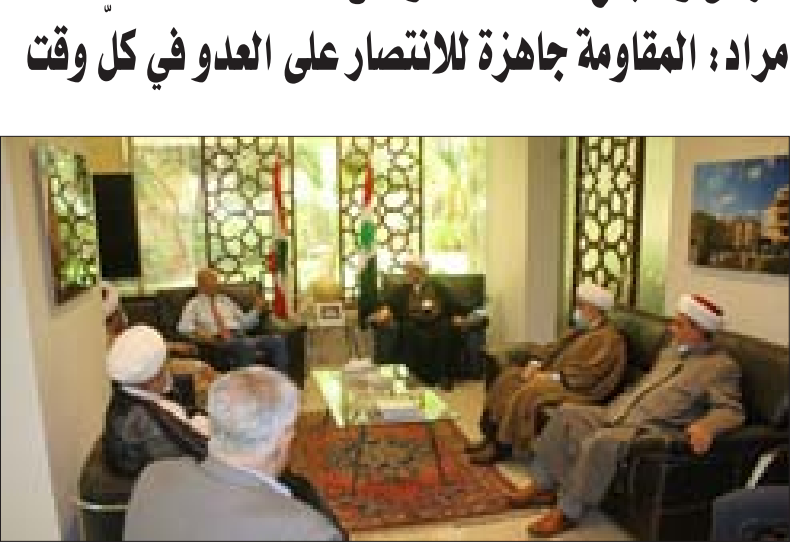
مراد مجتمعاً إلى تجمع العلماء المسلمين أمس

سوى أعداء لبنان، وعلى رأسهم العدو الصهيوني».