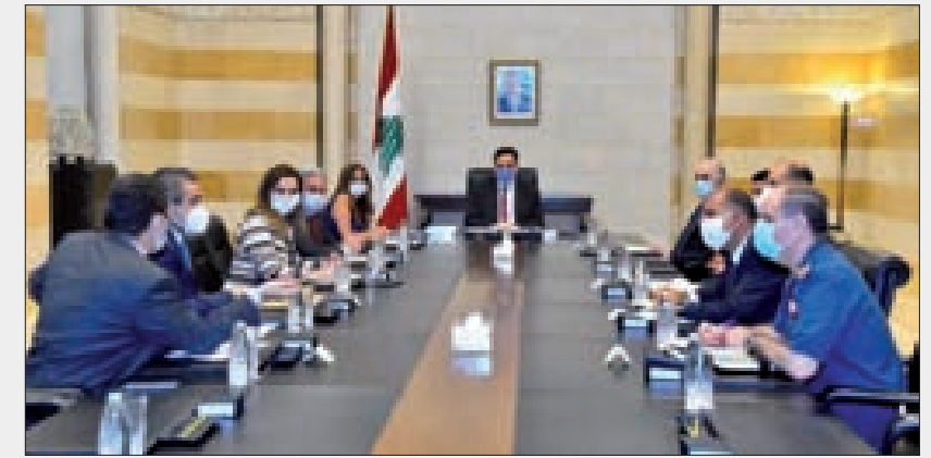
دياب مترشسا اجتماعا للجنة الوزارية لمتابعة فيروس كورونا

أعلنت وزارة الاقتصاد والتجارة في بيان، أنه ب «توجيه من وزير الاقتصاد والتجارة راوول نعمه، وفي إطار سلسلة ضبط مستودعات الأغذية الفاسدة، دهمت الوزارة مستودعا جديدا في منطقة جزين بموازرة قوى أمن الدولة، حيث عثر بداخله على حوالي 40 كلغ من لحم الخنزير المقطع والموضب باكياس بطريقة غير مطابقة لشروط التخزين، وقد تم حجز البضائع وتشميع البراد بالشمع الأحمر وأخذ عينات وفحصها».