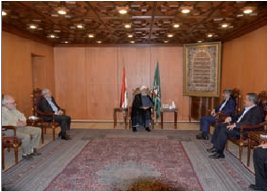
الخطيب خلال لقاءه سفير إيران في المجلس الإسلامي الشيعي الأعلى

- طلب وزارة المال الموافقة على نقل اعتماد بقيمة 38.260.000 ليرة لبنانية من احتياطي موازنة المديرية العامة للحبوب والشمندر السكري لعام 2020 (رواتب الموظفين الدائمين وتعويضات عائلية).