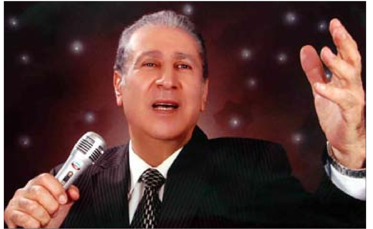
النجم الراحل مروان محفوظ خلال حفلة تكريمه في دار الأوبرا