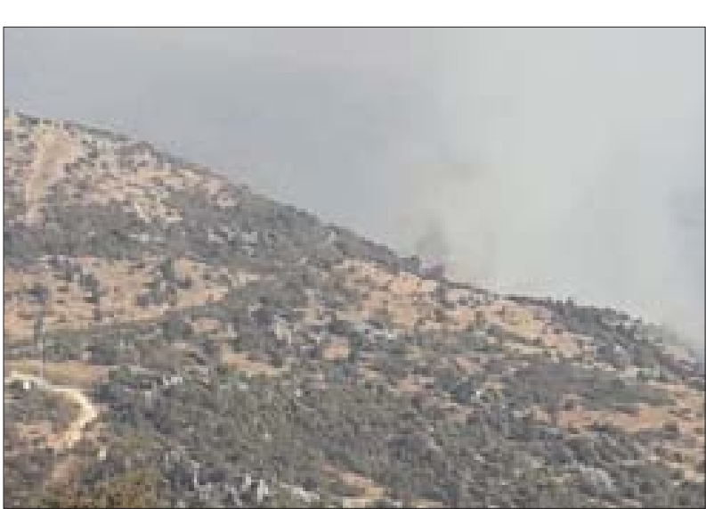
لا عملية للمقاومة... والعدو لديه داغ للهلل...

منزل أحد المدنيين لن يتمّ السقوط عنه على الإطلاق. وإن غدا لناظره قريب».