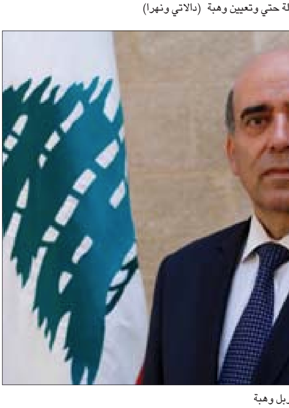
وزير الخارجية الجديد شربل وهبة

عام لبنان في مونتريال – كندا بين عامي 1995 و2000، وتنقل قبل ذلك في مناصب دبلوماسية عدة في سفارات لبنان في كل من القاهرة – مصر، لاهاي، هولندا، برلين، ألمانيا وفي قنصلية لبنان العامة في تورونتو – كندا.