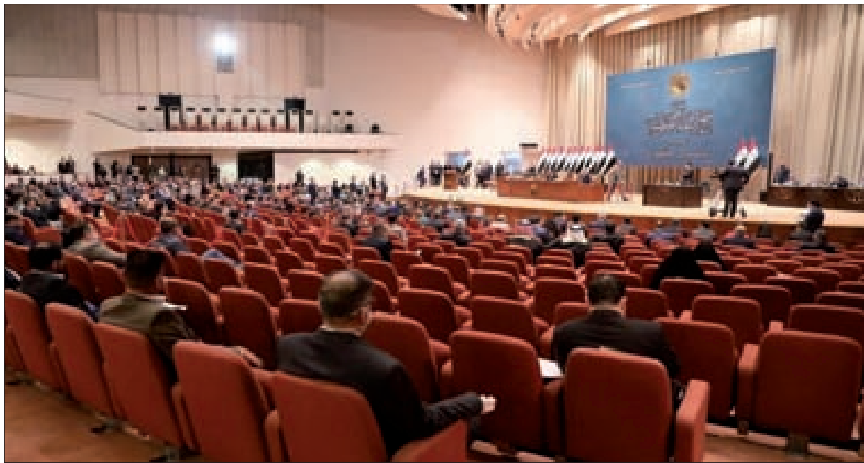
موعداً جديداً لإجراء الانتخابات التشريعية المبكرة في البلاد. وقال في بيان صحافي: «نرحب بإجراء الانتخابات المبكرة، ونعتقد أنّ الوقت الأفضل لها هو بداية شهر أبريل المقبل من العام 2021».

موقفاً نشطاً مواقع التواصل الاجتماعي مع إعلان الكاظمي موعداً لإجراء الانتخابات المبكرة ودعوات حل البرلمان، وقال «Moh22amad» في تغريدة له لسنا ضد حل البرلمان والانتخابات المبكرة ولكن حل البرلمان مع عدم ضمان إجراء