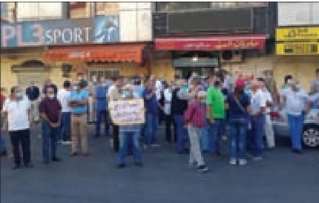
خلال المسيرة في النبطية

نظّم بعض أهالي مدينة النبطية أمس، مسيرة إحتجاجية تنديداً ب«مافيا المحروقات والكهرباء الذين يساهمون في تاجيح الحصار العدواني وتدعيه». ورفع المحتجون لافتات كتب على بعضها «النبطية لا تقبل الذل، النبطية أنقى من هيمنتكم وأقوى من فسادكم.