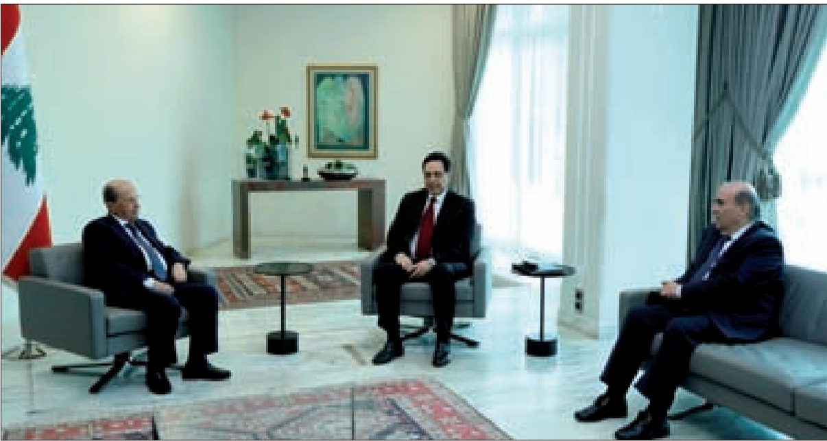
الرئيسان عون ودياب خلال اللقاء مع وزير الخارجية الجديد شربل وهبة في بعبدأمس