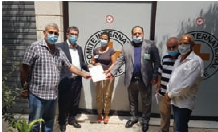
تسليم مذكرة اللجنة الوطنية للصليب الأحمر في بيروت