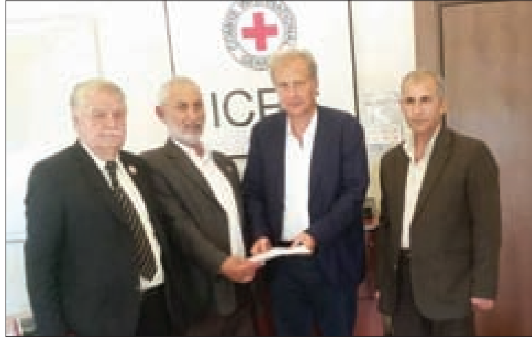
تسليم المذكرة في دمشق