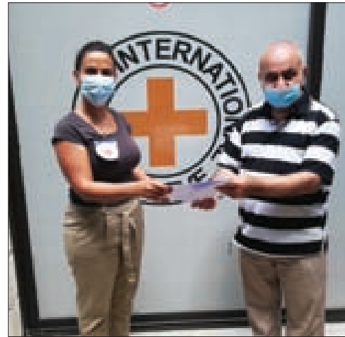
تسليم مذكرة اللجنة الوطنية للصليب الأحمر في بيروت

كل الأرقام القياسية بالتوحش مستفيداً من التواطؤ العربي والدولي الذي، بدوره، ضرب رقماً قياسياً في التخالف وقلّة الضمير من خلال تجنب اتخاذ أي إجراء عقابي جدي لردع الاحتلال عن الاستمرار في الفتك بحق المدنيين الفلسطينيين والسوريين الراحين تحت الاحتلال.