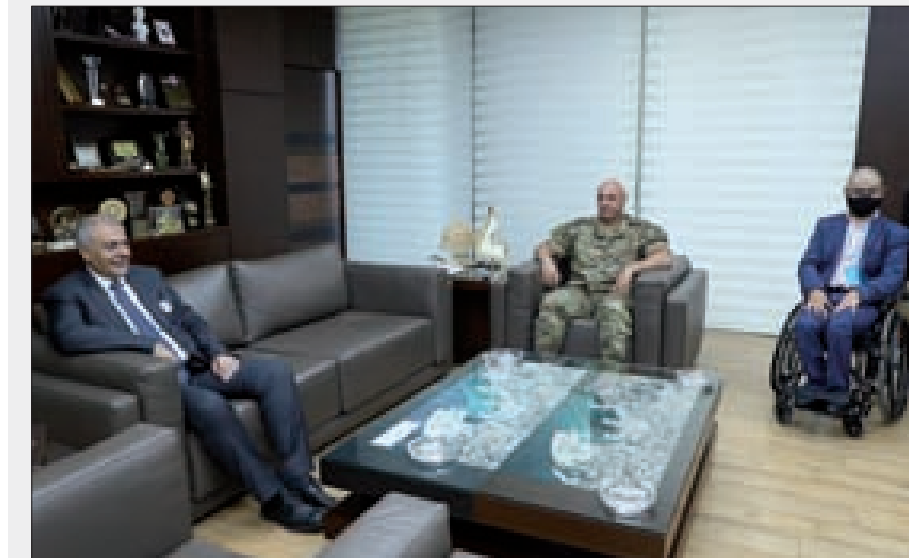
قائد الجيش ومحافظ بيروت خلال لقائهما في اليرزة أمس

● استقبال قائد الجيش العماد جوزاف عون في مكتبه في اليرزة، محافظ بيروت القاضي مروان عبود، وجرى البحث في الجهود المبذولة لمساعدة المتضررين جراء انفجار مرفأ بيروت.