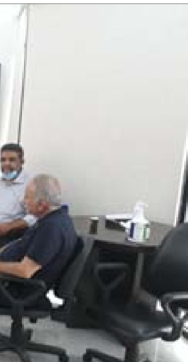
خلال اللقاء في مقر الاتحاد العمالي

وإزاء الإنهيار المالي الحاصل وتمنع الدولة ومصرف لبنان عن مصارحة الناس عن مصير ودائعهم وقدره هذا المصرف على استمرار تمويل استيراد احتياجات اللبنانيين من المواد الغذائية والسلع الأساسية، تم التوافق على «ضرورة الدعوة لدرس معمق وجذري للسياسة المالية والاقتصادية والنقدية للبنان والشروع بالتلازم بين التغيير الداخلي وتأمين خطوط ائتمانية سريعة للمصرف المركزي ليستطيع تمويل عمليات الاستيراد حتى تستقيم الأمور». واعتبر المجتمعون أن «هذا الاجتماع هو