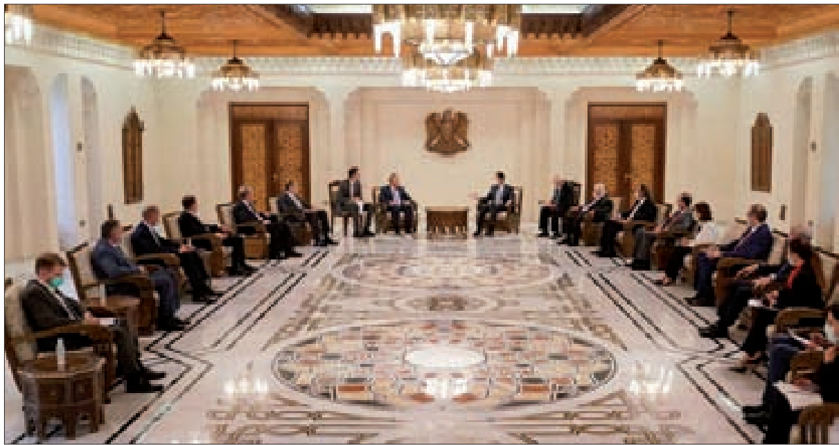
الرئيس الأسد مجتمعاً إلى الوفد الروسي في دمشق أمس