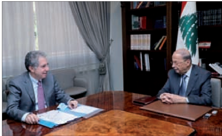
عون مجتمعاً إلى وزني في بعداً أمس

فهل ينتج أديب بإرضاء الفرنسيين وعدم إغضاب الأميركيين واستيعاب الخليجين وتلبية قوى الداخل؟ هذه مهمة شديدة الصعوبة، لكن حاجات الداخل والخارج تدفع نحو هدنة في لبنان عنوانها حكومة حيادية لرئيس حكومة أديب يعرف كل أنواع اللياقات والضرورات!