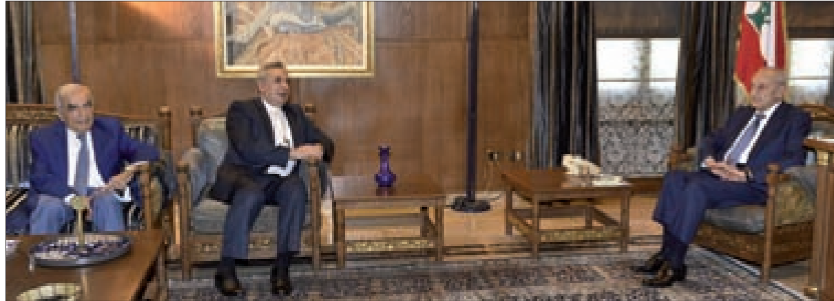
بري مستقبلاً رئيس الطائفة الإنجيلية في عين التينة أمس (حسن إبراهيم)

عرض رئيس مجلس النواب نبيه بري في مقر الرئاسة الثانية في عين التينة، مع رئيس المجمع الأعلى للطائفة الإنجيلية في لبنان وسورية ألكس جوزيف قصاب، الأوضاع العامة وشؤوناً تربوية.