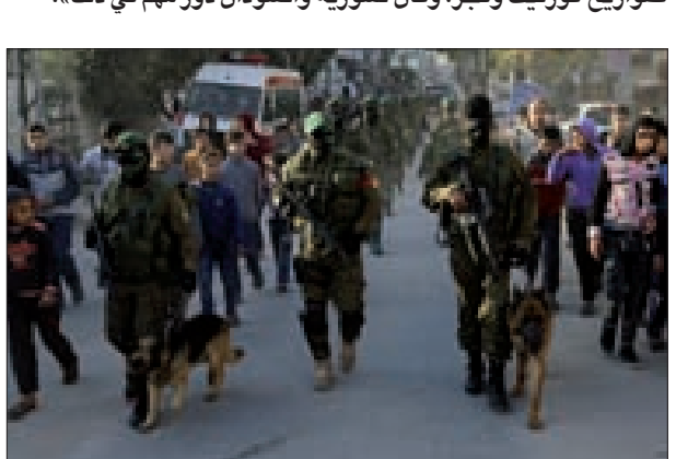
صواريخ كورنيت وفجر، وكان لسورية والسودان دور مهم في ذلك... (النتمة ص9)

وقال: «قمنا بفحص القذائف البريطانية التي عثرنا عليها في عمق البحر بعد إعادة تدويرها على يد كتائب القسام»، مضيفاً: «أجرينا تجربة على سفق إسمنتي مسلح بسمك 40 سم، وكانت النتيجة تدمير الهدف بالكامل».