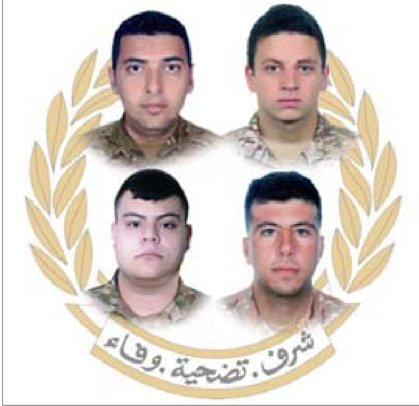
شهداء الجيش الأربعة

كما شدّد على أن «من هذه الأرض الطبية، أرض الشمال العزيز الذي يمثل أحد أهم الروافد