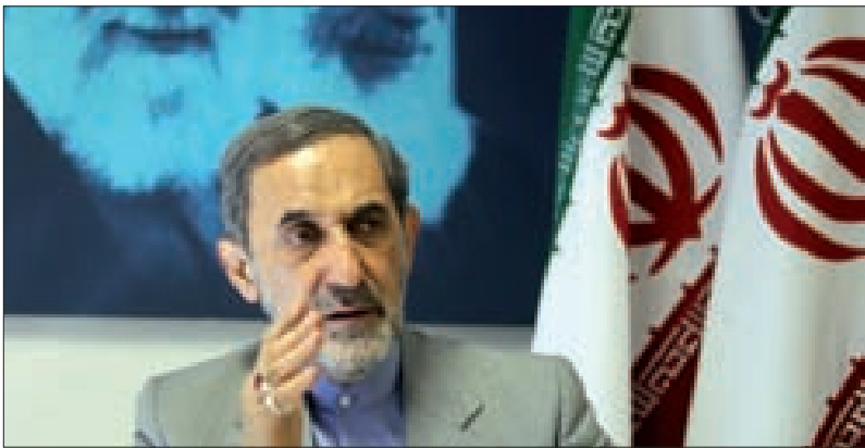
وقدمت الدول الـ 13 من بينها بريطانيا وفرنسا وألمانيا وبلجيكا وكذلك الصين وروسيا، رسائل اعتراض. ولمناقشة الخطوات الأميركية الرامية إلى إعادة فرض العقوبات على إيران».

وكانت الدول الـ 13 من بينها بريطانيا وفرنسا وألمانيا وبلجيكا وكذلك الصين وروسيا، رسائل اعتراض. ولمناقشة الخطوات الأميركية الرامية إلى إعادة فرض العقوبات على إيران».