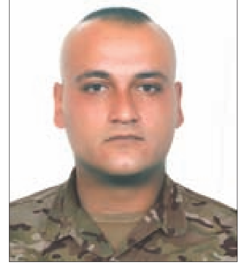
العرف الشهيد محمد خالد النشار

المنزّل الذي يتحصّنون بداخله. بالتحقيق معهما تمّ التأكد من وجود أسلحة خفيفة ومتوسطة بحوزة أفراد المجموعة إضافة إلى كمية كبيرة من القنابل اليدوية وصواريخ لاو وأحزمة وعبوات ناسفة. وتابعت «الساعة 16.30 من تاريخ 2020/9/26» ، نفذت القوة الضاربة في شعبة المعلومات عملية نوعية أدت إلى تطويق المنزل من جميع جهاته، ولدى إنذار من داخل المنزل بالاستسلام بادروا إلى إطلاق النار والقذائف والقنابل بجزارة شديدة، فردت عليهم القوة الضاربة بالصورة المناسبة، فحصل اشتباك مسلح استمر لغاية الساعة الواحدة فجراً تقريباً (أمس)، تمّ بنتيجة التمكن من تصفية أفراد المجموعة كافة المتواجدة في المنزل وعددهم تسعة أشخاص (يجري العمل على تأكيد هوياتهم) دون وقوع أي أصابات في صفوف القوة المداهمة. جرى ضبط كمية كبيرة من الأسلحة والقنابل اليدوية والأحزمة الناسفة. ما زالت التحقيقات والإجراءات جارية بإشراف النيابة العامة التمييزية».