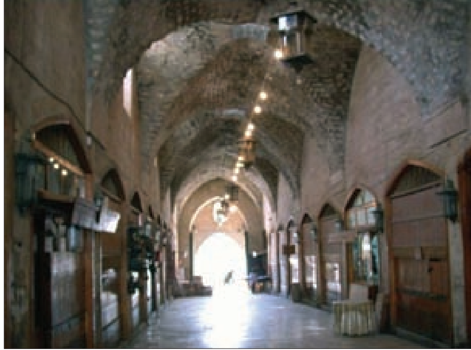
سوق الخيش في حلب