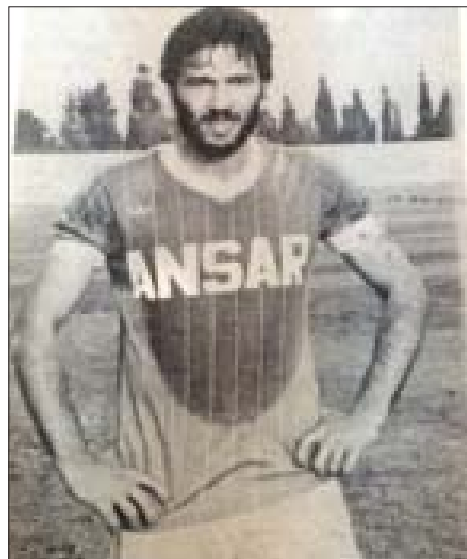
بختي في مواسمه الأولى مع الأصغار