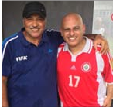
بختي ورفيقه في الملاعب هذه الأيام الممثل عباس شاهين