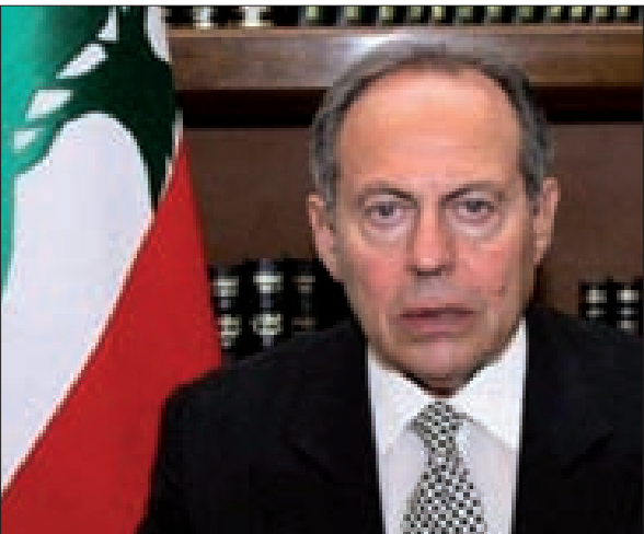
الرئيس إميل لحود

وأشار الرئيس لحود في بيان إلى أن البعض يصرّ في الإعلام على اعتماد سياسة الكذب المتكرّر، عل ما يقوله يرسخ في أذهان الناس، إلا أن هذا الأسلوب لا يجدي نفعاً معنا، ولن نتردد في توضيح الحقائق منعا لتضليل الرأي العام». ولفت لحود الى أن «توقيت الكلام الذي سمعناه لا يمكن تجاوزّه، خصوصاً في هذه الفترة التي يواجه فيها لبنان عدواناً بأسلوب جديد من خلال