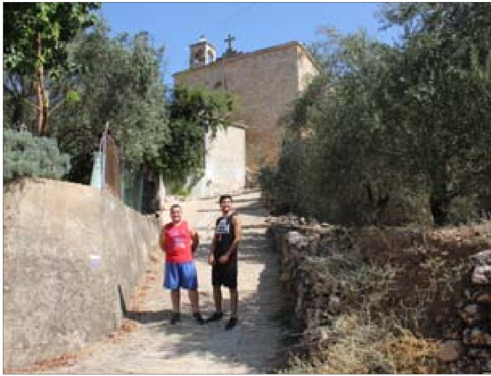
الطريق إلى الكنيسة