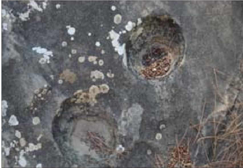
اثر قائمتي حسان جاورجيوس في الصخر