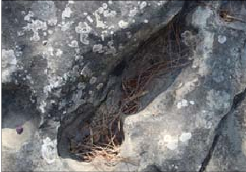
اثر مداس جاورجيوس في الصخر