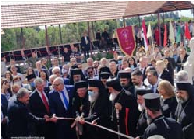
يوحنا العاشر مفتتحاً مستشفى في وادي النصارى

سائر أطراف هذا البلد». وأضاف: «صلاتنا اليوم ومجد الوطن ومجد أبنائه وخيرهم هو سورية وسلامها ووحدة أراضيها. صلاتنا من أجل كل مهجر ومحتاج وبتيم. صلاتنا من أجل العين الساهرة على أمنها واستقرارها. صلاتنا إلى العذراء مريم وإلى القديس جاورجيوس وسائر القديسين من أجل راحة نفوس شهداء السوادي وسائر الشهداء. صلاتنا من أجل المخطوفين كل المخطوفين ومنهم أخوانا مطراننا حلب يوحنا ابراهيم ويولس يازجي وما تعسها أياما تمتن فيها كرامة الانسان