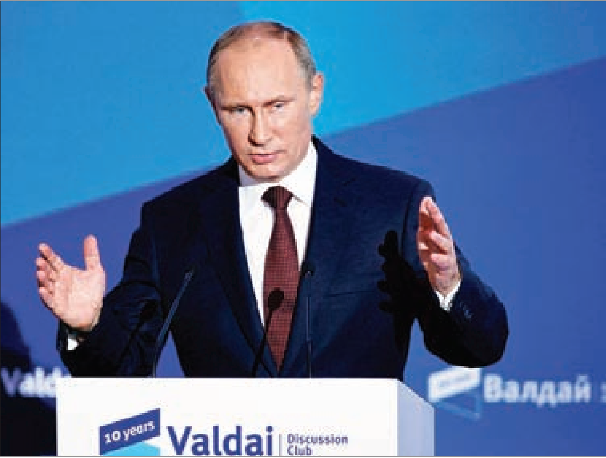
الرئيس الروسي فلاديمير بوتين خلال الحوار مع نادي فالدي