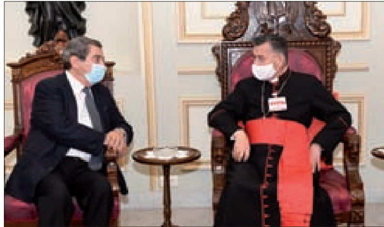
الراعي مستقبلاً الفرزلي في بركي أمس

وأعرب الفرزلي عن اعتقاده «أن مسألة تشكيل الحكومة ليست فقط لرومية، بل هي مسألة يجب بصورة فاطمة أن يُصار إلى تأليفها لأنها طريق الخلاص من الوضع الذي نعيشه والذي لم يعد بقدرته الشعب أن يتحمّله».