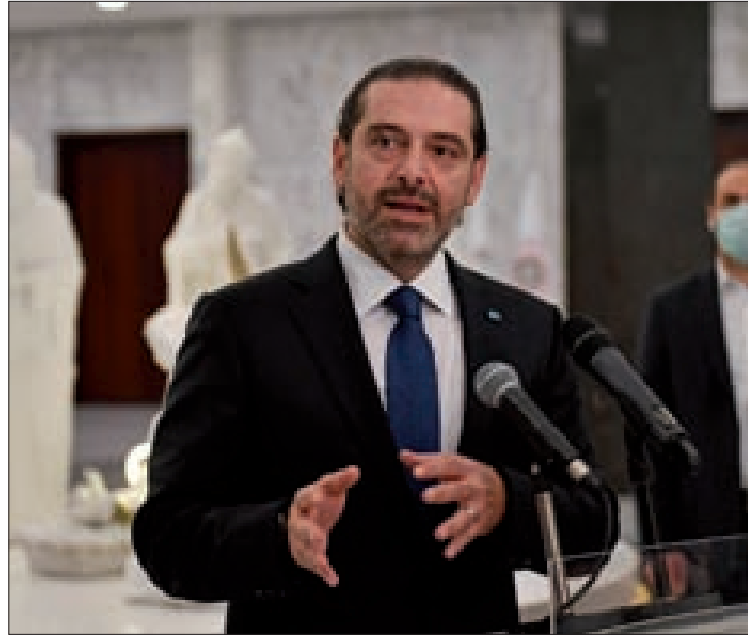
الحريري يتحدث للصحافيين في بعدا أمس (عباس سلمان)

أن «وزارة المال بدأت منذ (أول من) أمس دفع رواتب الموظفين العسكريين والأمنيين، وسيتم اليوم (أمس) صرف رواتب موظفي القطاع المدني، وبذلك تكون رواتب وأجور جميع موظفي الدولة، متقاعدین وغيرهم قد تم دفعها قبل نهاية الأسبوع الحالي».