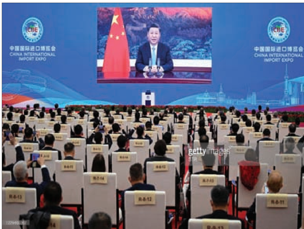
العلاقات الصينية يسهم بأكثر من ثلثي النمو الاقتصادي في العالم