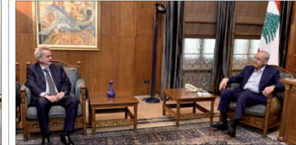
بري خلال لقائه سلامة في عين التينة أمس

موقعه ودوره على قواعد العدل والمساواة والشراكة ليعطي وطناً نهائياً لجميع أبنائه، بذلك يكون لبنان واللبنانيون بالف خير وتصحح كل ألامهم أعياداً مجيدة».