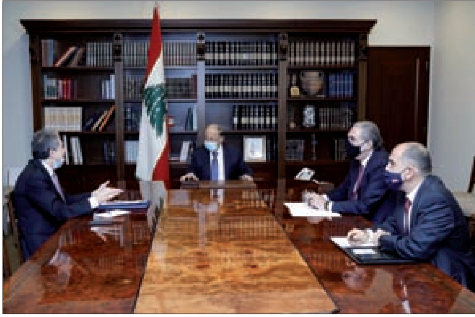
عون مجتمعاً إلى وزنة في بعدا أمس (اللاتي ونهرا)

ولفت إلى أن الشركة «أرسلت منذ عشرة أيام رسالة إلى مصرف لبنان أبدت استعدادها لإعادة العمل مع الدولة اللبنانية». ورداً على سؤال عن رواتب موظفي القطاع العام والتخوف من عدم تأميتها، أوضح وزني أن «لا خوف على الرواتب»، مشيراً إلى