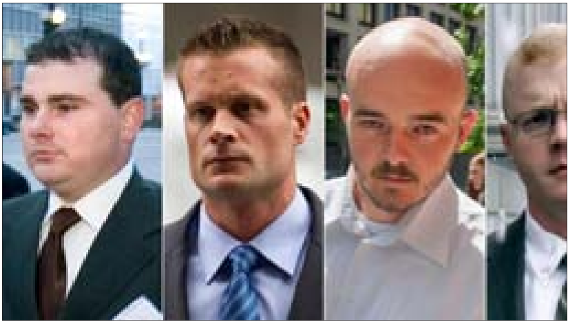
ولم يلتزموا بمعايير حددت في عمل الشركة والقانون الأمريكي».

وأصدر الرئيس الأميركي دونالد ترامب عفواً بالكامل عن 4 عناصر سابقين في شركة «بلاك ووتر» العسكرية الخاصة أدينوا بارتكاب جورة خلفت 14 قتيلاً بين المدنيين في بغداد عام 2007.