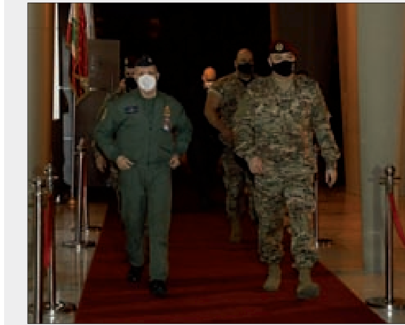
قائد الجيش خلال استقباله رئيس الأركان الفرنسي في البرزة أمس

عزّد رئيس الحزب الديمقراطي اللبناني النائب طلال أرسلان عبر حسابه على «تويتر»، كاتباً «سمعنا (ول من) أمس أنّ هناك تقدماً بموضوع التآليف الذي أصبح ضرورياً وحاجة ملحة للبنانيين في هذه الظروف الاستثنائية التي تمرّ بها البلاد، لكن ليس على حساب الدروز وتمهيشهم كطائفة مؤسسة لهذا الكيان وأساسية فيه، لذلك نحمل الرؤساء مسؤولية الإجحاف الذي سيلحق بنا كطائفة في حكومة 18 وزيراً». وأضاف «علماً بأننا لم نطلب مستحياً إذا قلنا إنّنا زيادة العدد العشريين أو تخفيضه إلى 16 ليكون للدروز تمثيلهم الصحيح». وختم بالقول «بشكل أوضح (اللي) يطالع منّا نحننا منطلع منوّ، وليتحمّل القريبون والبعيدون مسؤولية الظلم والحرمان والإجحاف بحق الطائفة التي قدّمت وتقدّم الكثير للبنان».