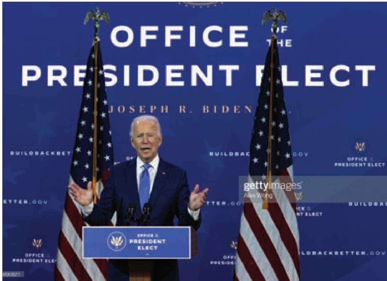
إدارة بايدن أمام تحديات اقتصادية كبيرة

ومع زيادة المسؤولية، وارتفاع المخاطر، إلى جانب الضغط من مجالس إدارة الشركات؛ سيؤدي ذلك إلى تسريع هذه المبادرات خلال عام 2021. وستتجه معظم الحكومات أيضاً لتشجيع الخضراء ركيزة أساسية لبرامجها الهادفة إلى التحفيز الاقتصادي، وسيواصل المستثمرون التركيز بقوة على جعل مشروعاتهم الاستثمارية خالية من انبعاثات الكربون، تجاوباً مع زيادة التدقيق