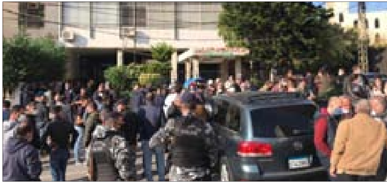
جانب من الاعتصام

نقذ موظفو وعمال مؤسسة مياه لبنان الجنوبي، لليوم الثاني على التوالي، اعتصاماً أمام مدخل المؤسسة للمطالبة بحقوقهم المتعلقة بمنحة الإنتاج السنوية، والمعادات التي لم يتقاضوها منذ سنوات عدة. وطالب المعتصمون «الوزارات المعنية بالتحرك لحل هذا الموضوع». كما طالبوا مدير المؤسسة بـ«السعي إلى حل هذه المشكلة ضمن الأطر القانونية التي ترعاها الحقوق المكتسبة والمراجعات التي ذللت بتوقيع وزير الطاقة والمياه». واشتكى عدد من العاملين في المؤسسة من «الزبائنية المتبعة حيث أن منحة الإنتاج قد تم دفعها للمحسوبين على الإدارة، وفي المقابل جرى حرمان غالبية العاملين منها». ودعوا إلى «التعامل مع الجميع بالقانون وليس وفقاً للولاء الحزبية».