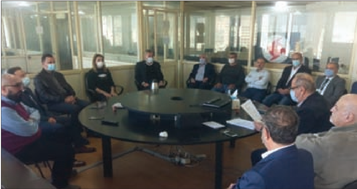
رئيس الحزب وأئل الحسنية مترسلاً جلسة مجلس العمد

بـ «الفوضى الخلاقة» بذريعة نشر الحرية والديمقراطية، وتفريخ منظمات تعمل تحت هذه العناوين خدمة لأجندات تقييدية وتقسيمية تصب في صالح المشروع المعادي. واعتبر الحسنية أنّ تصاعد الغطرسة الصهيونية والممارسات العنصرية ضدّ أبناء شعبنا في فلسطين المحتلة واستمرار العدو في تنفيذ مخططات الاستيطان والتفويض، والعنوان الصهيوني المتكرر على المناطق السورية واستباحة السيادة اللبنانية، ودعم المجموعات الإرهابية، كل ذلك يتمّ بدعم من الولايات المتحدة الأميركية وحلفائها وأدواتها في المنطقة والأقليم، والهدف من وراء ذلك، تصفية قضيتنا وتفتيت بلادنا وفرض الهيمنة الأميركية - الصهيونية عليها. وبنّيه الحسنية إلى أنّ هذه المرحلة دقيقة ومفضلية، لأنّ العدو الصهيوني العنصري والمجموعات الإرهابية المتطرفة، بدعم من رعاة الإرهاب يصعدون عملياتهم العدوانية والإرهابية. وأدان الحسنية الكمين الإرهابي الغادر الذي أوقع عدداً من الشهداء والجرحى على الطريق السريع في محافظة دير الزور، وقال: ندين بشدة هذا العمل الإرهابي الجبان، ونحني أرواح الشهداء الأبطال، ونعاهدكم ونعاهد كل شهداء حزبنا وشهداء الجيش السوري الباسل وشهداء الأمة على الاستمرار في الصراع حتى القضاء على كل بؤر الارهاب والتطرف. وإننا بقوّتنا ونباتنا سنقتل أهداف الهجمة الإرهابية المعادية، وسنرسم خريطة الطريق لتحرير فلسطين كل فلسطين وكل الأجزاء المحتلة والمستتلة من أرضنا القومية. وختّم الحسنية مبنّياً السوريين القوميين الاجتماعيين في الوطن وعبر الحدود، وكلّ أبناء شعبنا بمناسبة الأعياد، وخصّ بالتهنئة من هم في ساح الصراع، الأبطال البواسل الذين يواجهون الاحتلال والإرهاب والتطرف.