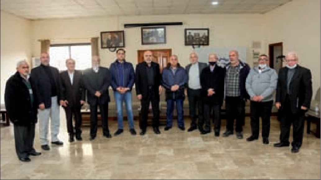
مسؤولو الأحزاب خلال اللقاء عند الخير

عُرفوا بمواقفهم الوطنية والقومية وسعيهم لتحرير فلسطين من الغاصب الصهيوني وتشديدهم على أهمية العلاقة اللبنانية – السورية النضالية المشتركة التي تجمع أبناء الشعب الواحد في القطرين».