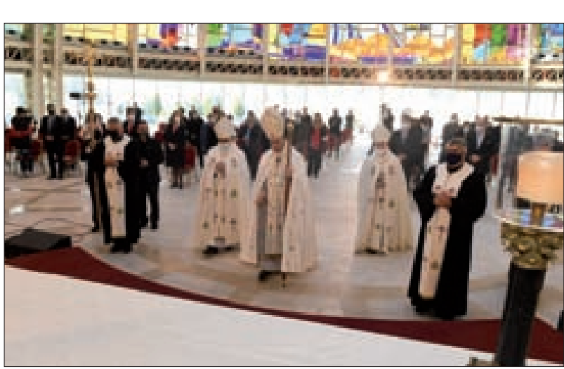
الراعي ومرثساً القُداس في بركي

الذي انتخب لتمثيل الشعب ويستمد شرعيته من الشعب، لا يسمح لنفسه بمعارضة إرادة الشعب الذي يريد حكومة اليوم قبل غد». واعتبر أن «إطلاق النار ليلة رأس السنة عادة غير راقية وغير حضارية». وقال «ألا يكفينا ضحايا المرفأ وجائحة كورونا والسلاح المنقلت فنزيد عليهم ضحايا الرصاص الطائش وأضراره المادية؟ بعض اللبنانيين لا يملك ثمن رغيف خبز، فكيف تملكون ثمن السلاح الآفة في جميع المناطق».