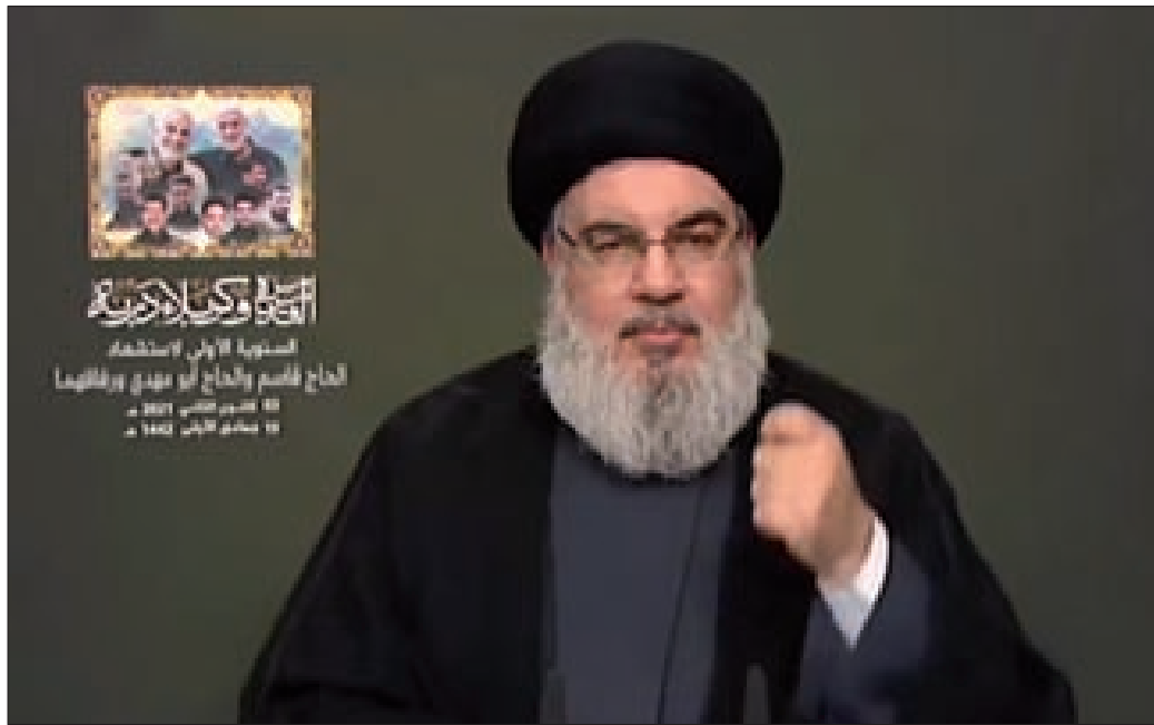
السيد نصرالله متحدثاً عبر الشاشة أمس

أكد الأمين العام لحزب الله السيد حسن نصرالله أن المنطقة في حالة توتر شديد، لافتاً إلى أن هناك قلقاً كبيراً في الخليج وأن «إسرائيل» أعلنت رفع الجهوزية. وأشار إلى تحريف وسائل إعلام لبنانية كلام قائد سلاح الجو في الحرس الثوري الإيراني حاجي زادة عن الجبهة الامامية لمواجهة الاحتلال الإسرائيلي».