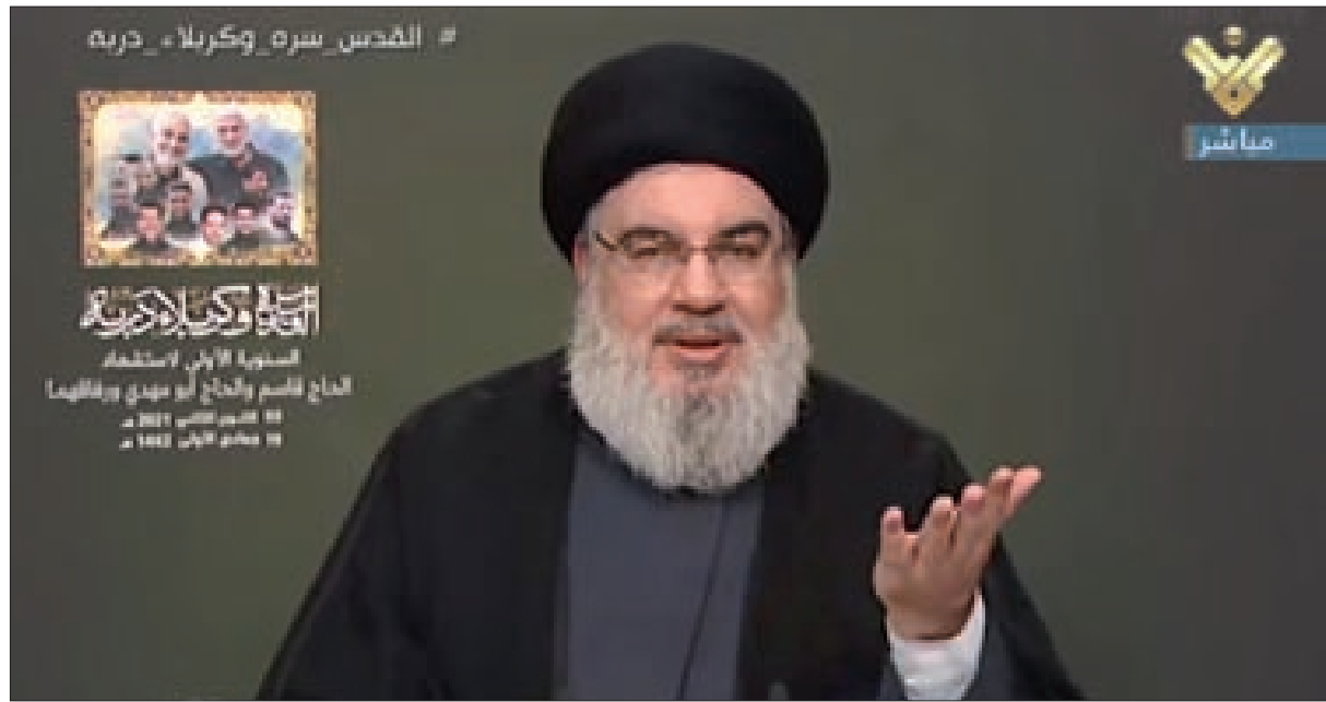
السيد نصرالله يلقي كلمته أمس في الذكرى الأولى لاستشهاد القائدين سليمانى والمهندس ورفاقهم

للمصلحة الوطنية، قائلاً إن صواريخ المقاومة الإيرانية أتت من إيران، لكن لدعم المقاومة لتحرير أرض لبنان والدفاع عن لبنان، ولولا هذه الصواريخ التي جلبها القائد سليمانى لما أقام أحد حساباً للبنان ولا كان بالمستطاع الدفاع عن نطقه وغازه. وعن الذكرى قال نصرالله إن محور المقاومة نجح باستيعاب واحتواء الصدمة، وإن سليمانى وهو شهيد يحبس أنفاسهم اليوم، مضيفاً أن الرد على اغتيال سليمانى سيكون إيرانياً، وكل ما يُقال عن طلب إيران من حلفائها القيام بالرد بدلاً منها جهل وسخافة وتزوير. بالتوازي لبنان أمام ملفين معاً، ملف الحكومة وملف كورونا، فعن التطور الكارثي لوباء كورونا، تحدث وزير الصحة حمد حسن عن دعوة للإقفال العام مجدداً، بانتظار اجتماع المجلس الأعلى للدفاع، لإقرار خطة المواجهة، ورد الوزير على كلام رئيس المجلس الاقتصادي الاجتماعي شارل عريبي ودعوته للإقفال بقوله، «أكلنا الضرب» بسبب الضغط الذي مارسه القطاع الخاص للحؤول دون الإقفال في الأعياد، والأن وقد مرت الأعياد وتمّ التقشي يطالبون الإقفال، وحمل حسن المستشفيات الخاصة التي لم تنضمّ لخطة مواجهة كورونا مسؤولية نقص القدرة على المواجهة.