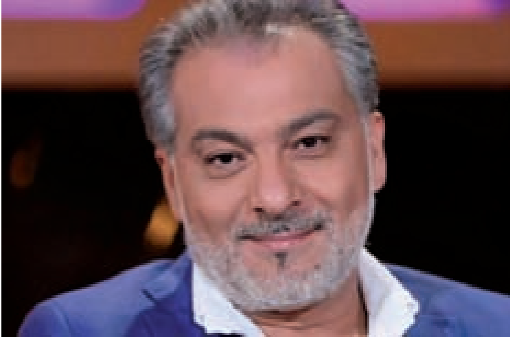
المخرج الراحل حاتم علي

هذا الحدّ يَل أشعل الدراما العربية بزوادة كبيرة من الأعمال الفنية وأضاء على تغرية عاشها بماهيتها، ووجعها وألمها، بنزوحها، بتشريدِها، بإحساسه النبيل فخطط لها، وعجنها بحسه المرفه، ابن الجولان السوري المحتل الذي ترك أراضه رغماً عنه، فقدم مسلسلًا جسد سجلاً حافلاً من المرارة الموجعة التي استولنت على جسد الذاكرة حين رسم النضال الفلسطيني في مسلسل «التغريبة الفلسطينية» بأبهي صورهِ وأجمل تعاضده حيث كانت اليد باليد والكف بالكف، ونيش ذكريات القرى التي وقفت في وجهه الإحتلال البريطاني ووجهت بالقتل والتدمير وانتهت بالتهجير.