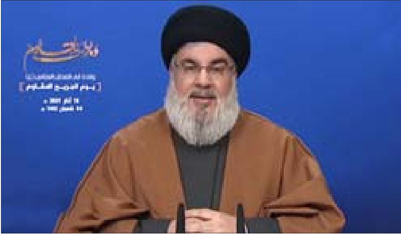
السيد نصرالله متحدثاً عبر الشاشة مساء أمس

وأضاف «يجب ألا نبطئ الأمور وعلى سبيل المثال أن لا نقول للناس أن الحل هو بتشكيل حكومة بل تشكيلها هو جزء من مسار طويل» مؤكداً أنه «إذا بقيت الإدارة على هي وأليات العمل والقضاء والمحاسبة والمراقبة يعني أن القروض التي سيحصل عليها لبنان سيتم هدر كثير منها»