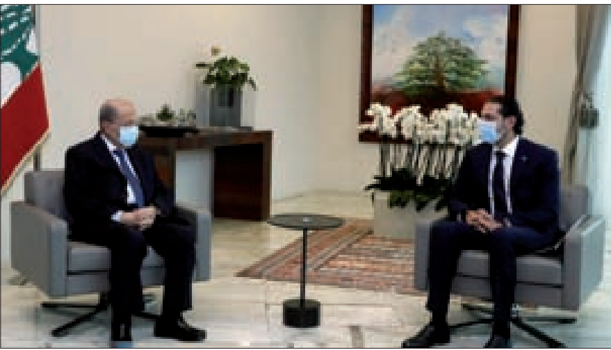
عون مجتمعاً إلى الحريري في بعدا أمس

نتيجة لذلك، لقد حان الوقت لكي تعمل روسيا والولايات المتحدة معا من أجل وقف الحرب في سورية، وإزالة كل من لا يرغب في التفاوض مع الآخرين من ساحة المعركة في سورية.