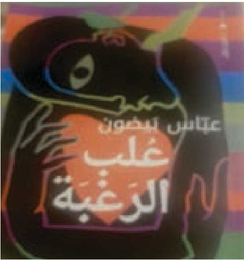
غلاف رواية الرغبة

إنّا يوماً سوف نبرد فخبئني تحت طبابت معطفك في عقدة الشال في عروة زر من أزرار قمصانك خبئني بين رجفة وأخرى بين سيجارة وأخرى بين الفئجان وبصمات أصابعك فهنأك يا حبيب