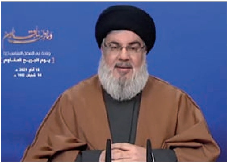
السيد نصر الله متحدثاً عبر الشاشة مساء أمس