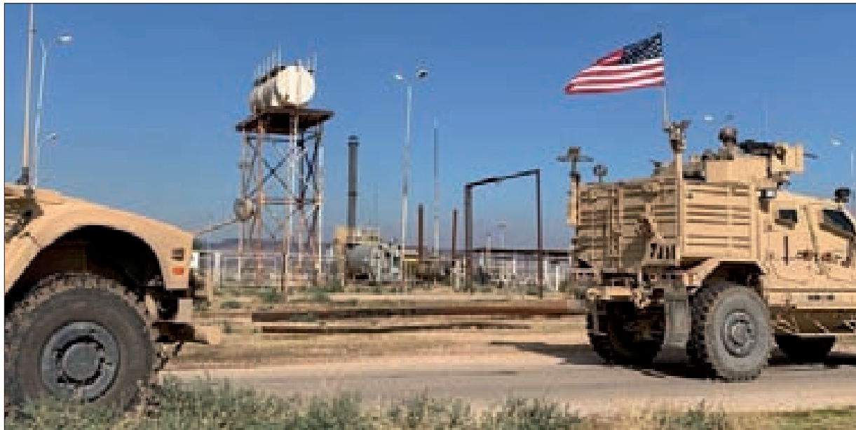
هؤلاء الإرهابيين منذ نيسان 2011 وحتى نهاية عام 2015 بلغ 360 ألف إرهابي.

وأكدت الدراسة أن هؤلاء الإرهابيين توافدوا من نحو 93 دولة على مستوى العالم وبلغ عدد القادمين من الولايات المتحدة والاتحاد الأوروبي فقط 21500 عام منهم 8500 شخص إلى بلدانهم.