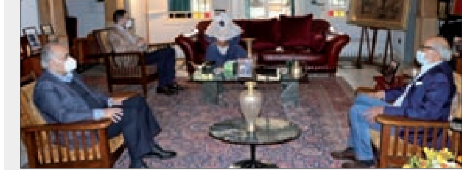
تيمور جنبلاط مجتمعاً إلى سفير الكويت في كليمصو أمس

● عرض سفير الكويت في لبنان عبد العال القناعي، مع الرئيس المكلف تأليف الحكومة سعد الحريري في بيت الوسط، المستجدات السياسية والأوضاع العامة والعلاقات الثنائية بين البلدين. وبحث القناعي مع رئيس «اللقاء الديمقراطي» النائب تيمور جنبلاط في كليمصو، في حضور النواب: أكرم شهاب، وائل أبو فاعور وهادي أبو الحسن، التطورات الراهنة. وبعد اللقاء استبقى النائب جنبلاط ضيوفه إلى ماأذة الغداء.