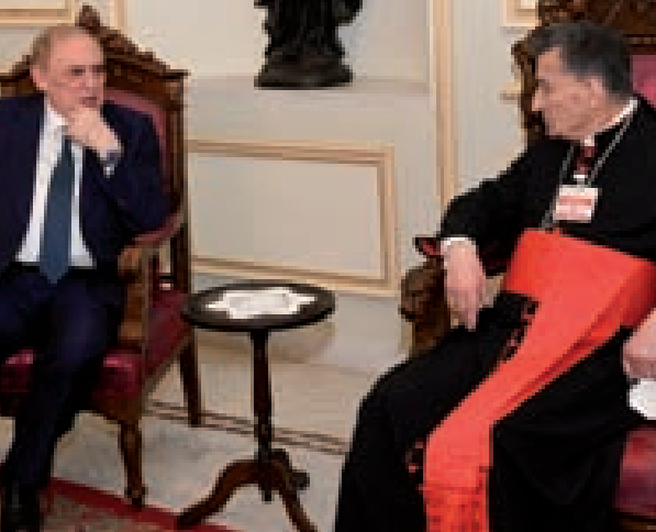
الراعي خلال استقباله البستاني في بركي أمس

البلد على الانهيار التام». وأشار إلى انتظار «دور رائد للأمم المتحدة»، ولا سيما «أن لبنان هو عضو مؤسس وفاعل في المنظمة الدولية منذ تاسيسها. وكان الاتصال مناسبة ليلتحط بطيريك الراعي