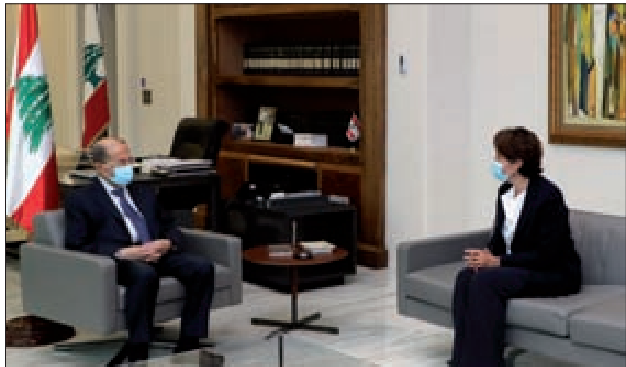
عون مستقبلاً سفيرة فرنسا في بعبدا أمس

وفي خلال اللقاء نقلت موشيكويانو إلى الرئيس عون «تضامن ودعم المنظمة للبنان واللبنانيين في هذا الظرف الصعب الذي يعيشونه»، طالبة من الطبقة السياسية «إيجاد حلول سريعة لازمة الراهنة»، مشيدة «بلبنان وبدوره في المنظمة» ومؤكدة «استمرار خطة فتح المكتب الإقليمي في بيروت في خلال العام الحالي».