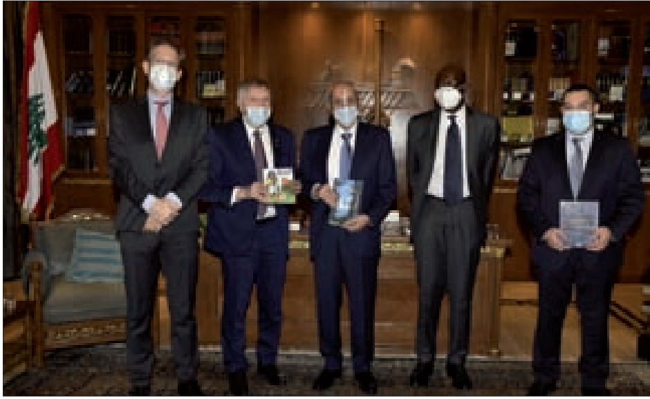
بري متوسطاً وقد الجمعية البرلمانية الفرنكوفونية في عين التينة أمس

وإذا كان عبدالله المشنوق حموياً بيروتياً عربياً أي من قلب بلاد الشام، فإن المشنوق الحالي ينتسب إلى تيار متلونّ ينتمي مرة إلى بيروت وأخرى إلى آل سعود في جزيرة العرب وأخرى إلى عروبة الأميركيين عند سفيرتهم شيا ليقدم لها الولاء والطاعة لعروبة عجيبة غريبة تبدأ من محمد بن سعود ولا تنتهي عند شيا مروراً بالّ زيد في الإمارات وهاشميين الأردن وأقباط مصر الذي ينتمي إلى دولتهم