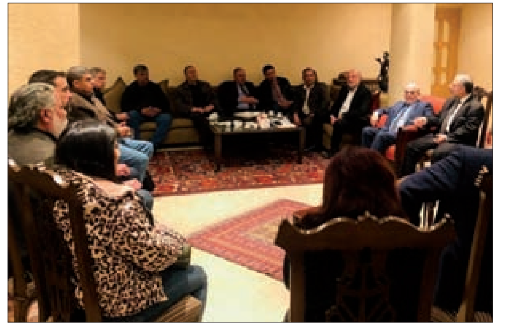
الحسنية وحردان خلال الاجتماع في دمشق مع المنفذين العاميين

تحتجب «البناء» غداً الجمعة لمناسبة عيد البشارة، وذلك عملاً بقرار نقابتي الصحافة والمحررين، على أن تعود إلى قرأتها كالمعتاد صباح السبت.