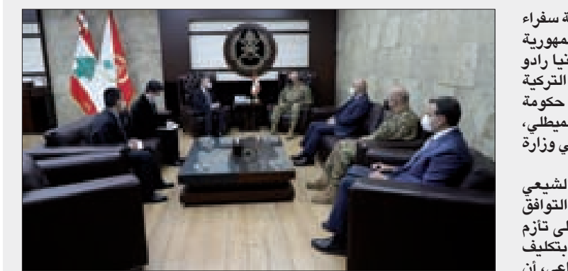
قائد الجيش مستقبلاً سفير الصين في اليرزة أمس