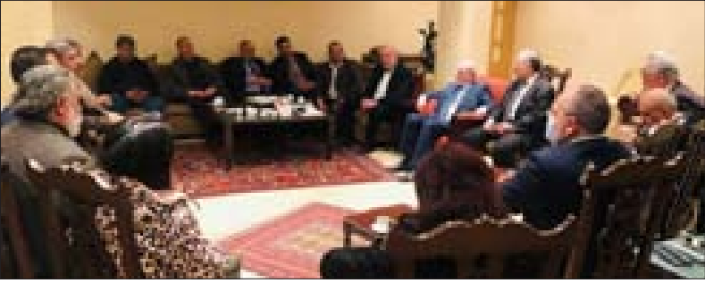
الحسنية وحردان خلال الاجتماع في دمشق مع المنفذين العامين