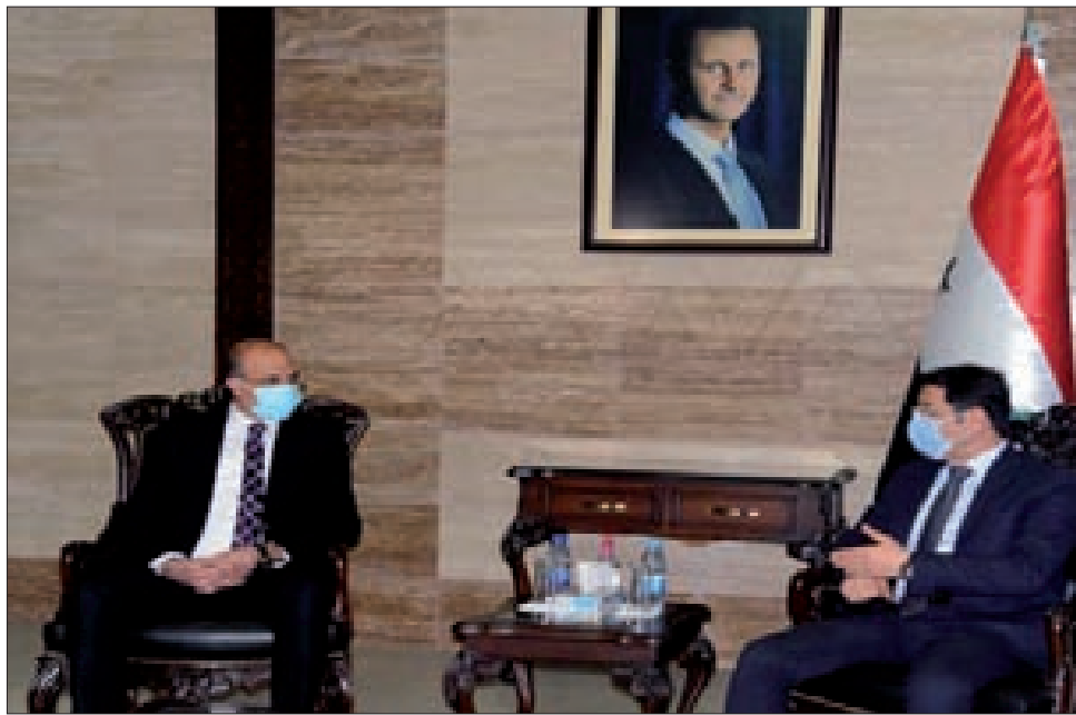
وزير الصحة السوري د. حسن الغباش مستقبلاً نظيره اللبناني د. حمد حسن في دمشق أمس