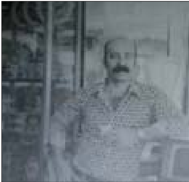
الرفيق منح في متجره في كراكاس