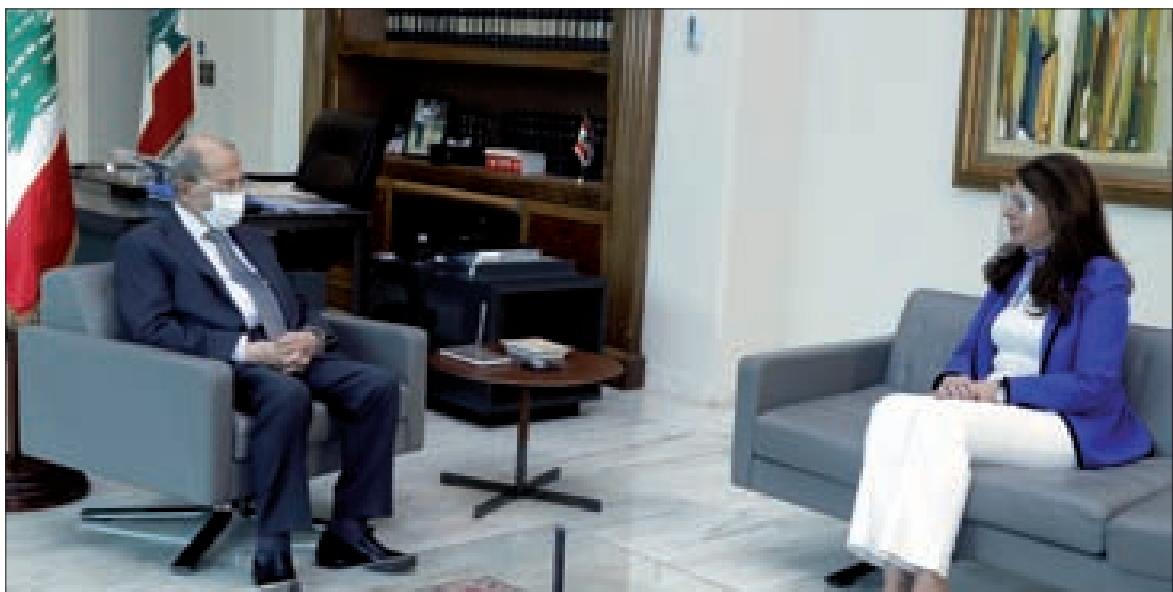
عون مستقبلاً شريم في بعيدا أمس

تابع رئيس الجمهورية العماد ميشال عون مع زوّاره أمس في قصر بعيدا، مواضيع إنمائية وديبلوماسية.