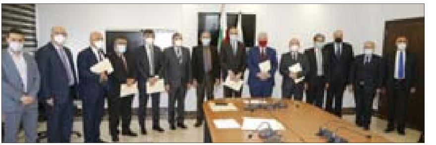
حسن متوسلاً رؤساء ومدراء الجامعات المعنية وممثل عن شركة فايزر

وَقَّعَ وزير الصحة العامة الدكتور حمد حسن، خمس اتفاقيات مع الجامعة اللبنانية وعدد من الجامعات الخاصة في لبنان، بغية تأمين كمية من لقاحات فايزر لتلقيح الطاقم التعليمي والإداري، وتأمين عودة سالمة للأساتذة والطلاب والموظفين قبل مطلع الخريف المقبل، بالإضافة إلى تلقيح بعض القطاعات الاجتماعية والاقتصادية والمساعدة في عملية التلقيح للمحتاجين في مختلف المناطق اللبنانية الثانية وفق معايير خطة اللجنة الوطنية، وحضر حفل التوقيع رؤساء ومدراء الجامعات المعنية وممثل عن شركة فايزر ومعمنون.