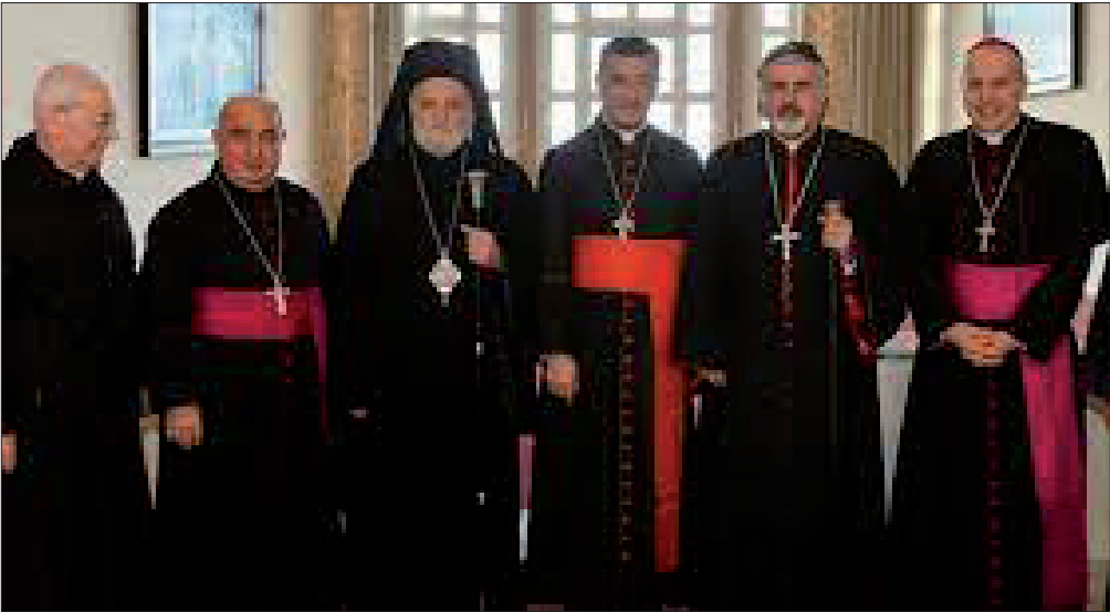
البطاركة الكاثوليك خلال اللقاء في بكركي

رئيس الجمهورية وال السفير السعودي وبكركي؟». أجاب كرامي «هذه نظرية افتراضية، فالיום هناك رئيس حكومة مكلف وتنمّنّي له النجاح في تشكيل الحكومة، فإنا نعمل في السياسة ومن الطبيعي أن أזור الجميع خصوصا من يسعى لإنقاذ البلد، فالدولار اليوم لاس عتبه الأربعة عشرة ألف ليرة لبنانية وكل القطاعات تتداعي وتنتهوى وهذه مصيبة كبرى ستدعي الاتصال بالجميع».