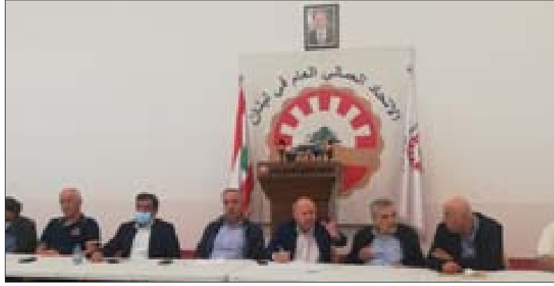
جانج من اجتماع المكتب التنفيذي للاتحاد العمالي العام أمس

أكد الوزير السابق رائد خوري في تصريح أن «مصيبة لبنان هي في تثبيت سعر صرف الليرة»، وقال: «العملة الصعبة خرجت من لبنان بسبب السياسات الاقتصادية والقدرة الشرائية المصطنعة، ما أدى إلى عجز كبير في الميزان التجاري». وأشار إلى «أننا نغرق بتفاصيل ليست هي الحل للازمة الاقتصادية التي نحن فيها، ونحن حذرنا من هذا الوضع في العام 2017»، ولفت إلى أن «الاحتياط المركزي يؤثر على سعر صرف الليرة، لأنه كلما انخفض الاحتياط في مصرف لبنان انخفضت قيمة العملة الوطنية». ودعا إلى «التنسيق بين مجلس النواب، والبنك المركزي، لتنسيق الاستنتاجات في قانون الكابيتال كونترول»، وأكد أننا «بأمس الحاجة لإعادة ضبط المولدات الخاصة مع الأخذ بعين الاعتبار التضخم الحاصل». ولفت إلى «أننا في الدائرة نفسها نصرف