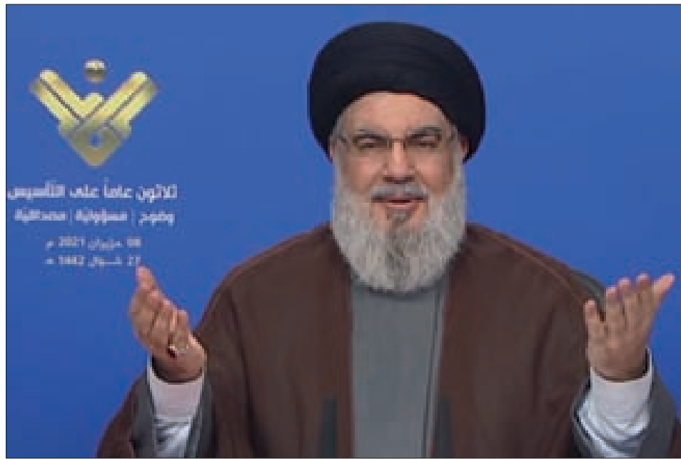
السيد نصرالله متحدداً أمس في الذكرى الثلاثين لانطلاق قناة المنار (التمتمة ص6)

منصة تصعيد بوجه الحكومة الجديدة، وتراجعه يعني اقتناعه بأنه لا يملك الموازين اللازمة لخوض المواجهة، فقرر ترك الملف فحاً بوجه الحكومة المقبلة فإن قامت بإلغاء المسيرة يسهل اتهامها بالتراجع والهزيمة أمام قوى المقاومة، وإن أصرت عليها يستدرجها إلى الموقع الذي يتيح له التلاعب بها بين ثنائية استرضاء الشارع واسترضاء واشنطن. الوضع في القدس كان حاضراً في كلمة الأمين العام لحزب الله السيد حسن نصرالله، بتحذيره من مغبة ارتكاب حماقة من جانب كيان الاحتلال المازوم والحاقد والأحمق، وتأكيد على معاملة قوى المقاومة باعتبار الإعتداء على القدس سبباً لحرب إقليمية، مشيداً بموقف أنصار الله في اليمن واستجابتهم للمعادلة وانضوائهم ضمنها، مفرداً للملف اليمني فقرة خاصة شارحاً لاحتمة التلازم بين وقف النار ورفع الحصار، كي لا يتحول الحصار إلى حرب بطريقة أخرى للإخضاع والإذلال.