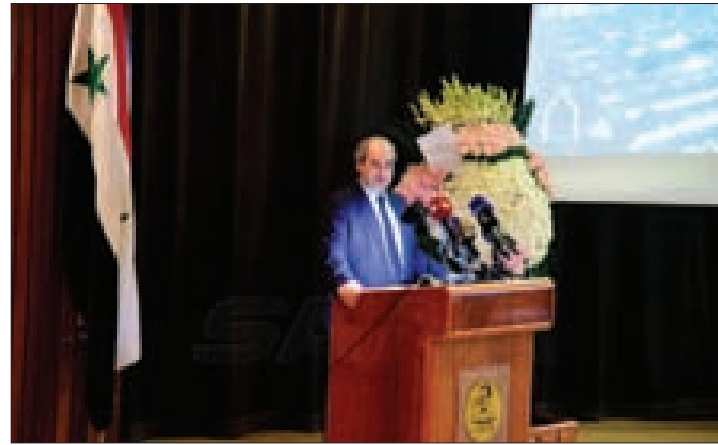
المقداد متحدتاً خلال حفل التوقيع

وأضاف أن ما تعرّضت له سورية، لا سيما عشية النار والإرهاب لها علاقة بما جرى في تلك الفترة السابقة لأنّ المخون الاستعماري الذي أنتج عصبة الأمم هو نفسه الذي أنتج الأمم المتحدة، مشيراً إلى أنّ هذا الكتاب هو الجزء الأول من سلسلة سيُعدون جزؤها الثاني ب «سورية» من منظمة الأمم المتحدة».