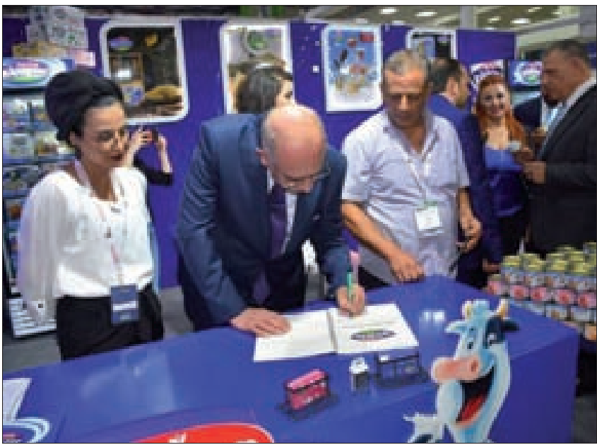
... وخلال جولة في أقسام المعرض

الحياة إلى أغلب مواردها الزراعية والغذائية، وبدأت عجلة الإنتاج تعود لسابق عهدها من العمل والتعمير. وأوضح الشماع «أن انتصار سورية على الإرهاب توجّه انتصارات صناعتنا وتجارتنا بكل قوة واقتدار، ولم لا وسورية كانت ولا تزال بلد العمل والكفاءة والإنتاجية إنها مركز الثقل العربي للصناعة الغذائية وهي التي تملك جميع مقومات النجاح من مواد زراعية ومواد خام وكوادر مهلة وأصحاب أعمال ناجحين يعشقون العمل والمغامرة، وما هي منتجاتنا الغذائية قد فاجأت العالم بنوعية وجودة المنتج وأسعار تنافسية وأضحّت لها مراكز في أغلب عواصم ومدن العالم، وبمجرد عبارة (صنع في سورية) فحظ أمام حكاية عشق لا تنتهي من الاحترافية والإتقان والتنافسية وقيل ذلك كله فإنّ المنتجات السورية أصبحت قصة نجاح والصناعات السورية في أصعب ظروف الحرب والأزمة».