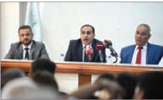
...ومتحدتاً خلال الندوة