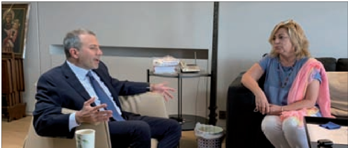
باسيل مجتمعاً إلى الرئيسة السابقة لبعثة الاتحاد الأوروبي إيلينا فالنسيانو

عرض رئيس «التيار الوطني الحرّ» النائب جبران باسيل، مع السفير التركي علي يارش أولوسوي، للأوضاع العامة والتطورات السياسية. ثم التقى باسيل الرئيسة السابقة لبعثة الاتحاد الأوروبي إيلينا فالنسيانو التي تولت مراقبة الانتخابات النيابية في العام 2018. وأكد باسيل خلال اللقاء «تمسكّ التيار بإجراء الانتخابات النيابية في موعدها، منبهاً إلى «أي محاولة للتلاعب بقانون الانتخاب النافذ تشكل ذريعة لبعض لإرجائها»، مشيراً إلى «استعداد التيار لإقرار أي تحسينات على القانون»، مشدداً على «حتمية أن يقترح المنتشرون». كما تحدث باسيل ببعثة الاتحاد الأوروبي على مراقبة جديّة للتحويل الانتخابي، في ظل تنامي مجاهرة بعض الأحزاب والأطراف بالجوء إلى المال السياسي، مؤكداً بأن «التيار سبق أن رفض مرتين التمديد الذي حصل للمجلس النيابي في العهد السابق، ولم يال جهداً للحفاظ على التقليد الديمقراطي اللبناني باحترام الاستحقاقات الدستورية ومنع التلاعب بالإرادة الشعبية أو مصادرة حق اللبنانيين في اختيار منطليهم وفق القاعدة الديمقراطية المعروفة، قاعدتي العيانية والتمثيل الصحيح».