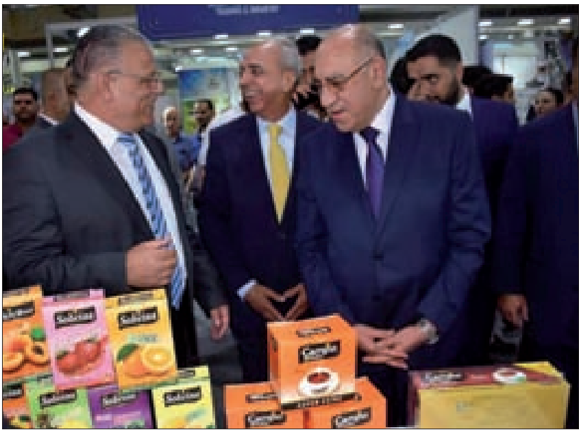
وزير الصناعة والزراعة خلال الافتتاح