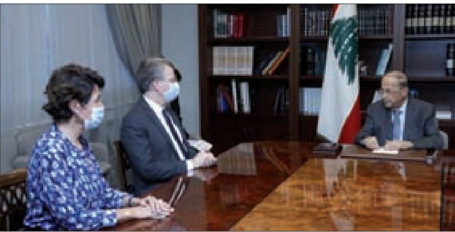
عون خلال لقائه الموفد الرئاسي الفرنسي في عبيدا أمس

جري خلال عرض لآخر المستجندات في لبنان والمنطقة والعلاقات الثنائية بين البلدين، وبحسب وكالة «اتباء الشرق الأوسط» المصرية فقد أكد الوزير المصري دعم مصر للبنان للخروج من الوضع الحالي.