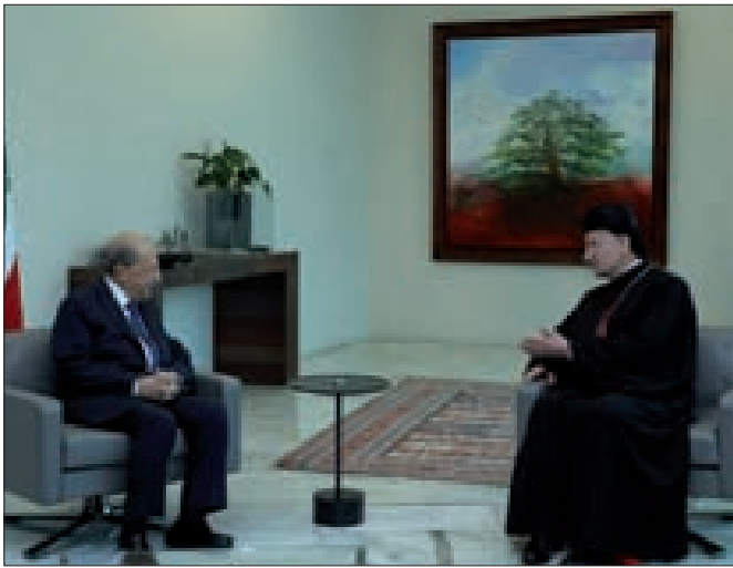
عون مستقبلاً الراعي في عبيدا أمس

تابع رئيس الجمهورية العماد ميشال عون مع رئيس حكومة تصريف الأعمال الدكتور حسان دياب خلال اجتماعهما أمس في قصر بعبدا، لتنفيذ الإجراءات والتدابير التي اتّخذت في الاجتماعات السابقة في شأن مسألتي المحروقات والدواء، إضافة إلى مواضيع معيشية أخرى. وتقرّر عقد اجتماعات لاحقة في خلال الأيام القليلة المقبلة لاستكمال تنفيذ هذه التدابير المقررة وإزالة العقبات التي برزت خلال عملية التنفيذ. واستقبل الرئيس عون البطريك الماروني الكاردينال بشارة الراعي الذي أطلعته على نتائج اللقاء الذي عقّد في الفاتيكان بدعوة من البابا فرنسيس في «يوم تأمل وصلادة من أجل لبنان».