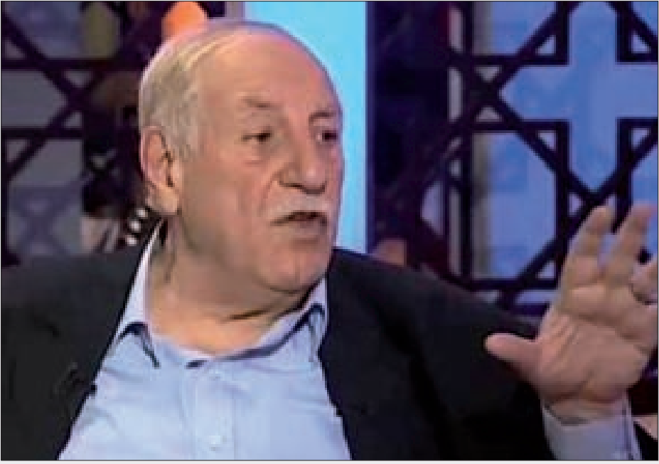
المناضل الراحل أحمد جبريل

نعى رئيس الحزب السوري القومي الاجتماعي وائل الحسنية، القائد المناضل أحمد جبريل - الأمين العام للجبهة الشعبية لتحرير فلسطين - «القيادة العامة».