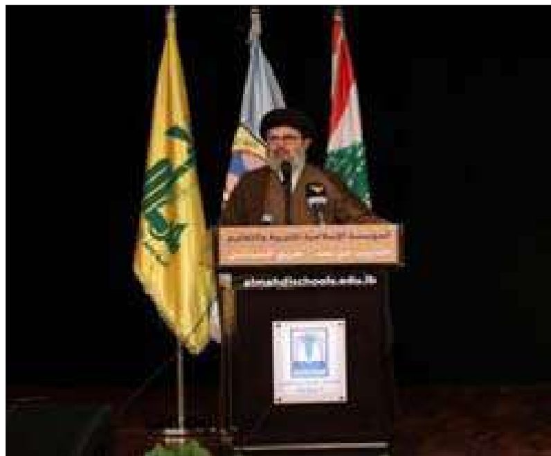
السيد صفي الدين متحدّثاً خلال رعايته الندوة التربوية الحضورية

الحلول الأول وليس الوحيد، أن يجتمع اللبنانيون ويؤمنوا بأنهم قادرون على الحل». وأضاف «نحن لم نستقل من مسؤولياتنا ولكن أعطينا فرصاً ولا زلنا نعطي فرصاً للحلول، لا زلنا في الوقت الذي يمكن أن ننقذ فيه لبنان قبل الكارثة الكبيرة». وتابع «نحن نؤمن أن الولايات المتحدة الأميركية هي المسؤول الأول عما نحن فيه من دون أن ننسى الداخل والفساد والخيارات الخاطئة، ولكن أغلب من مارس هذه السياسات هم من جماعة أميركا وأتوا في سياق المشروع الأميركي نفسه». وشدد على أن «اللبنانيين يجب أن يعلموا من هو المسؤول عن أزمته وأن يحتملوا أميركا المسؤولية مع ما يستتبعه من نتائج وعواقب، وأنه على أميركا أيضاً أن تتحمل مسؤوليتها بتدميرها للبلدان والشعوب».