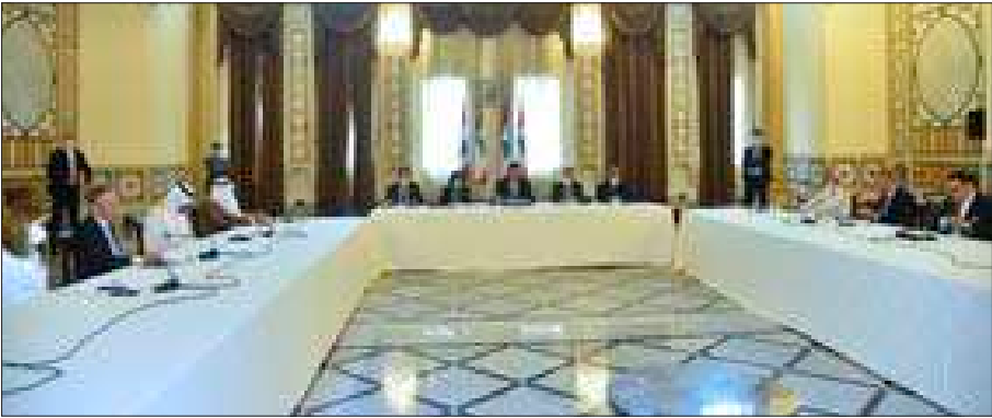
دياب خلال لقائه عدداً من السفراء في السراي أمس

ورثت السفارة الفرنسية على كلمة دياب، رافضة كلامه عن صغار خارجي على لبنان، فعُدّت ما قدّمته فرنسا من مساعدات للبنان واللبنانيين حتى من قبل انفجار المرفأ. وقالت «نعم للبنان مخيف، لكن المخيف دولة الرئيس هو أن الإنقار القاسي اليوم هو نتيجة هذا الانهيار وهو نتيجة لسوء الإدارة والتعاسع عن العمل لسنوات، وليس نتيجة حصار خارجي، بل نتيجة مسؤوليات الجميع المتعددة ومسؤوليات الطبقة السياسية.. هذه هي الحقيقة. اجتماع السراي اليوم محزن ومتأخر».