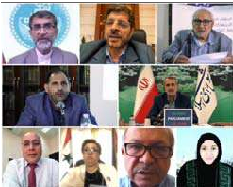
المشاركون في الندوة

عملية الاغتيال ممن كانوا يسيرون الطائرة، والمطالبة بإصدار إعلان حقوقي عالمي انطلاقاً من تعاليم الأديان السماوية وتوثيق الجرائم الأميركية وفتح دعاوى في محاكم ضمير أو في محاكم رسمية، وحض الدول عبر الجمعية