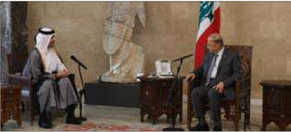
عون مستقبلاً القطري في بعيدا أمس

أبلغ رئيس الجمهورية العماد ميشال عون نائب رئيس مجلس الوزراء وزير خارجية قطر محمد بن عبد الرحمن آل ثاني الذي استقبله أمس في قصر بعيدا، ترحيب لبنان بالدعم الدائم الذي تقدمه قطر في المجالات كافة، شاكرًا ما يبديه أمير قطر تميم بن حمد آل ثاني في اهتمامه للمساعدة على تجاوز الظروف الصعبة التي يمرّ بها لبنان، وتداعياتها على مختلف الصعد.