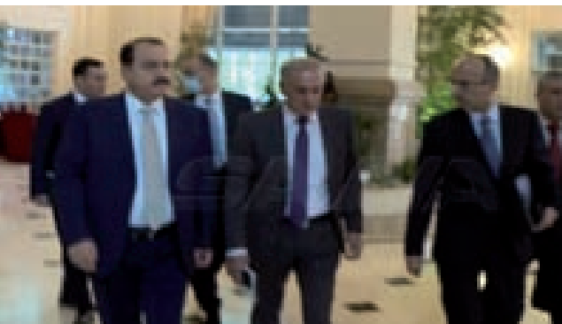
الوفد السوري يصل العاصمة الكازاخية

وصل الوفد السوري، برئاسة معاون وزير الخارجية والمغتربين الدكتور أيمن سوسان، إلى العاصمة الكازاخية نور سلطان أمس، للمشاركة بالاجتماع الدولي السادس عشر حول سورية بموجب صيغة أستانا الذي ينطلق اليوم ويستمر يومين. من جانب آخر أعلنت وزارة الخارجية الكازاخية، في بيان، أن الوفد الروسي برئاسة الكسندر لافريغتييف المبعوث الخاص للرئيس فلاديمير بوتين إلى سورية وصل أيضاً للمشاركة في الاجتماع.