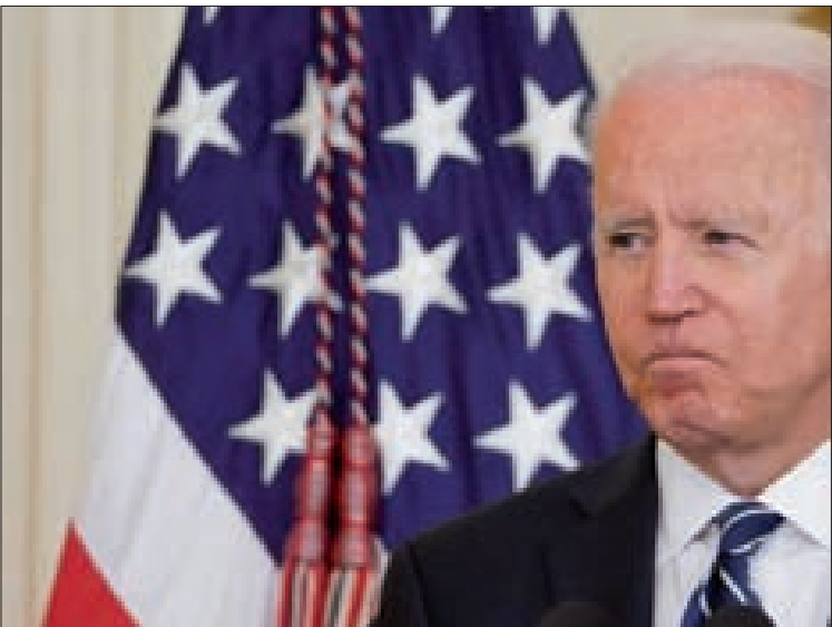
بايدن أقر بأن بعض الأفعال الأميركية في السنوات الأخيرة قوّضت النظام العالمي

استفقر الجانب الأمريكي، ورفع درجة جهوزيته ومراقبته للمناورات العسكرية بنشر 3 مدمرات وقطع عسكرية أخرى في المياه الإقليمية، وفسر الخطوة «غير المسبوقة» لروسيا بأنها جزء من خطة متكاملة لتطوير قدراتها العسكرية في مرحلة ما بعد الحرب الباردة واستعراض القوة بعيداً عن حدودها الجغرافية. وزارة الدفاع الروسية أوضحت أنّ هدف المناورة هو اختبار قدرة أسلحتها على «تدمير مجموعة من حاملات الطائرات المعادية»، ما أشار إلى تدخّر القاذفات الروسية بصواريخ مضادة للسفن. اعتبر الجانب الأمريكي أنّ العقيدة الروسية الجديدة تتمحور حول تكثيف الهجمات على شبكات الدفاع الجوي المعادية، استكمالاً للعقيدة السابقة بقصف سريع للسفن بصواريخ مضادة، لكن الجديد