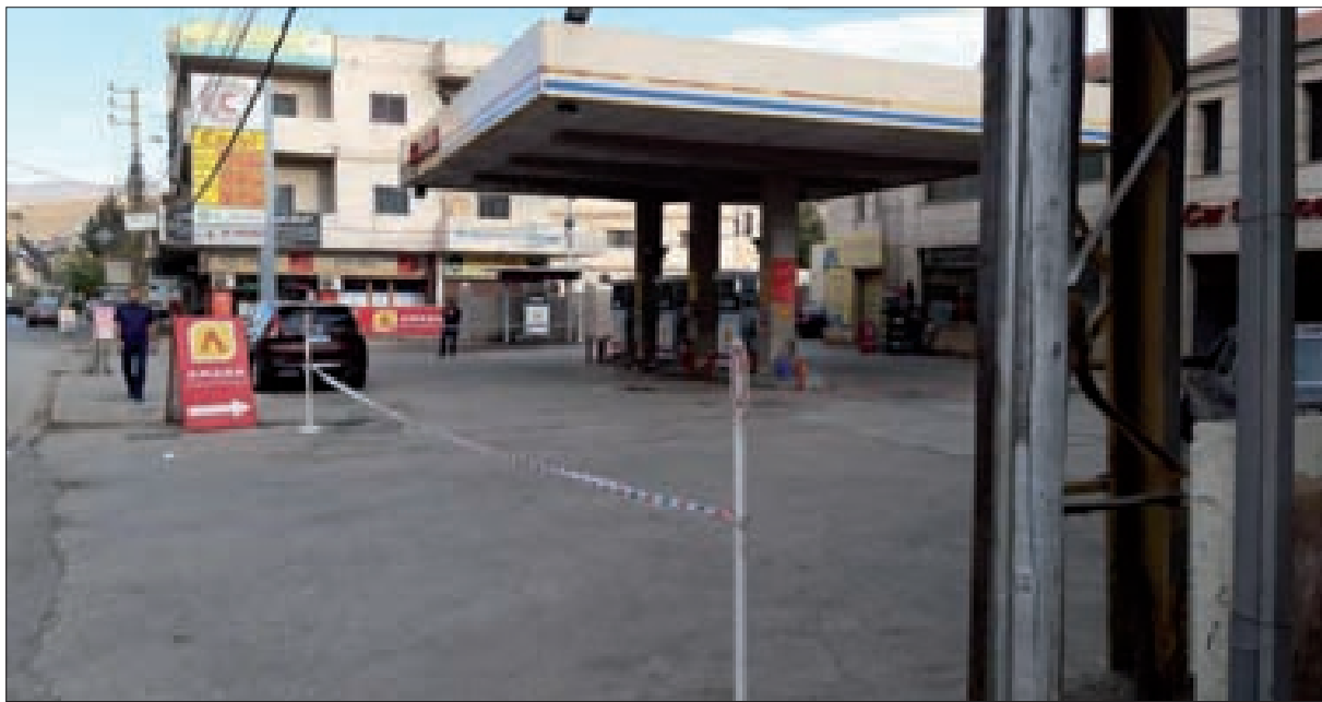
المحطات أقفلت والأزمة اشتدت... والحل باتفاق وزارة الطاقة ومصرف لبنان على التسعير!

الجمهورية، ومن دون تلاقهما على توافق الحد الأدنى سيبقى البلد بلا حكومة، في ظل حرب إلغاء تخوضها المرجعيات السياسية والطائفية على بعضها بعناوين التوازنات والصلاحيات، التي لا تعادل شيئاً في ميزان الأزمات المفتوحة والمتفاقمة. وفقاً لأبسط المقاربات الإستعصاء القائم يمكن تخطيه لو كانت لدينا حكومة فاعلة، فحصر الدعم للبنزين بمئة لتر لكل سيارة شهرياً، ودعم المازوت بألف لتر شهرياً لكل مئة ك. ف. أ. بالإضافة للمستشفيات والمؤسسة العسكرية والأجهزة الأمنية، وتحرير الطلب من الدعم في باقي الطلب في الأسواق لن يكلف الدولة أكثر من مئة مليون دولار شهرياً، وستتكفل بوقف التهريب وتخفيف الكميات المستوردة الى النصف، وبالتالي تخفيف الطلب على الدولار في السوق، لكن هذا التدبير يحتاج حكومة ومجلساً نيابياً يعملان معاً، ولذلك تبدو التساؤلات عن غياب الحكومة والعجز عن تظهيرها رغم الكلام المتداول عن الإيجابيات، هي الأسئلة المشروعة التي تحتل الصدرة، ومثلها الأسئلة عن تشطّي الكتل النيابية وتحوّلها الى أقلّيات متنازعة. (التمتعة ص5)