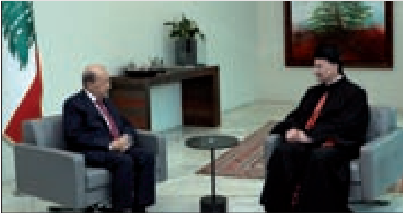
عون مستقبلاً الراعي في بعدا أس (دالاتي ونهرا)

والممرّضين، وأهم الاساتذة الجامعيين وهذا أمر خطير». وتابع «لذلك، على الحكومة العتيدة أن تكشف عن سواعدها وتواجه كل هذه القضايا، وهي ستقوم المدخل للحلول، وليس الحلّ المعلّب لجميع المشاكل (...) وهذا كان حديثنا مع فخامة الرئيس، الحريص أيضا ومن كل قلبه على تحقيق ذلك».