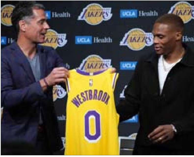
خلال المباراة من دون الحصول على الكرة، فان مفهوم التضحية يصبح أساسياً ونحن جميعاً على الموجة نفسها.

فهل وصلت الرسالة أيها المهرولون بانتجاهه للطبيع؟