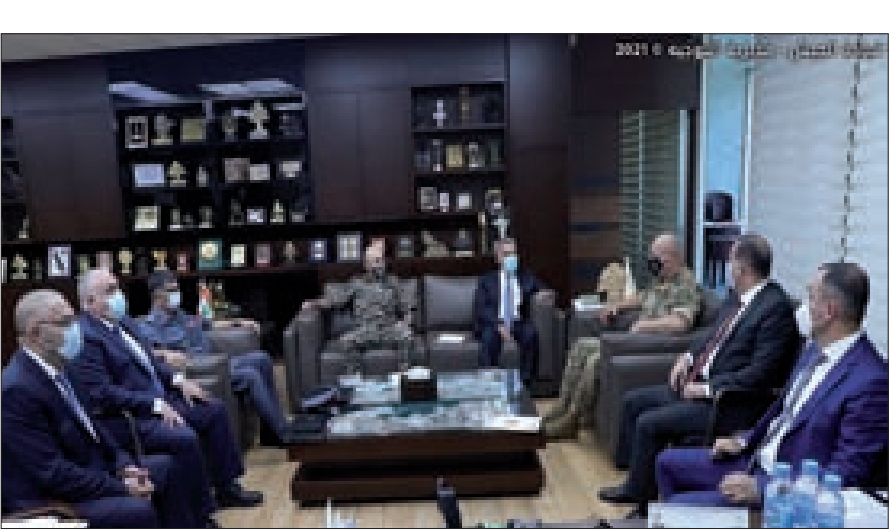
قادة الأجهزة العسكرية والأمنية خلال اجتماعهم في البرزة أس (مديرية التوجيه)

«مواصلة التنسيق في ما بينهم واتخاذ خطوات عملانية للحؤول دون تكرار الحوادث الأمنية التي حصلت أخيرا في أكثر من منطقة».