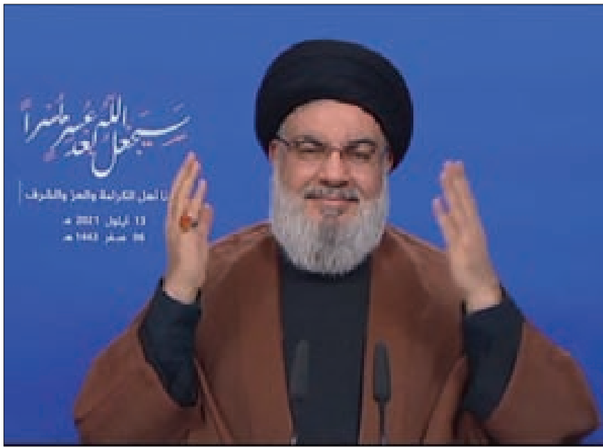
السيد نصرالله يلقي كلمته مساء أمس