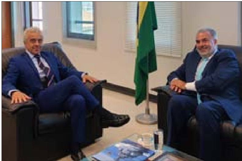
عميد الخارجية وسفير البرازيل