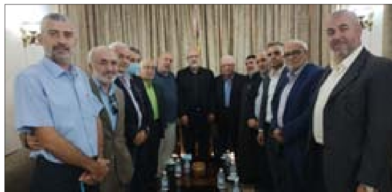
... وخلال زيارة حزب الله