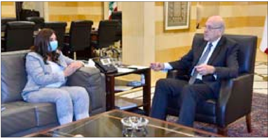
ميقاتي مستقبلاً دشتي في السرايا أمس

العلاقات الثنائية بين البلدين وأفاق التعاون. كما اجتمع ميقاتي مع وزير العدل هنري خوري وعرض معه ملفات وزارته. وأعلنت رئاسة الحكومة أن رئيس الوزراء ووزير الدفاع الأردني الدكتور بشر الخصاونة سيصل إلى لبنان في زيارة رسمية على رأس وفد وزاري. وسوف تعقد المحادثات الرسمية بين رئيسي وزراء لبنان والأردن عند الساعة العاشرة والربع من صباح اليوم الخميس في السرايا الكبرية، يليها اجتماع موسع بمشاركة الوفدوفدين اللبناني والأردني ثم لقاء صحفي مشترك. بعد ذلك سيتوجه رئيس وزراء الأردن إلى القصر الجمهوري للقاء رئيس الجمهورية ميشال عون، ثم ينتقل إلى عين التينة للقاء رئيس مجلس النواب نبيه بري، بعدها يلبي الوفد المرافق دعوة الرئيس ميقاتي إلى الغداء. وبعد الظهر يغادر رئيس وزراء الأردن والوفد الوزاري بيروت إلى عمان. ومساءً أمس، وصل الخصاونة إلى مطار بيروت الدولي على رأس وفد وزاري أردني، وكان في استقباله الرئيس ميقاتي والسفير الأردني في لبنان وليد الحديدي.