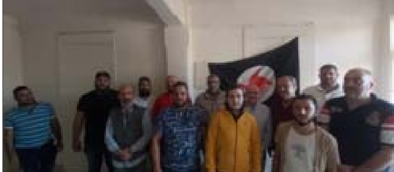
المنتمون الجدد في حاصبيا