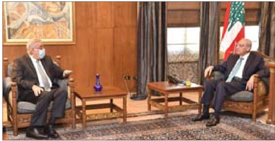
بري خلال لقائه بو حبيب في عين التينة أمس

الديبلوماسية». وبحث بوحبيب مع سفير الاتحاد الأوروبي لدى لبنان رالف طراف، في العلاقات الثنائية وإعادة تفعيل المشاريع واللجان المشتركة بين لبنان والاتحاد الأوروبي في المرحلة المقبلة والتي كانت توقفت خلال فترة تصريف الأعمال للحكومة السابقة. كما جرى البحث في موضوع تنظيم الانتخابات النيابية، والتقى بوحبيب رئيس دائرة الشرق الأوسط في وزارة التعاون الاقتصادي والتنمية الألمانية كلوس كرامر ووفد البنك الألماني gtz لإعادة الإعمار والوكالة الألمانية للتعاون الدولي kfw. وعرض وزير الخارجية خلال اللقاء، لرؤية الحكومة وعزمها على إجراء إصلاحات حقيقية وإجراء الانتخابات النيابية في موعدها، مرجحاً بمشاركة مراقبين عن الوكالة الألمانية والوكالات الأخرى لضمان نزاهة عملية الانتخابات. بدوره، عرض الجانب الألماني لإمكان التعاون بين وزارة الخارجية والوكالتين والمشاريع التي يعملون عليها وإمكان تطويرها مستقبلاً.