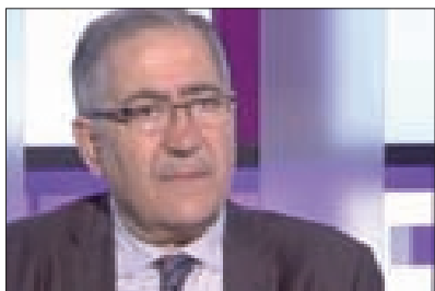
الراحل الدكتور وفيق إبراهيم

أعرب وزير الإعلام اليمني ضيف الله الشامي عن «خالص الغراء والمواساة للوسط الإعلامي العربي» بوفاة الكاتب والمناضل والأستاذ الجامعي الدكتور وفيق إبراهيم «بعد حياة حافلة بالعلماء والنضال مدافعاً عن قضايا الأمة». وأشاد الشامي «بمواقف الفقيه الصادقة والشجاعة، وانحيازها إلى جانب القضية الفلسطينية، ومناهضة الهيمنة الأميركية و«الإسرائيلية»، ومناصرتها للشعب اليمني منذ بدء العدوان الأميركي السعودي». وقال: «كان الراحل عنواناً للشجاعة والإرادة الحقة، يمانيا في المبدأ والموقف، وهو ينود عن مظلومية الشعب اليمني بقلمه ولسانه»، معتبراً الراحل «من أبرز الكتاب في لبنان، وصاحب قلم حر مقاوم، تميّز بمواقفه المبدئية والناطقة إلى جانب دول محور المقاومة». وأكد أن الإعلام المقاوم «فقد برحيل الدكتور وفيق أحد الكتاب المخضرمين الذين لا يذاهنون في مواقفهم، ولا يمكن تعويضهم».