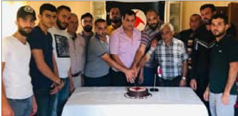
قطع قالب الحلوى احتفاءً بالمنتمين الجدد في وادي خالد