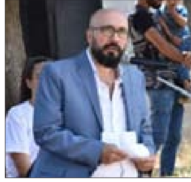
العميد إيهاب المقداد

انتتم إليها الأشبال والزهرات مستقبل الحزب، وعليكم الرهان، فكونوا على قدر المسؤولية، واضلوا على دروسكم وتحصيلكم العلمي، وكونوا قدوة في مدارسكم، نجاحاً وأخلاقاً وقيماً، وطوعاً لنديكم الذين نشكركم على تحفيزكم على المشاركة في المخيم. تخلل الحفل قصيدة شعرية ألقاها الشاعر القومي منير حنا، وعروض في النظام المنظم فقرات فنية. بعد كلمة العميد، تم توزيع الشهادات على المشتركين، ليختتم المخيم بخفض العلم.