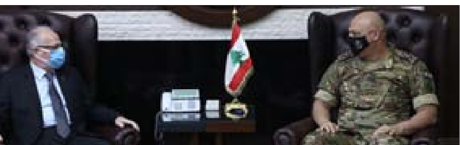
قائد الجيش مستقبلاً وزير الدفاع في البرزة أمس

التي كان عقدها الرئيس ميقاتي مع مكارون وتطرق البحث أيضاً إلى الانتخابات النيابية التي ستحصل في السنة المقبلة، إضافة إلى العلاقات الثنائية ووضع القوة الدولية العاملة في الجنوب (يونيفيل). عزّد عضو كتلة «التنمية والتحرير» النائب الدكتور قاسم هاشم عبر حسابه على «تويتر»، كاتباً «عندما يقول سليم صفيّر إن المصارف غير مفلّسة وهي حاضرة للمساعدة بالانتعاش الاقتصادي، فالأولى بجمعيته ومصافهم إعادة الأموال إلى أصحابها وذلك أهم وأقدس من مساهماتهم». - استقبل قائد الجيش العماد جوزاف عون في مكتبه بالبرزة، وزير الدفاع الوطني موريس سليم، وعرض معه شؤوناً تتعلق بالمؤسسة العسكرية. كما التقى عون السفير التركي في لبنان Ali Baris ULUSOY وعرض معه علاقات التعاون بين الجيشين اللبناني والتركي.