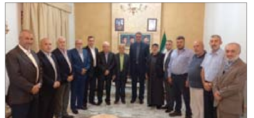
خليلي متوسطاً وقد أحزاب طرابلس في السفارة الإيرانية

وحماته مهما كلف ذلك من تضحيات». وختم بالقول «إن إيران كانت وما زالت وستبقى حريصة على تقديم كل دعم ممكن للبنان ولن نتردد في الاستجابة لوقف معاناة اللبنانيين». وفي نهاية اللقاء تم التوافق على أهمية وضروة استمرار التواصل نظراً للقواسم المشتركة التي تجمعهم خصوصاً وأنهم يواجهون الأعداء أنفسهم.