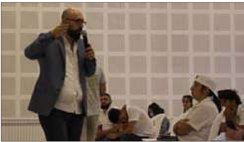
الامين ايهاب المقداد