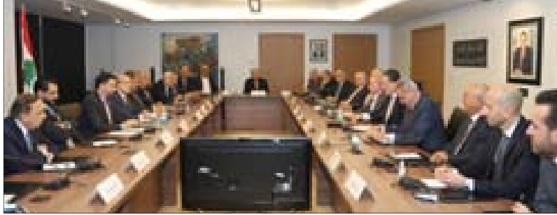
وزير الاقتصاد خلال لقائه الهيئات الاقتصادية أمس.

المذكرة والتي دار حولها نقاش طويل مع الحضور، حرصه على «إقرار قانون المنافسة، الذي أصبح في مراحله النهائية، بشكل أن يكون قانوناً عصرياً يتلاءم مع ما هو معمول به في الدول المتقدمة»، مشيراً إلى أنه «لا يُمكن مقارنة الأمور من خلال المواقف الشعبية، خصوصاً في هذه المرحلة الدقيقة التي يمرّ فيها البلد، ولا سيما في بعض الملفات الحساسة مثل الوكالات الحصرية، لذلك لا بدّ من إجراء مقارنة علمية