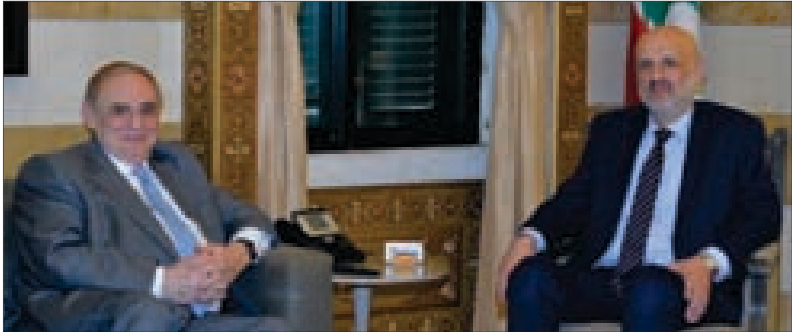
مولوي مستقبلاً ألبستاني أمس

- دعت قيادة الجيش – مديرية التوجيه الإعلاميين المعيّنين لتغطية وقائع الاحتفال لمناسبة عيد الإستقلال في وزارة الدفاع الوطني، الحضور وفقاً لما يأتي: التوقيت: قبل الساعة السادسة. المسلك: طريق الشام – مستديرة تمثال فخر الدين وصولاً إلى محطة المحرقات العسكرية مقابل كنيسة القديسة تيريز.