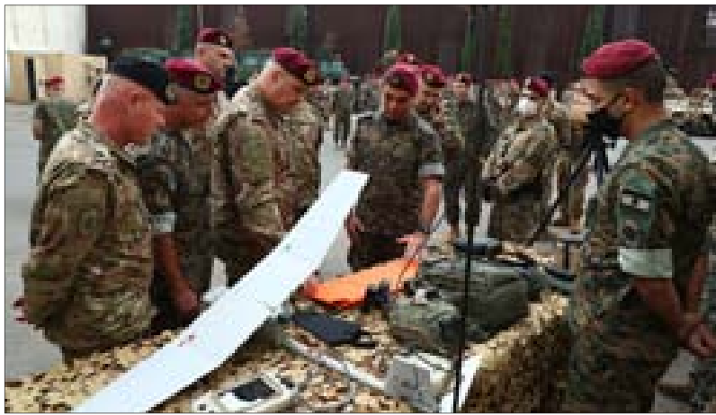
قائد الجيش خلال تفقده فوج المغاوير أمس

الأمّن في الداخل والمساهمة في حماية الأمن المعيشي والإنمائي، كل هذا رسخّ دعائم الاستقلال كفتكمت على قدر المسؤولية الوطنية الكبرى الملقاة على عاتقكم». وختّم «أيها العسكريون، إن صيغة العيش المشترك تصونها العقول الواعية والعيون الساهرة، كما أنّ ديمومة الاستقلال تحمئها دماء الشهداء والجرحى وإرادتكم الصلبة، كونوا