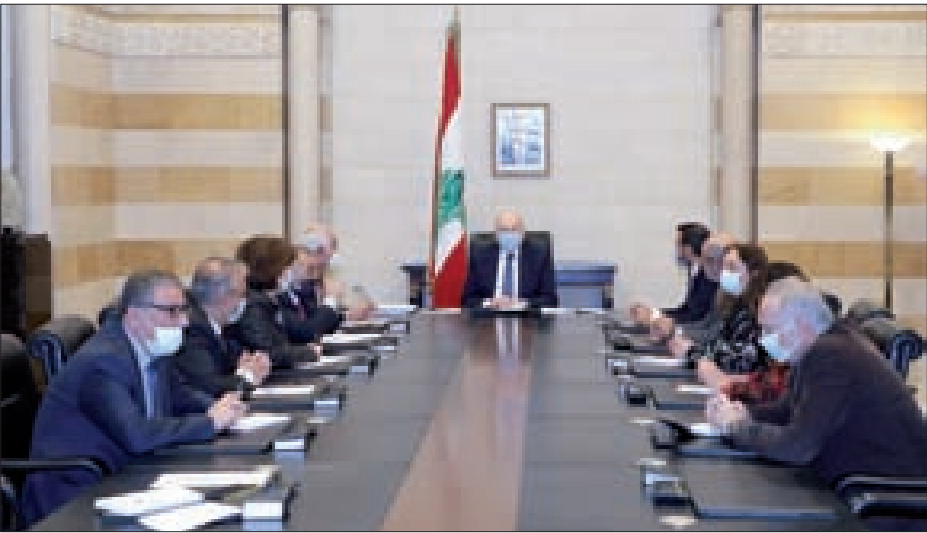
ميقاتي مجتمعاً إلى التصفيي ومجلس نقابة المحررين في السرايا أمس