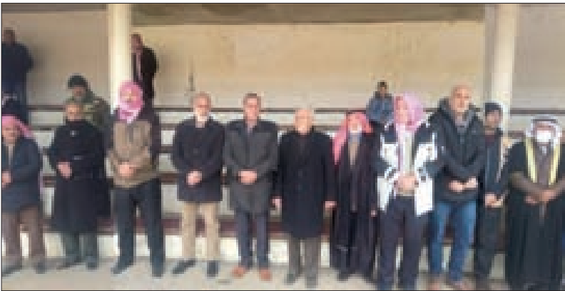
الأمين الراحل مصطفى الغوثاني