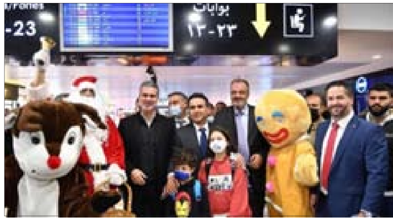
حمية والوزراء خلال إطلاق خطة تفعيل وتعزيز دور المطار

وأشار إلى أنه «نظراً لما تشكله المنشآت النفطية المخصصة لتزويد الطائرات بالوقود في المطار من أهمية حيوية، وهي عنصر أساسي لتأمين السلامة العامة. ويعد توقف أعمال إعادة التأهيل لتلك المنشآت فقد عدت الوزارة وبالتنسيق مع أجهزة الرقابة الإدارية، إلى إعادة إطلاق العمل بورشة التأهيل، على أن تتم بسرعة مع الحفاظ على الجودة المطلوبة». وأوضح أنه «ضمن إطار التعاون القائم بين لبنان و ألمانيا في مجال النقل الجوي وتحديداً في مجال أمن الطيران المدني، حيث تيلغنا بكتاب من الجانب الألماني، نيته إرسال فريق تقني إلى مطار بيروت مطلع الشهر المقبل، وذلك لوضع المسامات الفنية الأخيرة تمهيدا لقيام الجانب الألماني بتقديم هبة عبارة عن أجهزة كشف بالأشعة السينية على حقائب الركاب المغادرين