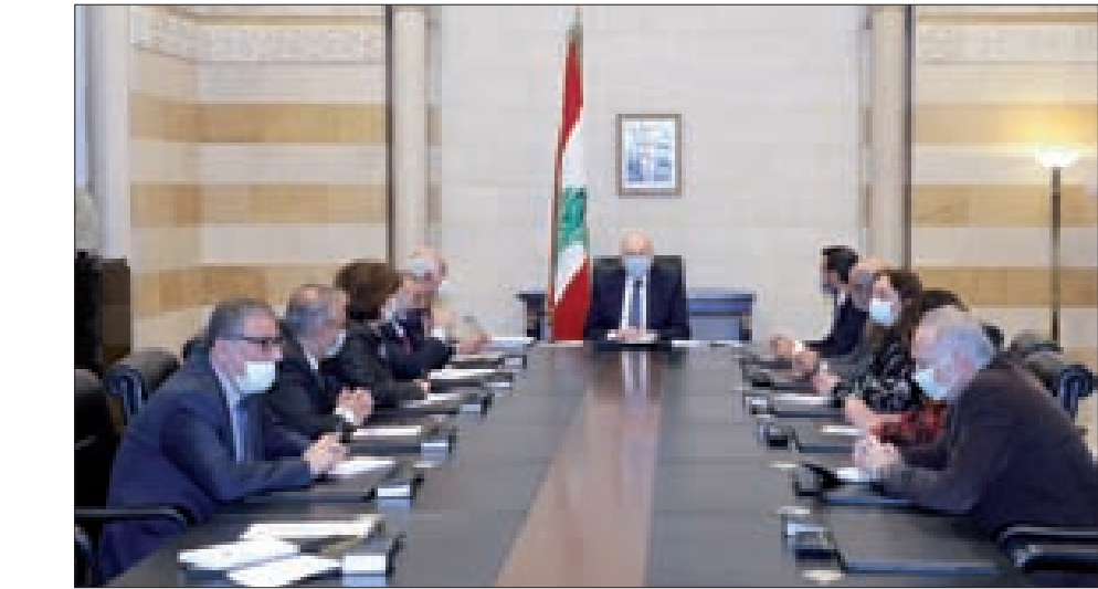
ميقاتي مجتمعاً إلى التصفيي ومجلس نقابة المحررين في السرايا أمس