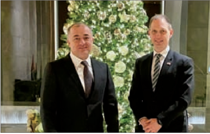
بو صعب وسفير بريطانيا

أبرق عميد المجلس العام المارونّي الوزير السابق وديع الخانز إلى أمير قطر تميم بن حمد آل ثاني، مهنيّاً بمناسبة اليوم الوطني لدولة قطر. وما جاء في البرقية «إننا، إن نفتخر بهذه النهضة الحضارية الشاملة والإنجازات المشهودة التي تحقّقت باضطراد في الميادين التنموية كافة، وعلى مختلف الأصعدة بفضل قيادكم الحكيمة، نعبر عن خالص الاعتزاز والفخر لما تبدّلونه من جهد قيمّ في دعم ونصرة القضايا العربية وتحقيق النضام العربي في جميع مجالاته». وختمّ «نتضرّع ونطلب من الله العليّ القدير أن يمتعكم بوفور الصحة والسعادة، وأن يديم على دولة قطر الغالية نعمة الأمن والتقدم والإزدهار، وأن يسدّد خطاكم لمواصلة قيادة مسيرة الخير والعطاء لما فيه خير وتقدم الشعب القطري الشقيق، وخير لبناننا الحبيب وأمتنا».