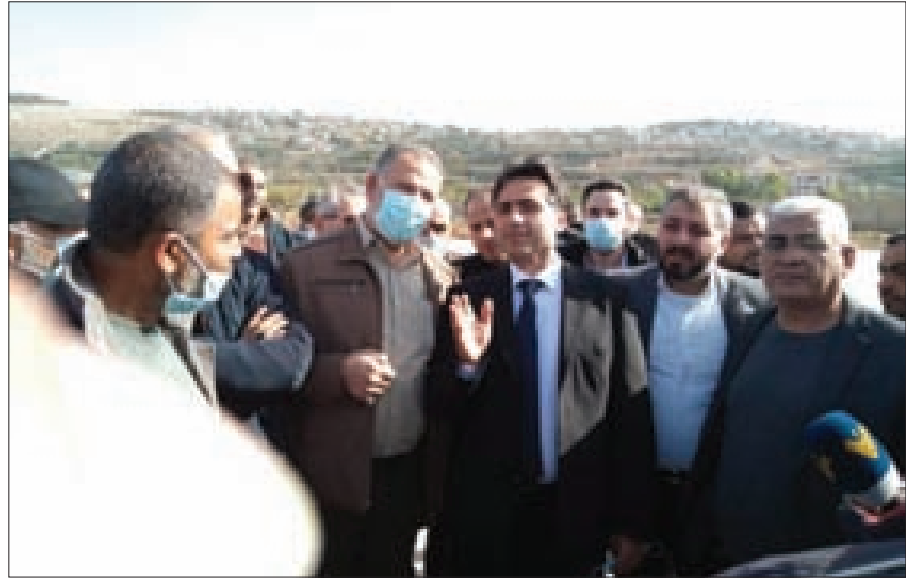
حمية خلال جولته الجنوبية

وتقوم بتجهيز سيارته لحل الموضوع. وأعلن أنه خلال ما يقارب 15 يوماً سونؤمن صيانة الـ45 بأصاً، مع الجانب الفرنسي حول هبة الباصات، وبالتالي الخطة هي أن تمتلك إدارة مصلحة سكك الحديد والنقل المشترك، مئات من الباصات وضمن دفتر الشروط بطريقة الشراكة مع القطاع الخاص وتأمين مصادر النقل المشترك».