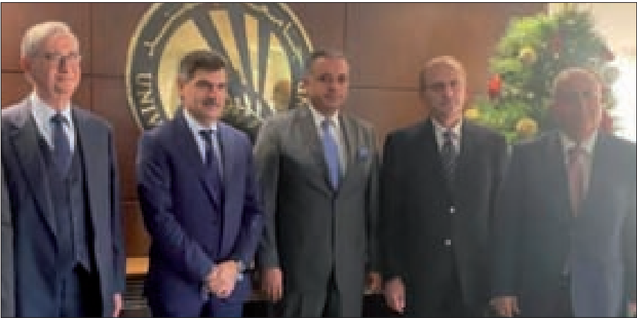
المرضى متوسطاً الوراق وعدداً من مستقبليه في جامعة البلمند

ومشغلوه إلى استيلاء الفنن والى بثّ الفرقة وتاليب اللبنانيين بعضهم على بعض وزرع القناعة بانه لا يمكن لنا الاستمرار في مبدأ الرسالة معا.