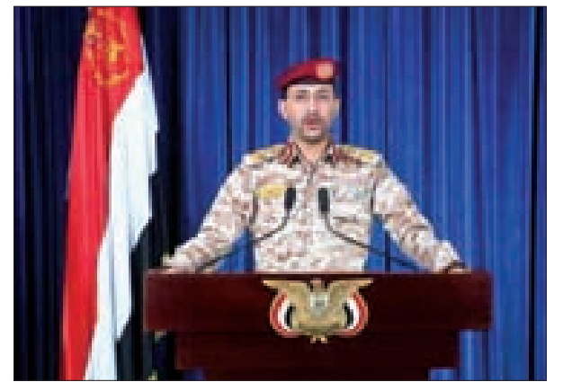
الجنرال يحيى سريع يوجه تحذيراً جديداً للإمارات من خلال معرض «إكسبو دبي».

وجّه المتحدث باسم القوات المسلحة اليمنية العميد يحيى سريع، أمس، تحذيراً جديداً للإمارات من خلال معرض «إكسبو دبي». وقال سريع في تغريدة على «تويتر»: «إكسبو.. لكي تكون آمناً... نكرر النصح». وكان سريع قد وجّه تحذيراً سابقاً لمعرض «إكسبو - دبي» في تغريدة عبر «تويتر»، أيضاً، قال فيها: «إكسبو... معنا قد تخسر، ننصح بتغيير الوجهة». من جهته، قال وزير الإعلام في حكومة صنعاء ضيف الله الشامي إن «من البديهي أن للتحذير الجديد لناطق الجيش اليمني دلالاته العملية، وأن العدو الإماراتي ومن يدفع به سيتحملون تبعات المستقبلية». وأضاف الشامي: «الحجة قائمة لأصحاب رؤوس المال المغامرين بتجارتهم أن لا يواكبي بعد الإنذار. فقد أعز من أنذر».