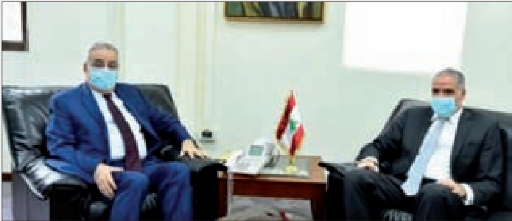
بو حبيب وطراف خلال لقاءهما أمس

● استقبال وزير الخارجية والمغتربين الدكتور عبدالله بو حبيب سفير الاتحاد الأوروبي لدى لبنان رالف طراف، وجرى البحث في نتائج زيارة بو حبيب الكويت، كما تطرّق اللقاء إلى موضوع العلاقات بين لبنان والاتحاد الأوروبي والقضايا المشتركة والأولويات الحالية. ● غرّد النائب اللواء جميل السيد عبر حسابه على «تويتر»، كاتباً «صحيح هبط الدولار من 33 ألف ليرة إلى 21 ألف ليرة، وصحيح أنّ هذا الهبوط موقت لتمرير الموازنة ولأنّ منصّة مصرف لبنان تباع فوق 40 مليون دولار يومياً، لكن أسعار المواد الغذائية والطحين والمازوت وغيرها لم تنخفض بل زادت والليرة صارت ورقاً ولا من يراقب. والحكومة؟ خود يا موظف ورق قد ما بدك». ● أعلن النائب شامل ركوك على حسابه على «تويتر»، رفضه «أن يكون اللبنانيون عموماً والعسكريون والموظفون في القطاع العام، ضحية لتخصيص التعاميم وإخفاقات القرارات والإجراءات». وقال اليوم، هم مجبرون على تقاضي رواتبهم بالدولار حسب سعر منصّة صيرفة، ليصرفوها بكلفة أقل في السوق السوداء، فيخسرون نسبة من رواتبهم التي هي أساساً محدودة القدرة الشرائية». ورأى أن «المطلوب معالجة فورية إذ من غير المقبول أن يدفع الناس الثمن فيكونوا دوماً الضحية».