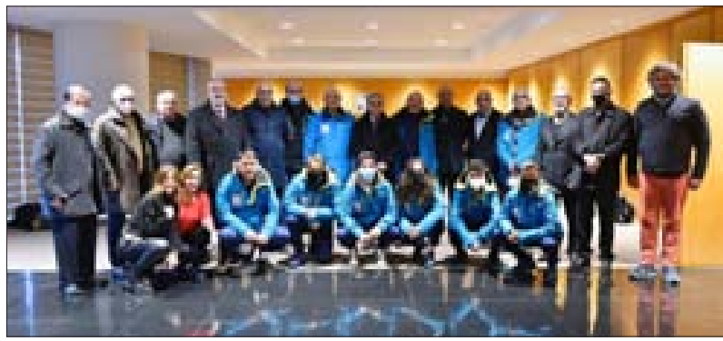
لقطة جامعة لحضور حفل وداع البعثة