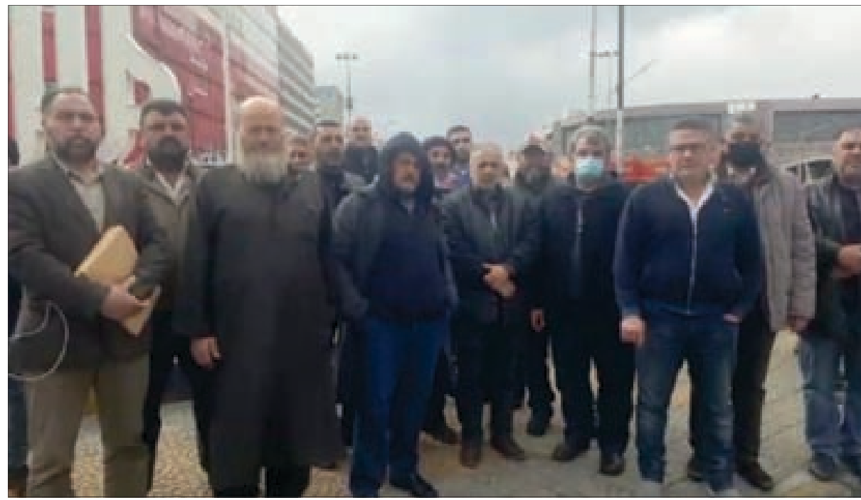
أهالي الطلاب اللبنانيين في أوكرانيا خلال الاعتصام في طرابلس أمس

بيان «الدولة اللبنانية بكل مؤسساتها العمل على تأمين إجلاء آمن لكل الطلاب اللبنانيين الراغبين في مغادرة أوكرانيا على نفقتهم أو نفقة من سرق المال العام وامتدت يده إلى المال الخاص والودائع المصرفية العائدة إلى الطلاب وأوليائهم»، محملة إياها «مسؤولية كل طالب أو مغترب لبناني قد يصيبه أي أذى