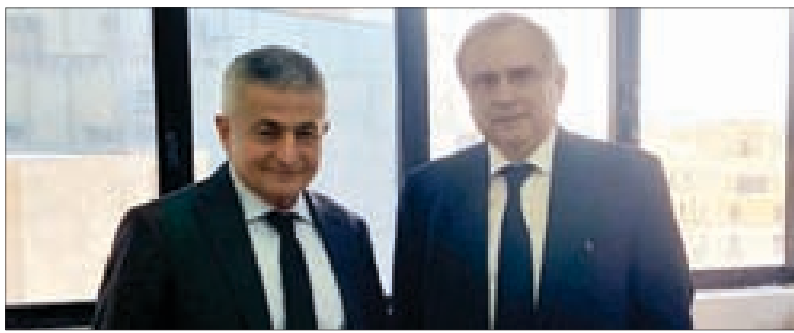
خليل وحبيب خلال لقاءهما أمس

في إطار جولته على المسؤولين المعنيين، زار المدير العام لمصرف الإسكان أنطوان حبيب وزير المال يوسف خليل وأطلعته على خطة المصرف لإعطاء قروض طويلة الأجل لدوي الدخل المحدود والمتوسط عطفاً على اتفاقية القرض الممنوح من الصندوق العربي للاستثمار الاقتصادي والاجتماعي البالغ 50 مليون دينار كويتي أي ما يوازي 165 مليون دولار أميركي. وتضمن حبيب على خليل تسمية ممثل عن وزارة المالية في مجلس إدارة مصرف الإسكان وفقاً لما هو وارد في النظام الأساسي للمصرف، على أن يسمّى وزير الشؤون الاجتماعية والعضو الثاني في مجلس الإدارة حتى يكتمل