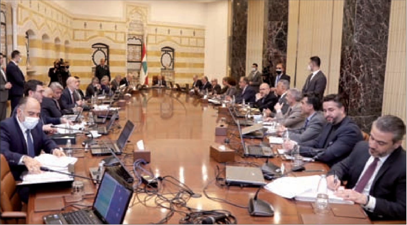
مجلس الوزراء مجتمعاً برئاسة عون في بعبداء أمس

وقال «سنعمل على تقليص الهدر وزيادة الجباية في سياق الخطة والعمّادات الذكية تلعب دورا وسترفع كلفة الكهرباء لتأمين التغذية ولكن لن تحصل أي زيادة قبل زيادة ساعات الكهرباء وتعرفة كهرباء لبنان، أقل بـ70% من تعرفه المولدرات.»