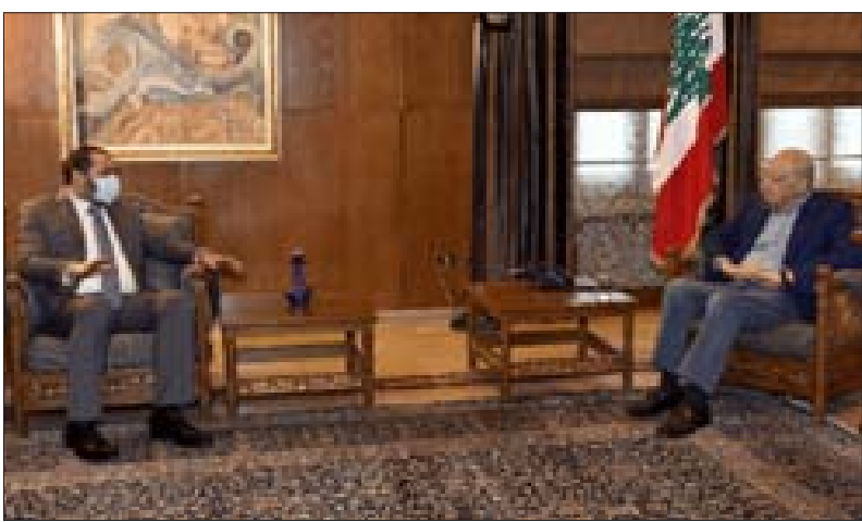
بري مستقبلاً حجازي في عين التينة

نقل الأمين القطري لحزب البعث العربي الاشتراكي في لبنان علي حجازي عن رئيس مجلس النواب نبيه بري، بعد زيارته في مقر الرئاسة الثانية في عين التينة، تشديده على أهمية إجراء الانتخابات النيابية في موعدها المحدد وتأكيد ضرورة دعوة سورية إلى اجتماع اتحاد البرلمانات العربية. وقال حجازي بعد اللقاء «تداولنا مواضيع الساعة وشدد دولته على أهمية إجراء الانتخابات النيابية في موعدها المحدد من دون أي تأخير. كما تباحثنا في مجموعة من القضايا المشتركة منها ما له علاقة بالانتخابات النيابية، الرئيس