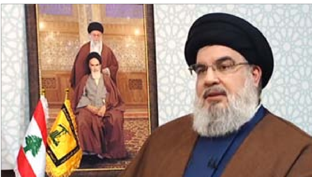
السيد نصرالله خلال حديثه التلفزيوني مساء أمس

أكد الأمين العام لحزب الله السيد حسن نصر الله، أنّ الحزب يتعامل مع التهديدات «الإسرائيلية» بشكل جدّي، معلناً أنّ «حجم انتشار القدرة الصاروخية للمقاومة وعدد الصواريخ كلها لا تتنبح للعدو أن يقوم بشيء ضد لبنان»، سائلاً «هل الإسرائيلي يعرف أعداد الصواريخ الدقيقة أو أماكنها مثلاً».