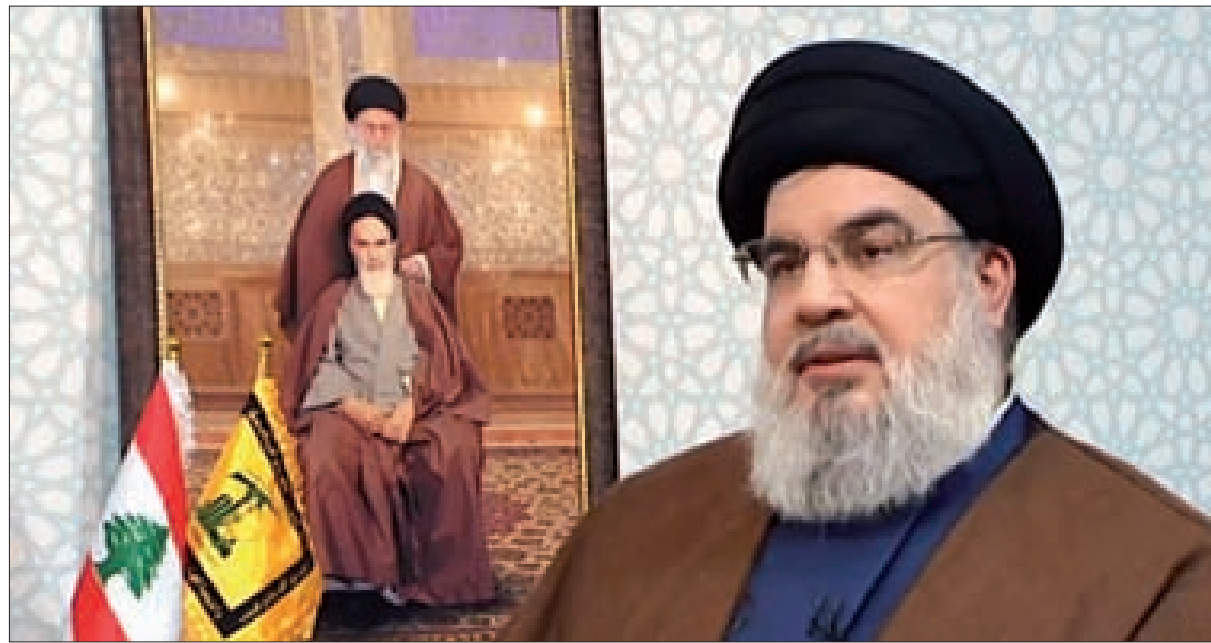
السيد نصرالله خلال حديثه التلفزيوني مساء أمس