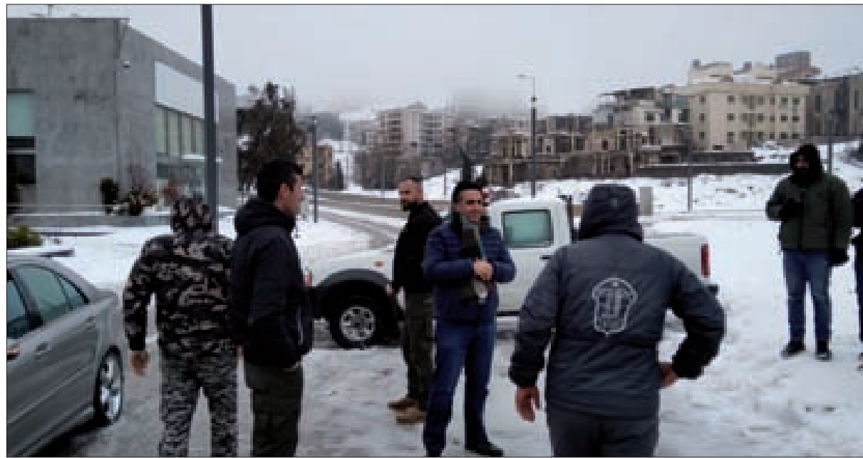
الوزير علي حمية مع عناصر قوى الأمن في بحدون خلال متابعته عمليات فتح الطرق الجبلية

يتم إعلان الضربة التي استهدفت المحيط الأمني للقنصلية الأميركية، باسم الحرس الثوري موضوع التجاذب حول العقوبات، وبصاروخ دقيق من الصواريخ التي يسعى الأميركيون لجعلها موضوع تفاوض؛ لكن يبقى، كما قالت المصادر العراقية إن وضع ملف حضور الموساد في كردستان العراق على الطاولة، تحوّل نوعي في المشهد العراقي، حيث لا مناص أمام جميع المكونات مهما كبرت، من التعامل بجدية مع الموضوع. ما دام من يقف وراءه جهة وازنة وفاعلة وتملك الملفات اللازمة للبحث، كما هو الحال مع الحرس الثوري الإيراني. في المشهد الأوكراني بقيت الضغوط الأميركية لتفعيل العقوبات على روسيا عنوان الحراك السياسي الغربي، خصوصاً مع الخشية من إفلات عدد من حلفاء واشنطن من سلسلة العقوبات وتحول مصارفهم إلى ملاذات للأموال الروسية المعاقبة، وتهتم واشنطن للالتزام كل من تل أبيب وأنقرة ودبي، حيث للمتولين الروس علاقات مصرفية وثيقة، وحيث لا يزال التهرب من المشاركة بالعقوبات خشية العواقب يطغى على سلوك «إسرائيل» وتركيا والإمارات، بينما تنجّه واشنطن للتحدث مع الصين أملاً بالحصول (النتمة ص4)