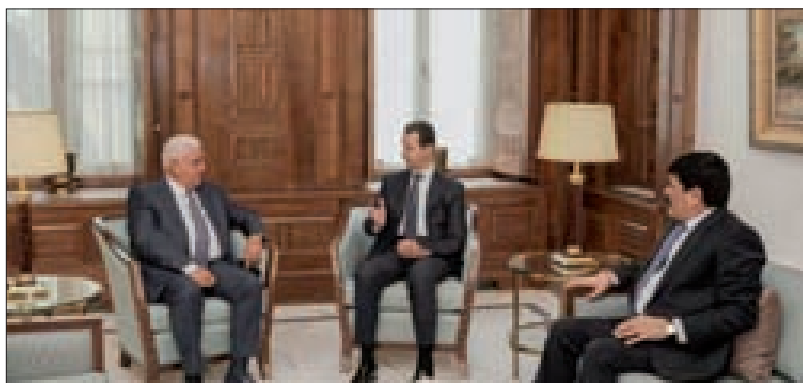
الأسد مجتمعاً إلى رئيس هيئة الحشد الشعبي

استقبل الرئيس السوري بشار الأسد رئيس هيئة الحشد الشعبي في العراق فالح الفياض وناقش معه مجالات التعاون القائم بين البلدين، خصوصاً المواضيع الأمنية المشتركة والتي تتعلق بضبط الحدود ومكافحة التنظيمات الإرهابية الموجودة في تلك المنطقة. وجرى التأكيد على أهمية تكثيف الجهود في مواجهة ما تقوم به الدول الداعمة للإرهاب من محاولات إعادة إحياء هذه التنظيمات والعودة لضرب الاستقرار الذي فرضه الجيش السوري والعراقي على طرفي الحدود. وكان رئيس الوزراء السوري حسين عرنوس بحث في اتصال هاتفي، أمس، مع نظيره العراقي مصطفى الكاظمي سبل تعزيز التعاون المشترك في مختلف مجالات النشاط الاقتصادي الزراعي والصناعي والخدمي وسبل تعزيز التبادل التجاري في سياق تعزيز ربط سوقي البلدين وتحقيق أكبر قدر ممكن من التكامل بينهما بالاستفادة من العلاقات التاريخية لقطاع الأعمال في البلدين. وتناول الحديث سبل التعاون في قطاع الطاقة بالاستفادة من الموارد والبني التحتية المتوفرة لدى البلدين واستثمارها على النحو الأمثل في ضوء عدم الاستقرار الذي تعاني منه أسواق الطاقة العالمية. كما تطرق الحديث إلى التحديات التي يواجهها القطاع المالي في البلدين، حيث تم التأكيد على ضرورة استمرار التنسيق المشترك لضمان الإبرارة الرشيدة للموارد المائية والحصول على الحقوق المائية لسورية والعراق وفق المعاهدات والقوانين الدولية.