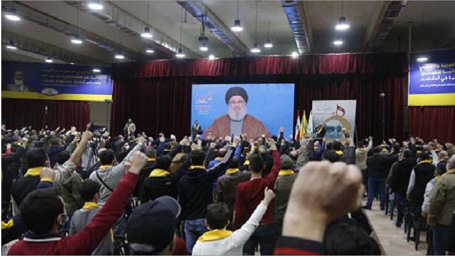
السيد نصرالله متحدّثاً بمناسبة يوم الجريح أمس

وأكد السيد نصر الله أنّ السفارة الأميركية هي من تمنع الردّ اللبناني على عرض الشركة الروسية.