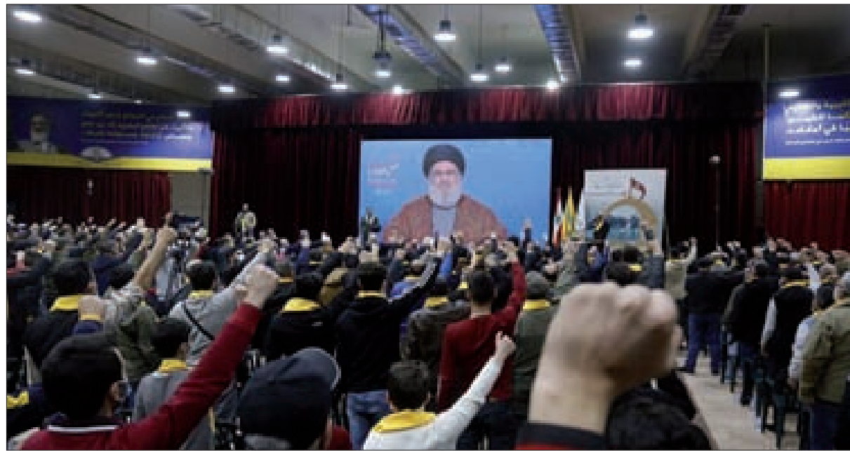
السيد نصرالله متحدثاً بمناسبة يوم الجريح أمس

قلق أوروبي من حرب الأسعار وتدايعاتها. وبحساب بسيط تبدو روسيا قادرة على تعويض كل خسائر العقوبات من زيادة الطلب على شراء النفط والغاز وارتفاع الأسعار، بحيث بلغت مبيعاتها يوم الاثنين الماضي مليارا ونصف مليار دولار مقابل ثلاثمائة مليون دولار في الأيام العادية، والرقم مرشح للارتفاع الى الضعف ربما في الاثنين المقبل. بينما تبدو أوروبا خاسرا كبيرا من كل ما يجري، فقد سددت ثمن الحماية الأميركية ولم تحصل عليها، وسارت بالعقوبات الأميركية ودفعت هي ثمنها. المسارات الثلاثة المرتقبة للحرب الأميركية الروسية في أوروبا، هي تقدم المسار العسكري لصالح روسيا بتسارع أعلى وقد بلغ الجيش الأوكراني سقف قدرته على الصمود، وتقدم المسار السياسي نحو التفاوض على الشروط الروسية، وتحمل أوروبا أكاليف الفاتورة الاقتصادية سواء بشق اللاجئين وأكاليف استضافتهم، أو الجمود الاقتصادي، واشتعال أسواق الاستهلاك.