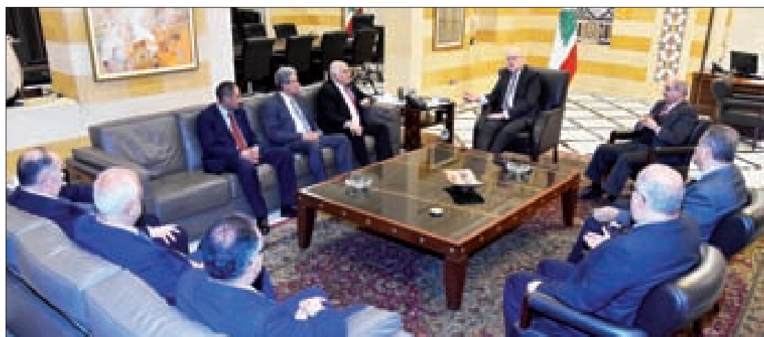
ميقاتي مجتمعاً إلى الرجوب والوفد الكشفي العربي

كشفت مصادر دبلوماسية عن ورقة عمل أوروبية قدّمت للصين بمسودة مبادرة حل وسط حول أوكرانيا للانطلاق منها لمعرفة المنطقة الوسط التي يمكن لموسكو قبولها بعدما صار واضحاً أن المسار العسكري يسير بسرعة لصالح موسكو وأن أسعار النفط والغاز ستعوّض روسيا ما خسرتة بالعقوبات.