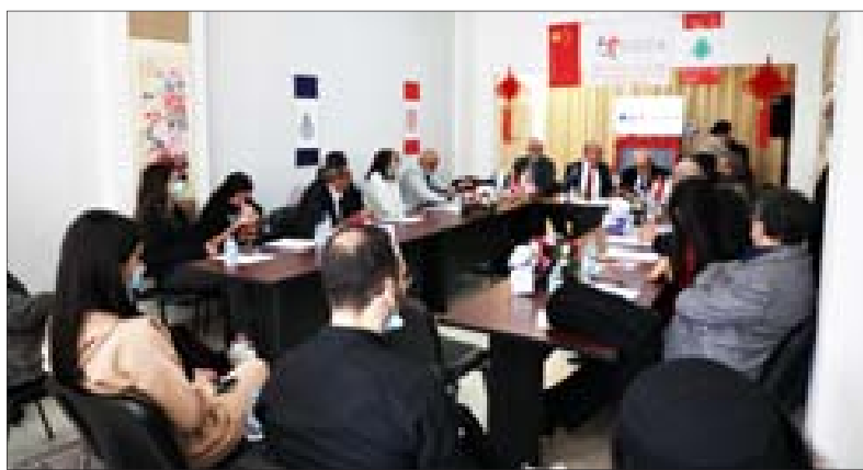
جانب من جلسات المؤتمر