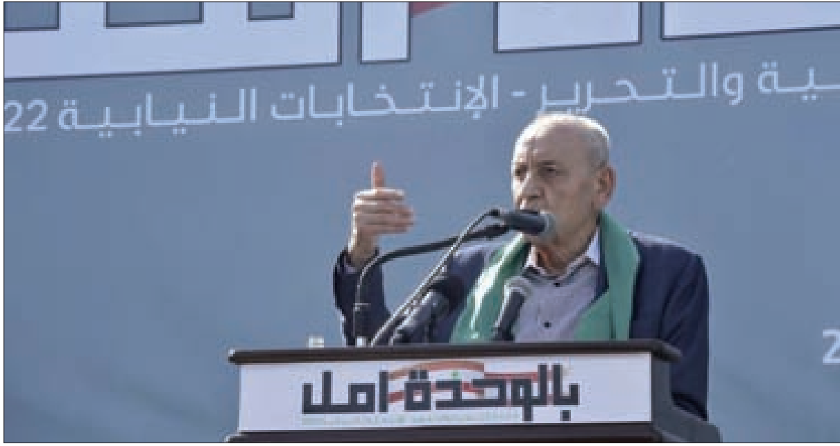
الرئيس بري يلقى كلمته في المصليح خلال إطلاق الماكينة الانتخابية

لمبدأ الخمسة زائداً واحداً، لذلك تلعب تهدئة المسارين العسكري والتفاوضي وظيفة إخلاء الساحة لملف جديد، هو معادلة الغاز الروسي لأوروبا بالروبل الروسي، التي تفتح ملف إمدادات الطاقة كعصب للاقتصاد العالمي، وملف النظام المالي العالمي وموقع الدولار كعملة حصرية للتسعير والتبادل، ووفقاً لمصادر روسية لن تتسرع موسكو في هذا الميدان المحوري والرئيسي للتوصل إلى قرارات سريعة، فالمبدأ سيبقى حاضراً، ولا مساومة على التمسك به، مع فتح الباب للتفاوض على مهل، ونسب مئوية متدرجة للتطبيق، لأن موسكو تدرك أن وقف الغاز عن أوروبا يكسر جزءاً لا تريد كسرها، والتراجع أمام أوروبا غير وارد، إلا لما تم طرح المبدأ، فكيف يتم التراجع الآن وقد صار إعلان هزيمة لن تسمح موسكو بوقوعه، فكما أن مصلحة موسكو بإبقاء الميدان العسكري سيفا مسلطاً والتفاوض على نار باردة، فإن مصلحة موسكو أن يبقى القرار سيفا مسلطاً والتفاوض على نار باردة، وإن استدعى الأمر وقف إمدادات الغاز الروسي، فالبدية ستكون بدول أوروبية غير ألمانيا، التي تشكل بيضة القبان في القرار الأوروبي، وهي بيضة القبان في الوزن الاقتصادي الأوروبي، وفي ملف الغاز الروسي والدفع بالروبل.