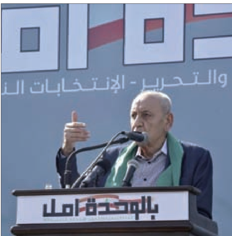
بري يلقي كلمته